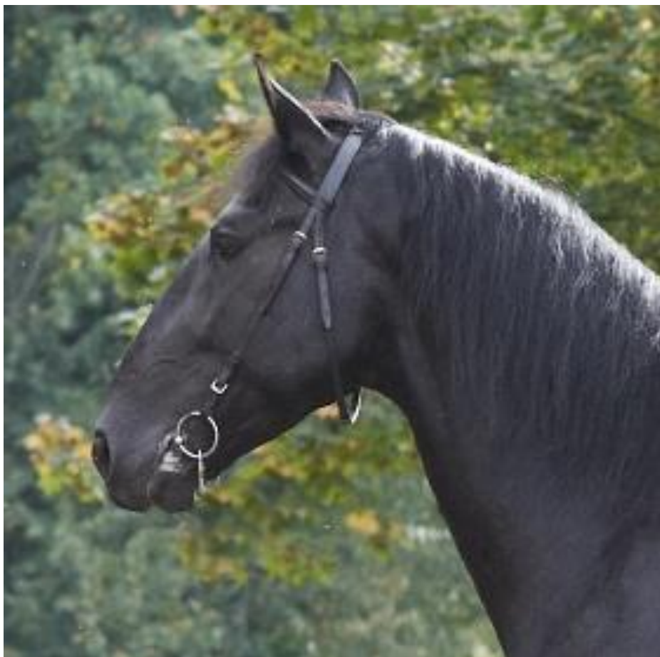
Obr. 7: Zástupce linie Siglavy Pakra 1074 SIGLAVY P.BASILIKA VIII