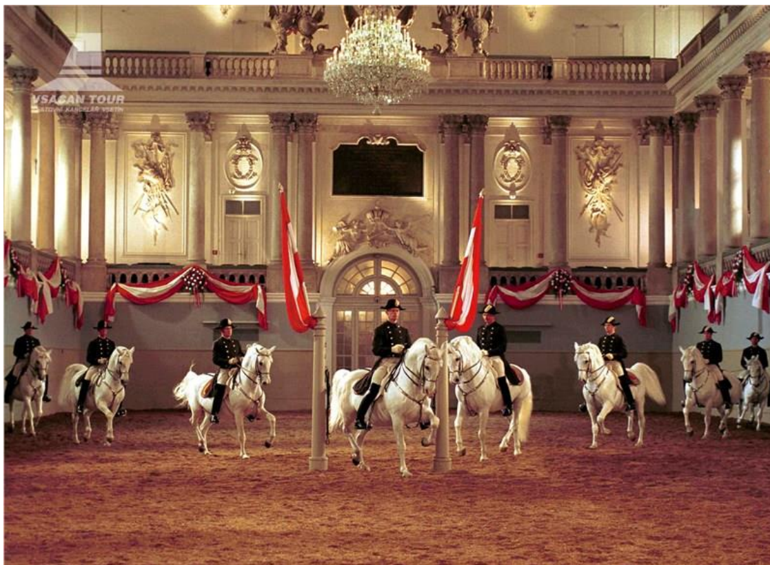
Obr. 12: Španělská jezdecká škola ve Vídni

(Dostupné z: http://www.vsacantour.cz/kategorie/jezdecka-skola-ve-vidni.aspx , datum citace 22.3.2017).