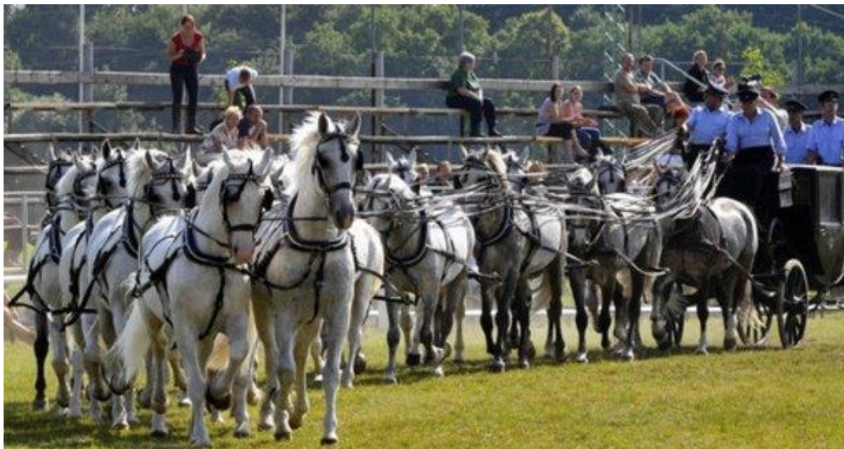
Obr. 11: 22 starokladrubských koní v jedné zápřeži