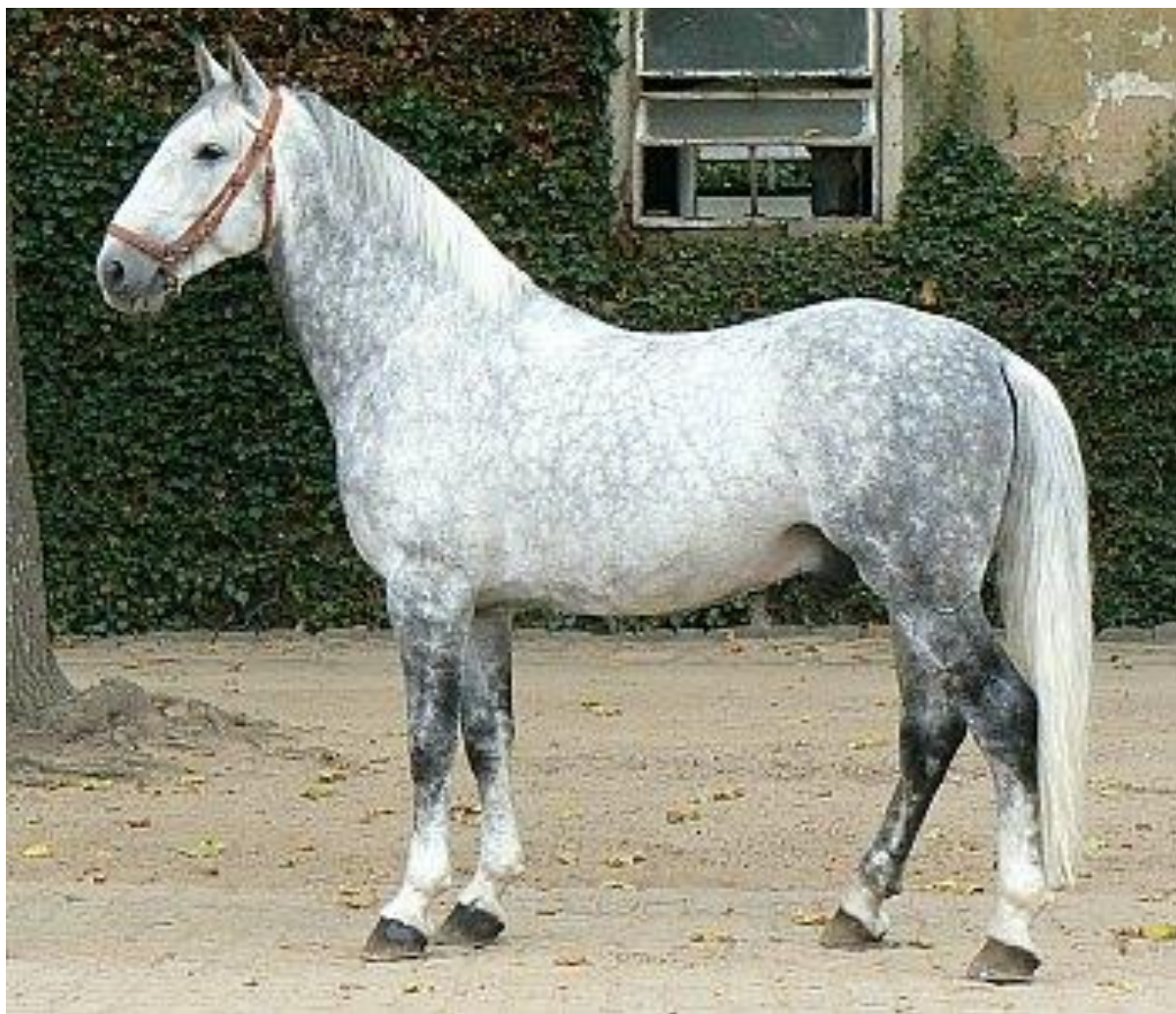
Obr. 2: Zástupce linie Generale 1428 GENERALE PASTORELLA VII