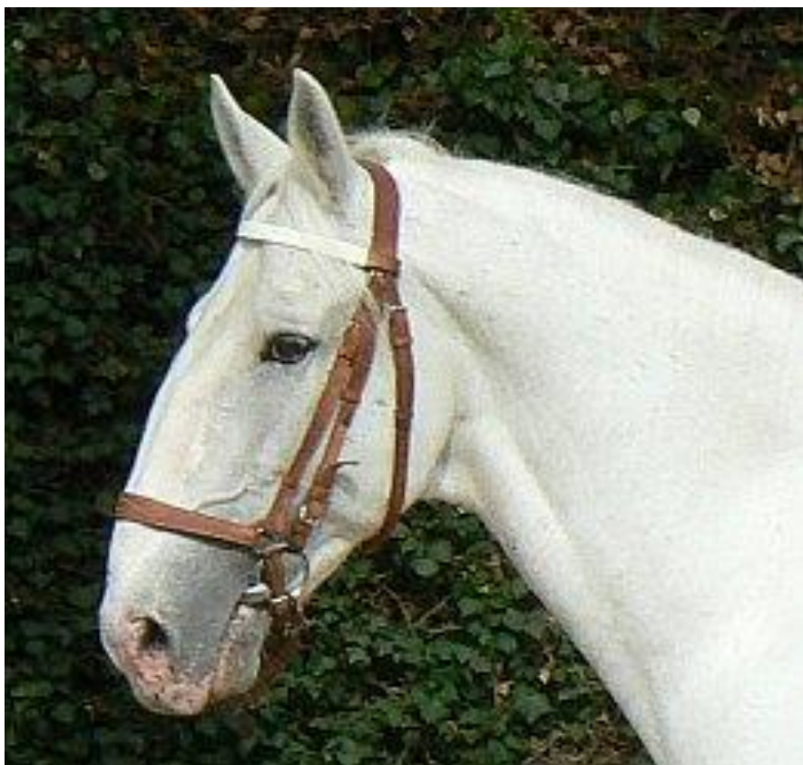
Obr. 3: Zástupce linie Generalissimus 944 GENERALISSIMUS ALTESSA XLII