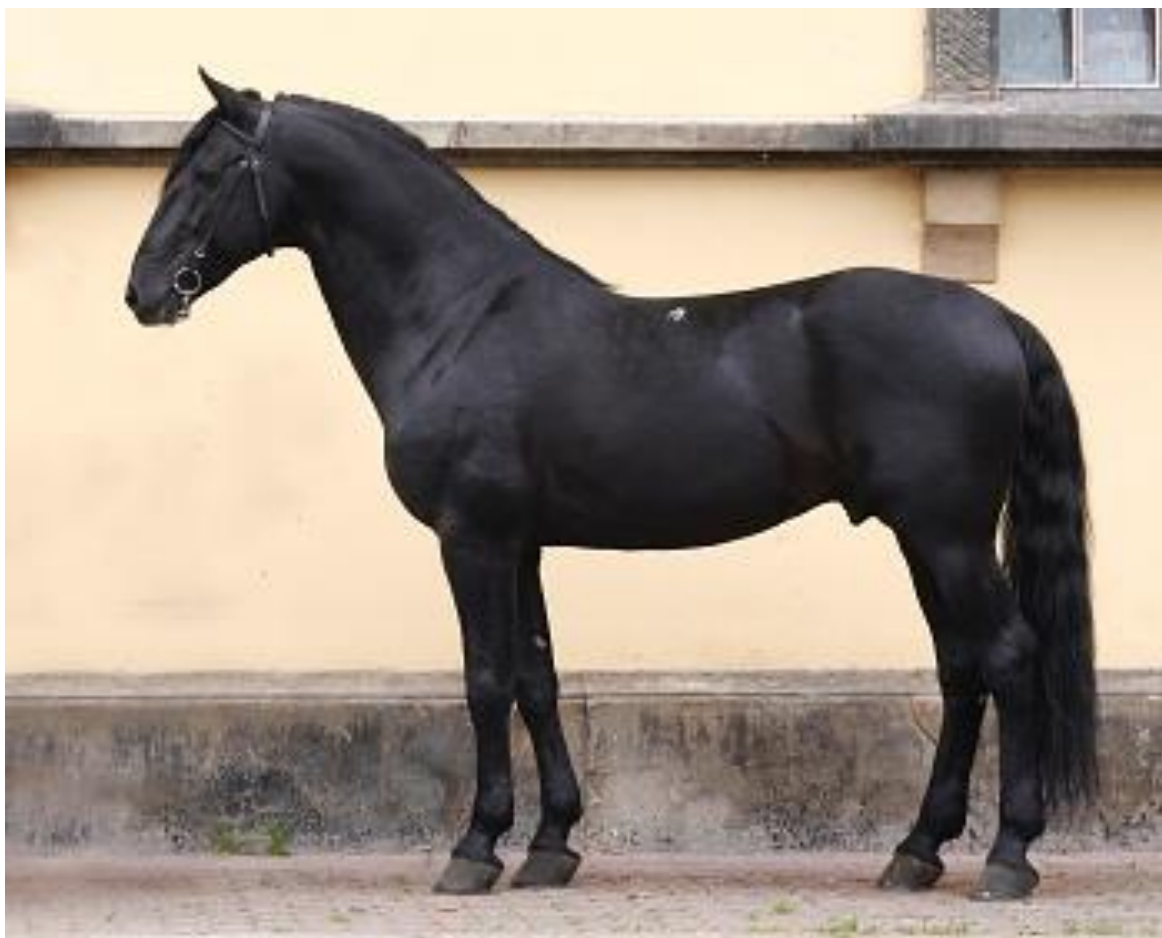
Obr. 8: Zástupce linie Romke 1217 ROMKE ELEJA X

(Dostupné z: http://pk.nhkladruby.cz/133254/.html , datum citace 23.2.2017).