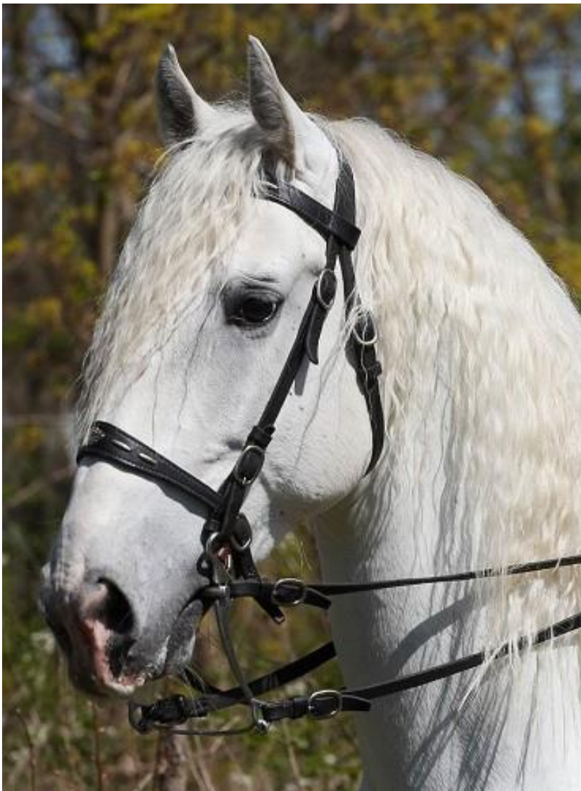
Obr. 9: Zástupce linie Favory 2757 FAVORY III CZ