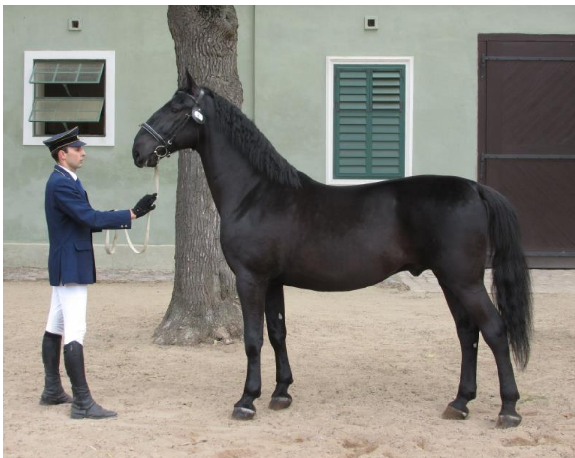
Obr. 6: Zástupce linie Sacramoso 2312 SACRAMOSO ROMY XVIII

(Dostupné z: http://www.hrebcinec-tlumacov.cz/kun/51 , datum citace 23.2.2017).