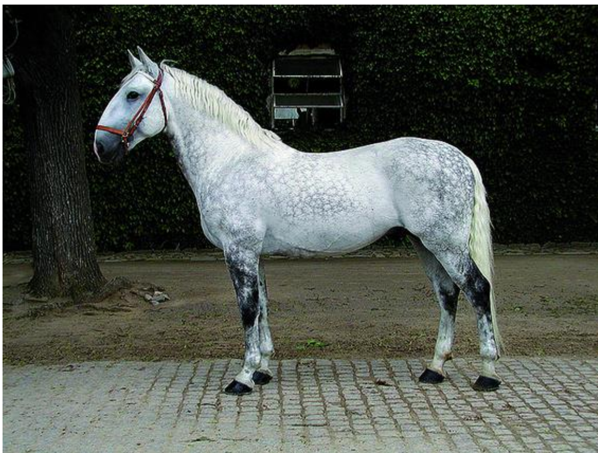
Obr. 5: Zástupce linie Rudolfo 1033 RUDOLFO CURIOSA V