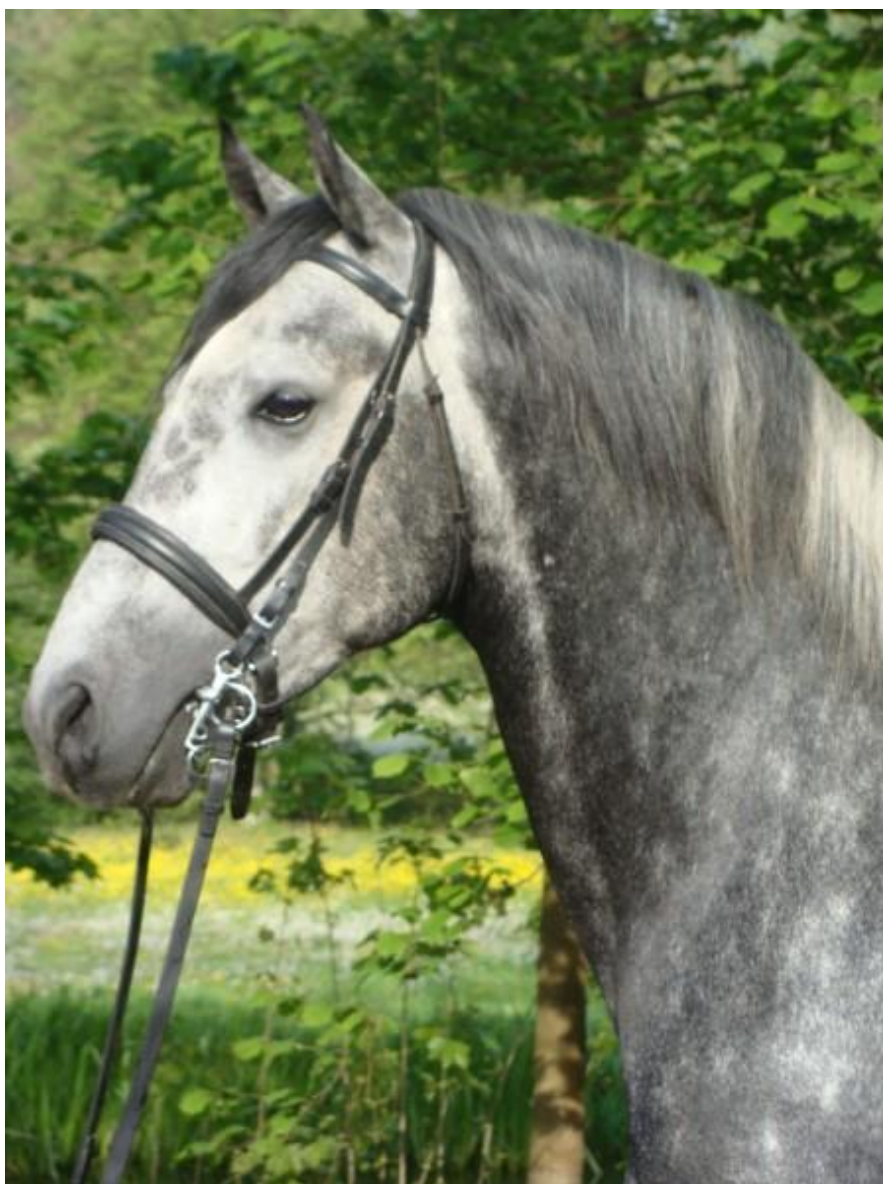
Obr. 10: Zástupce linie Pluto 1561 PLUTO IV CZ