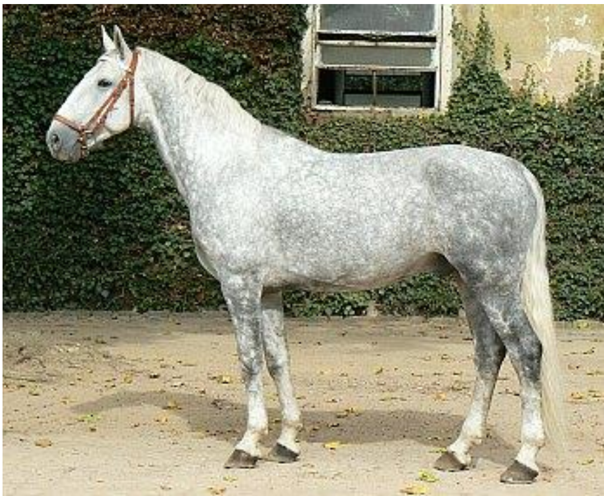
Obr. 4: Zástupce Zástupce linie Favory 1651 FAVORY ALBUZA XXVII