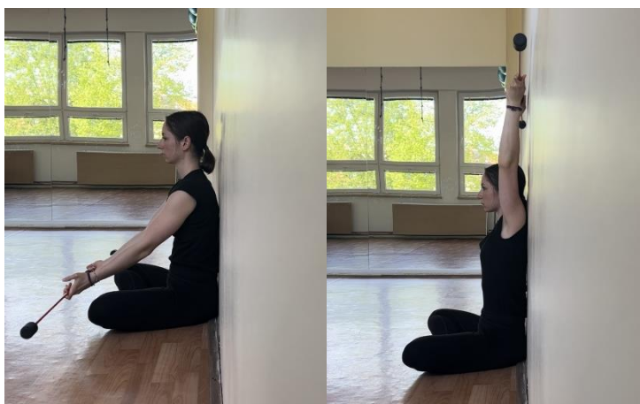
Rozsah pohybu ramenního kloubu

Nedostatečná flexibilita svalů podílejících se na tomto pohybu může způsobovat bolest ramen, jelikož je kloub při specifických gymnastických cvičeních (stoj na rukou, vis na hrazdě) vychýlen ze své osy a není zatížen rovnoměrně (SHIFT Movement Science and Gymnastics Education, 2014).