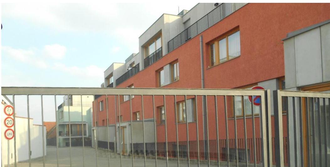
Obrázek č. 6, Villa park Jinonice (ZSJ- Jinonice- střed)