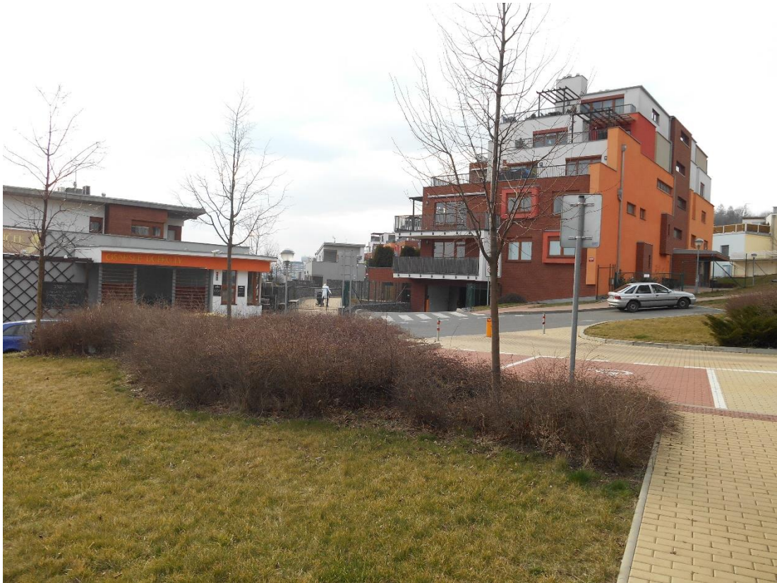
Obrázek č. 4, Rezidence Císařka (ZSJ- Skalka), Zdroj: autor