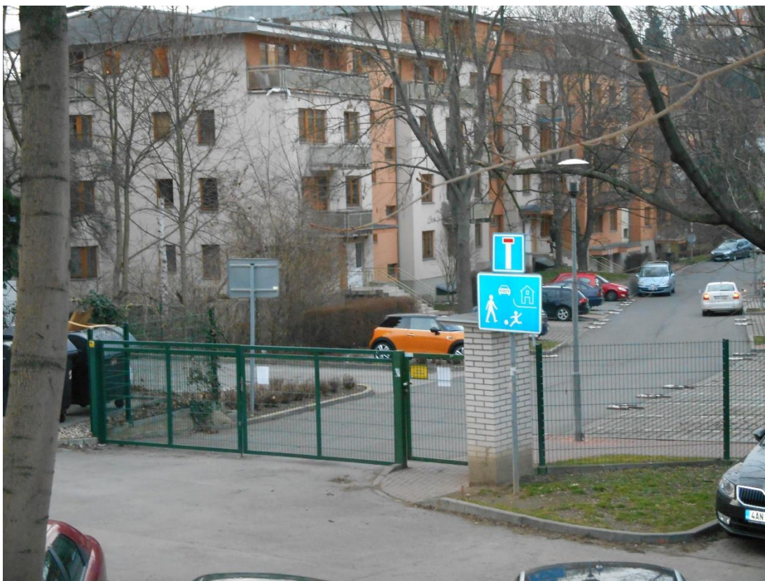
Obrázek č. 7, Kondominium Hamr (ZSJ- Záběhllice- západ)

Z analýzy je patrné, že citadely jsou vyhledávaným místem k bydlení pro bohatší vrstvu obyvatel. Poskytuje jim bezpečí a zpravidla i určitý životní standard. U nás jsou citadely navrženy buď pro vyšší třídu, vyšší střední třídu nebo střední třídu obyvatel.