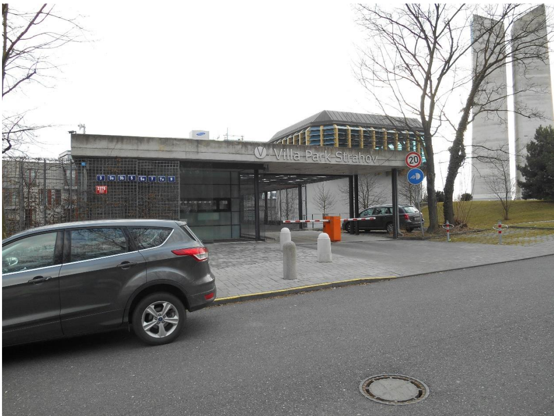
Obrázek č. 5, Villa park Strahov (ZSJ- Strahovské koleje)