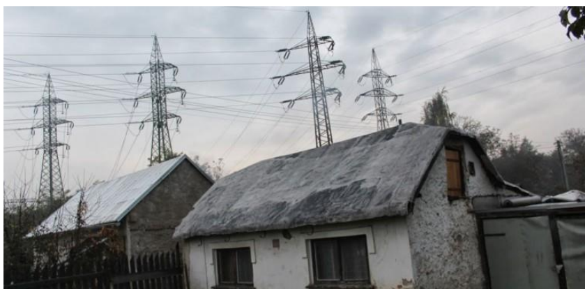
Obrázek č.2.- kolonie Na Slatinách, Zdroj: http://www.prahaneznamy.cz/praha-10/strasnice/kolonie-na-slatinach-a-obecna-skola/