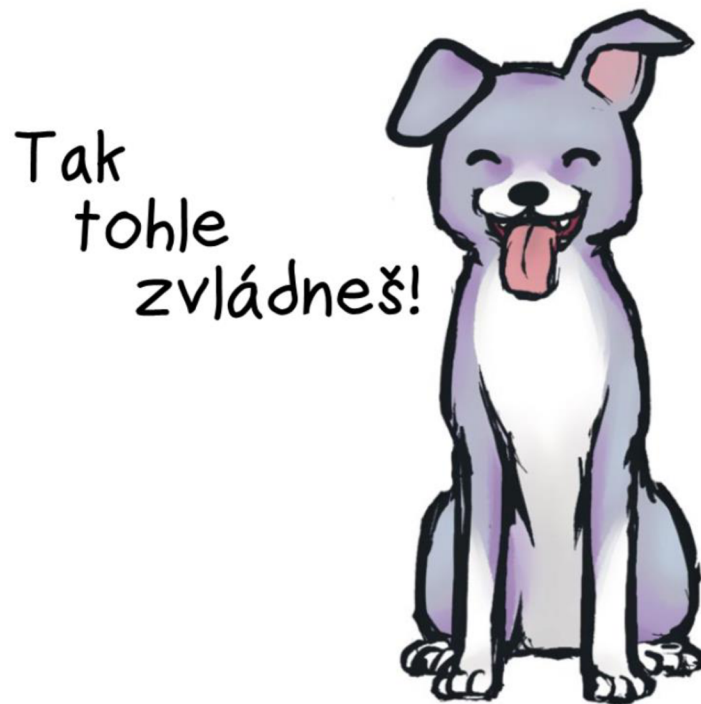
Obrázek č. 1 Tak tohle zvládneš! (Zdroj: ALLAN, 2019)

„Kýmkoli budeš, nic mě nezklame, nemám žádné představy o tom, jaký bys měl být či co bys měl dělat. Netoužím po žádných představách o tobě, chci tě pouze poznávat. Nikdy mě nemůžeš zklamat.“