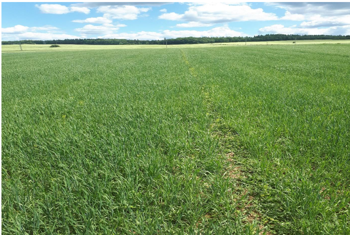
Obrázek III. porost během vegetace s roztečí řádků (125 mm).