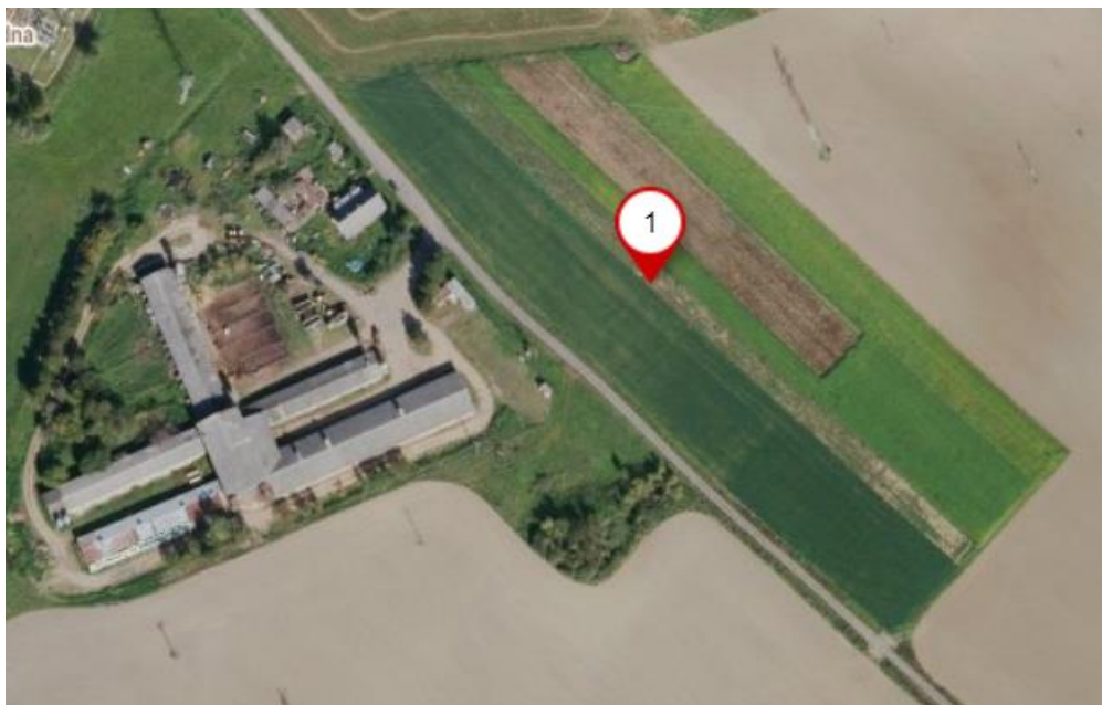
Obrázek 1: Mapa pokusného pozemku.

Pozemek, kde byl proveden polní pokus s jarním ječmenem se nachází v Plzeňském kraji okresu Rokycany v místě Zbiroh. Lokalita pozemku je vyznačena na obrázku 1.