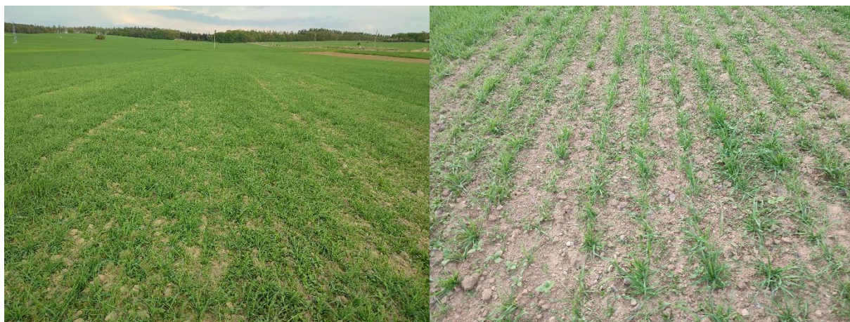
Obrázek 3: Stav porostů jarního ječmene stanovený 8.5.2022, vlevo je porost s roztečí řádků 125 mm a vpravo s roztečí 250 mm.

Reálná sklizeň provedená na základě hodnocení výnosu zrna z průjezdu sklízecí mlátičkou prokázala dosažení vyššího výnosu opět na variantě s roztečí řádků 250 mm ve srovnání s plochou s řádky 125 mm. Na ploše se širšími řádky byl výnos zrna u reálného výnosu o 0,159 t/ha vyšší (tab. 4).