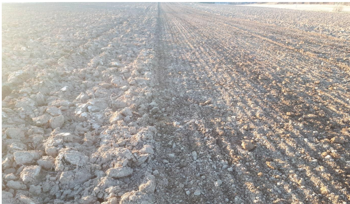
Obrázek I. Zakládání pokusných porostů.