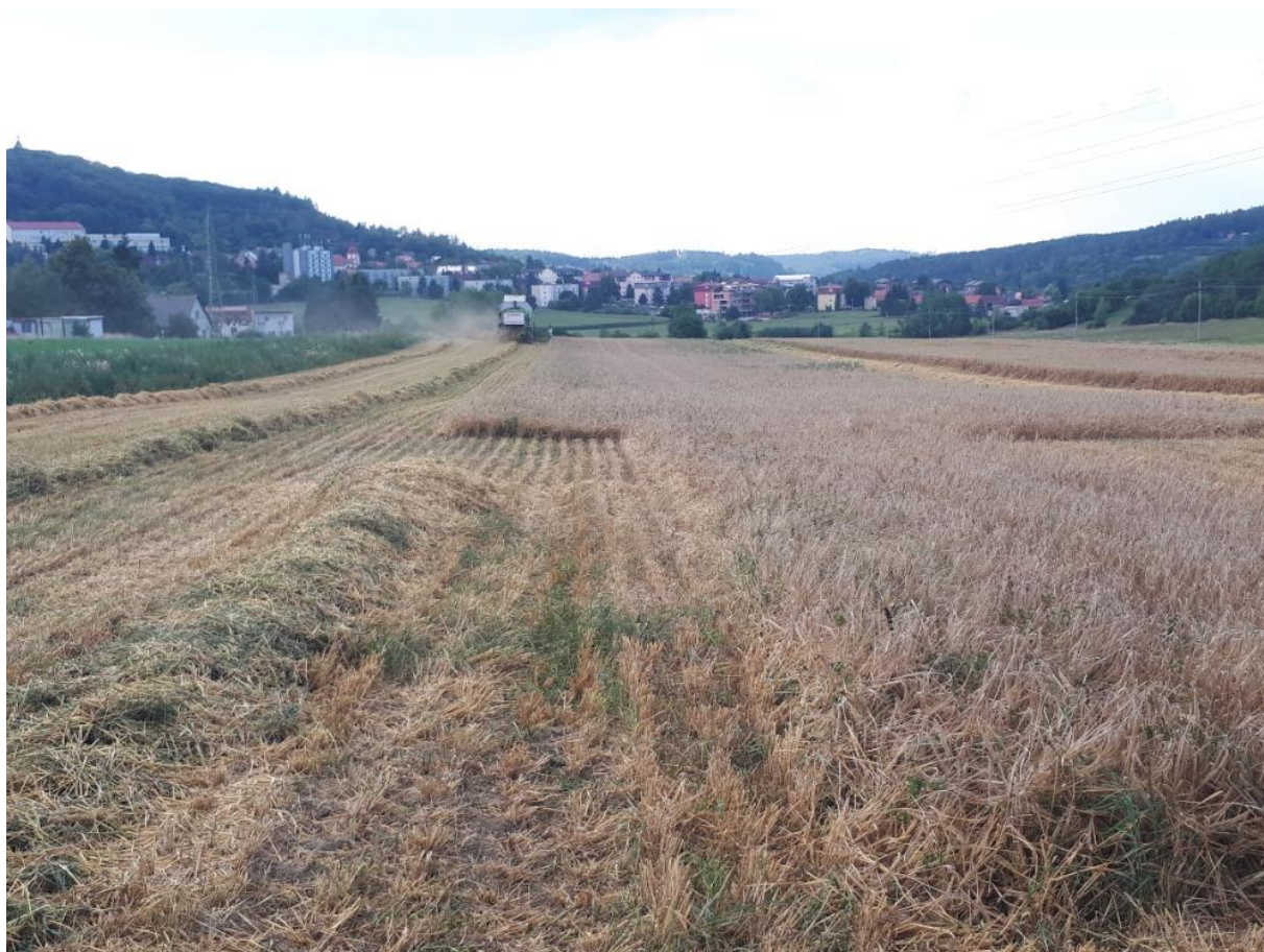
Obrázek V. průseky pokusných ploch sklízecí mlátičkou Claas mega 208.