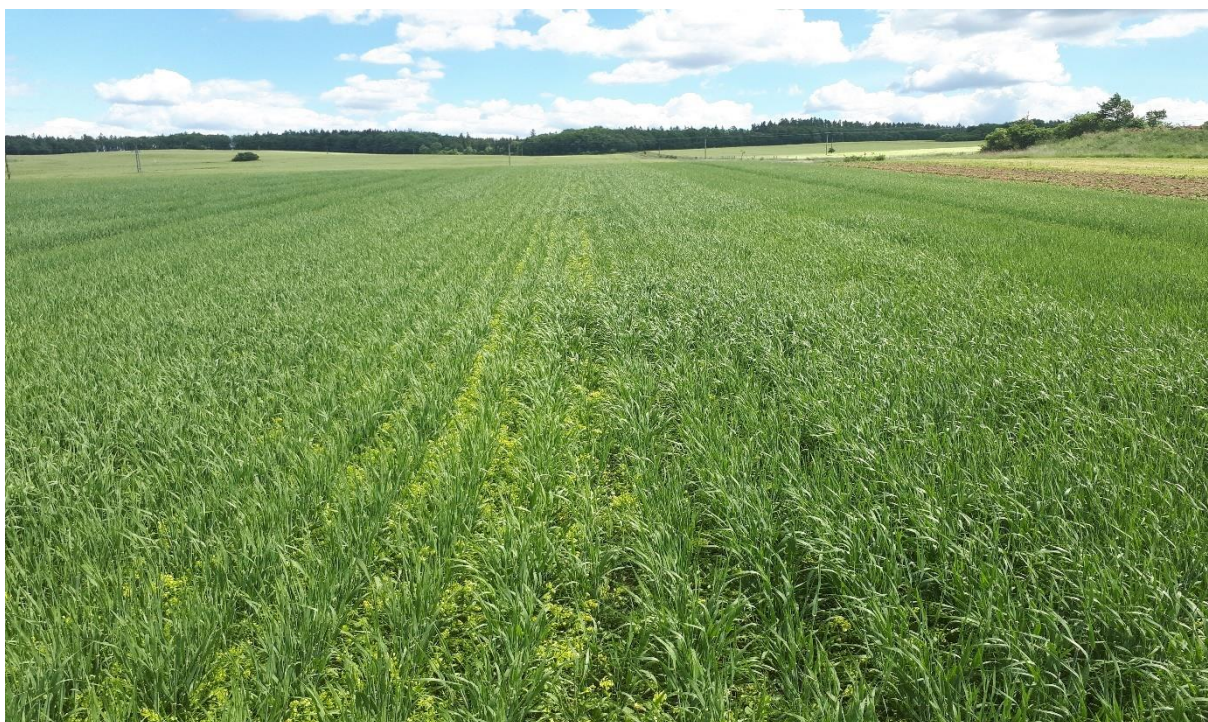
Obrázek IV. porost během vegetace s roztečí řádků (250 mm).