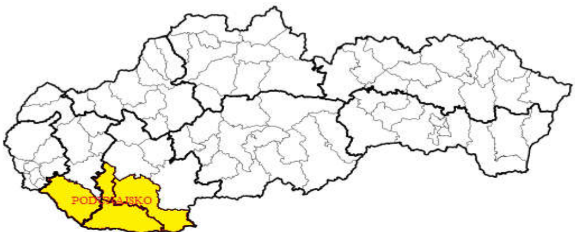
Obrázok číslo2: Mapa so zaznačenou oblasťou Podunajského regiónu

Podunajský región alebo skrátene región Podunajsko leží v juhovýchodnej časti západného Slovenska. V tomto bode tvorí južnú hranicu najväčšia rieka na Slovensku Dunaj, čo je vlastne hranica s Maďarskom. Podunajský región tvoria štyri okresy a tými sú okres Dunajská streda, okres Komárno, okres Nové zámky a okres Šaľa. Podunajský región je vďaka svojej polohe a prírodným podmienkam oddávna veľmi prítiažlivým a vyhľadávaným miestom. Archeologické nálezy potvrdzujú, že táto časť Slovenska bola osídlená už v dobe železnej. Na tomto území Slovenska môžeme nájsť aj viaceré zachované sakrálne stavby v románskom a gotickom štýle. Cez tento región prechádza medzinárodná Dunajská cyklotrasa v európe. Významnými vodnými zdrojmi a riekami sú rieky Dunaj, Váh, Hron, Nitra, Žitava ale aj Parížsky potok, v ktorého okolí sa nachádzajú Parížske močiare, ktoré svojím významom presahujú národný význam a ich ochrana je žiaduca v celoeurópskom rozsahu. V Štúrove sa nachádza termálne kúpalisko s medzinárodnou klientelou. Za zmienku stojí aj nádvorie Európy v Komárne či hviezdareň v Hurbanove. Z prírodných krás sú veľmi obľúbené a navštevované Kováčovské kopce. Významné mestá v Podunajskom regióne sú mesto Komárno, Dunajská streda, Hurbanovo a Štúrovo.