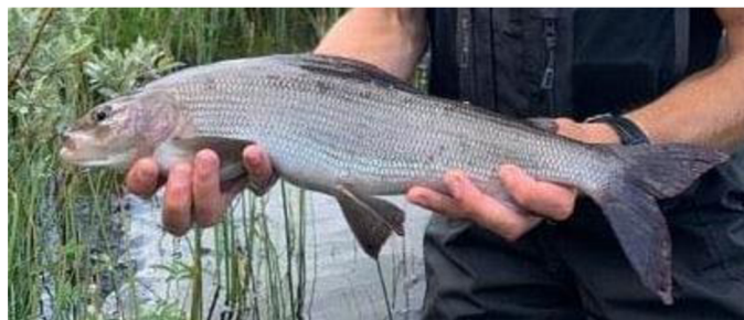
Popis: Exemplář dospělého jedince lipana ze švédského jezera.