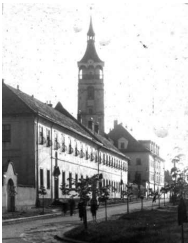
Obrázek ř. 2: Piaristický klášter (1920–1930)