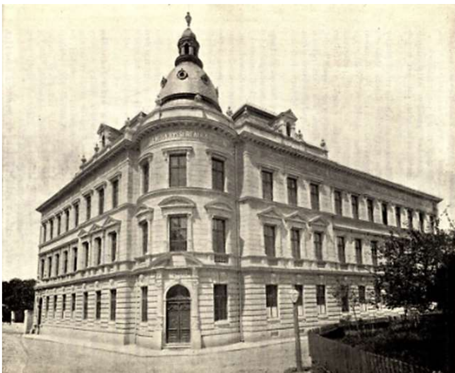
Obrázek č. 5: Budova české reálky In: Desátá výroční zpráva české zemské vyšší reálky v Lipníku za školní rok 1904–1905 . Lipník 1905, s. 23.