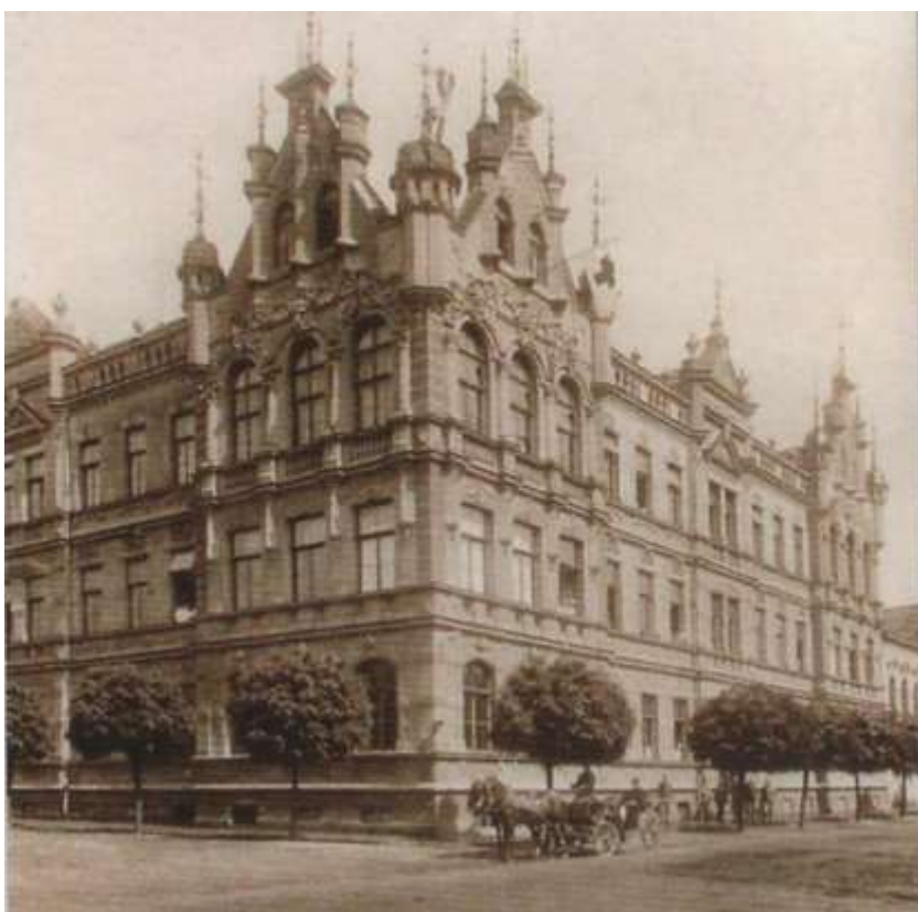
Obrázek č. 4: Budova německé reálky