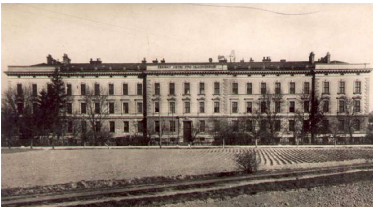
Obrázek č. 6: Zemský ústav pro hluchoněmé děti (1925)