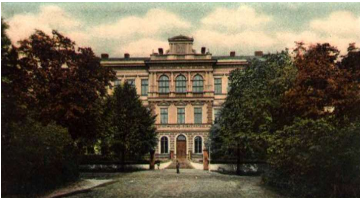
Obrázek č. 3: Budova školy – Rudolfův park (1913) In: SOkA Přerov, fond Sbirka obrazového a fotografického materiálu Státního okresního archivu Přerov, inv. č. P679.