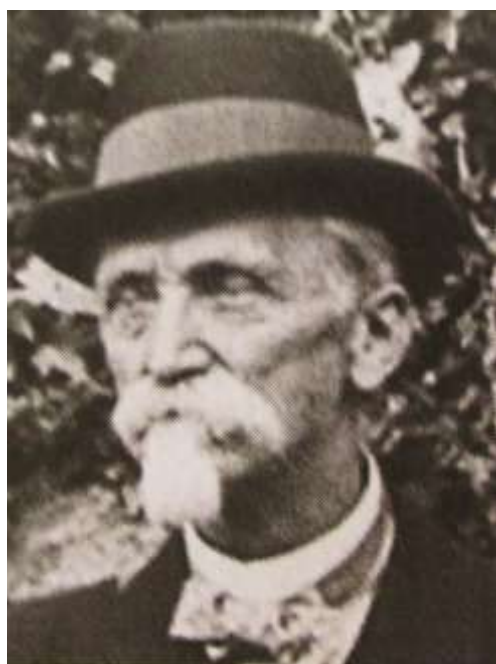
Obrázek č. 8: Johann Kaser In: MALÍŘ, Jiří: Biografický slovník poslanců moravského zemského sněmu v letech 1861–1918 . Brno 2012, s. 330.