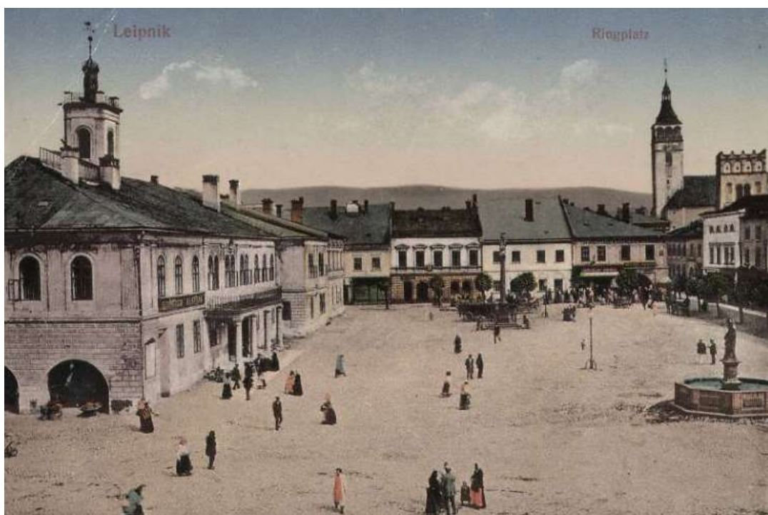
Obrázek č. 1: Náměstí (1916)