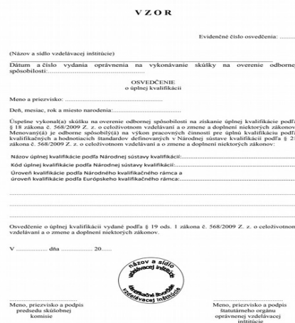
Obrázok 3: Osvedčenie o úplnej kvalifikácii