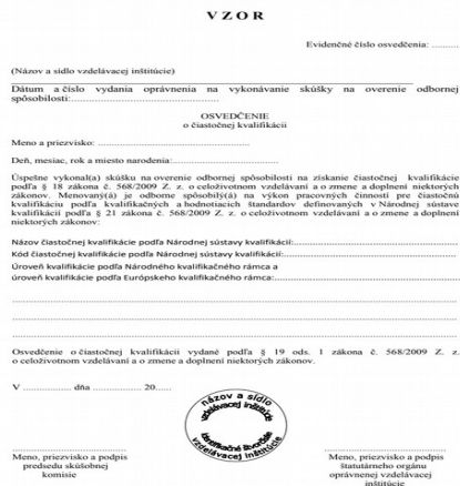
Obrázok 2: Osvedčenie o čiastočnej kvalifikácii