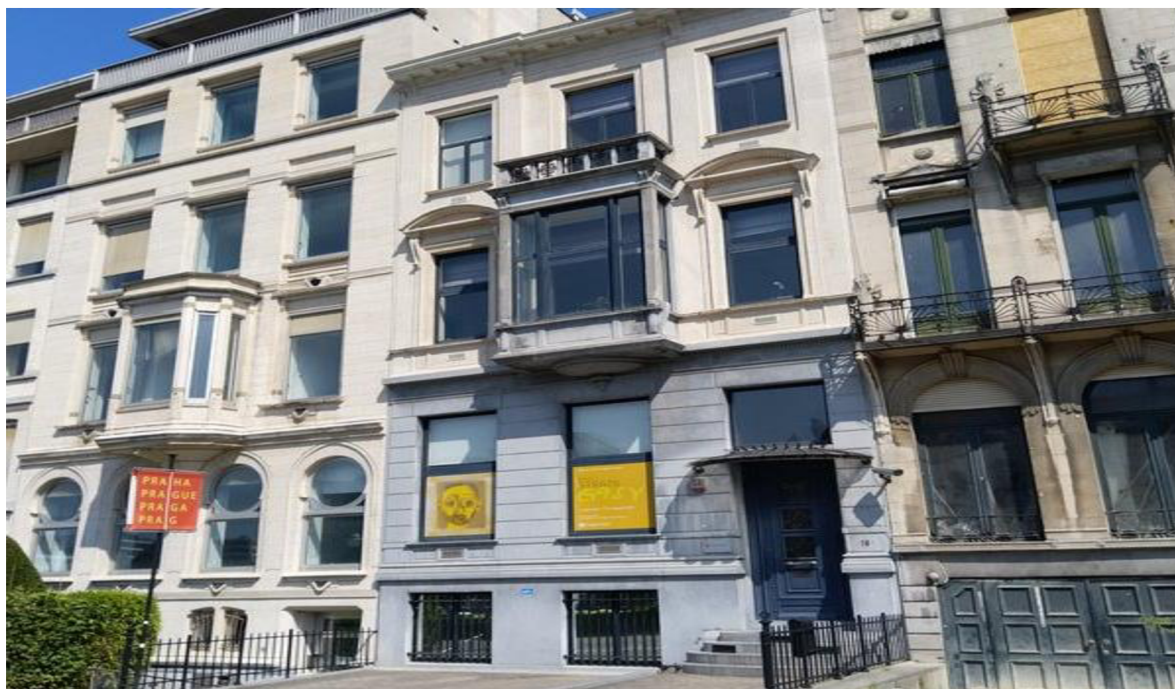
Obrázek 3 Pražský dům v Bruselu

Česká národní delegace se při této příležitosti zpravidla schází v Pražském domě v Bruselu, kde se připravuje na nadcházející shromáždění a formulují se společné postoje. Projednávají se organizační záležitosti, důležité body zasedání a probíhá debata o případných pozměňovacích návrzích. Vzhledem k nedostatku času musí být vše pečlivě připraveno dopředu, na samotnou diskuzi národních delegací je v programu zasedání vyhrazena zpravidla pouze hodina až hodina a půl. Právě vzhledem k nedostatku času dochází i k výjimkám, kdy setkání členů národní delegace neprobíhá v Pražském domě, ale proběhne pouze on-line, telefonicky nebo prostředním mailové komunikace.