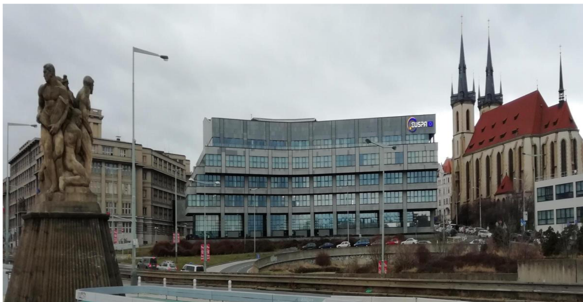
Obrázek 4 Sídlo EUSPA v Praze