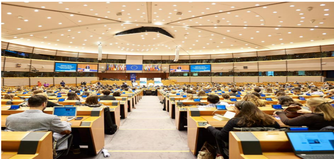
Obrázek 2 Shromáždění členů Výboru regionů při plenárním zasedání