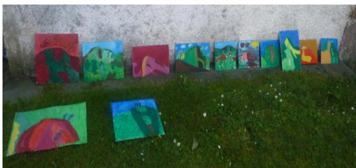
Výstava krajinomalby – Javor