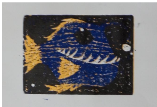
Výsledná práce – modrá varianta