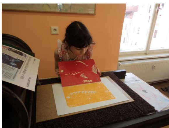
Druhá barva - soutisk