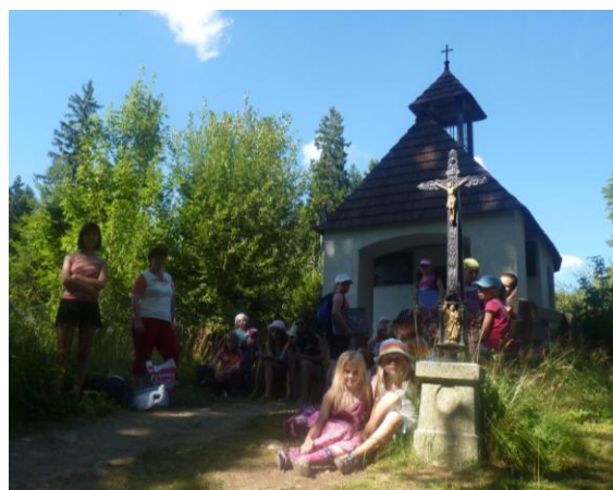
Malířský kurz v Železné Rudě