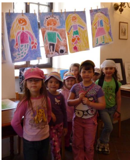
Šrákal a Meluzína - Stříbrská lampa – výstava na radnici