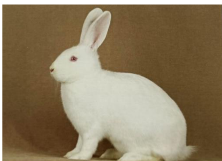
Obrázek č. 9: Český albín (Šimek et al. 2020)