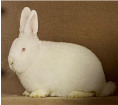
Obrázek č.1: Novozélandský bílý (Šimek et al. 2020)