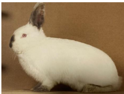
Obrázek č. 7: Nitranský králík (Šimek et al. 2020)