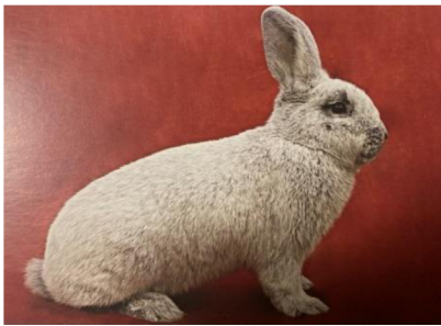
Obrázek č. 10: Velký světlý stříbřitý (Šimek et al. 2020)