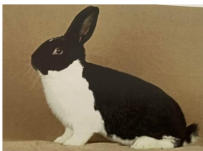
Obrázek č. 5: Meklenburský strakáč (Šimek et al. 2020)