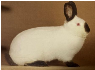
Obrázek č.2: Kalifornský králík (Šimek et al. 2020)