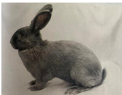
Obrázek č. 8: Moravský modrý (Zadina et al. 2012)