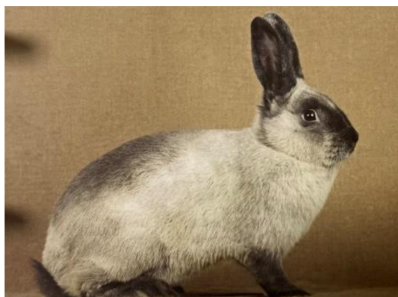
Obrázek č. 6: Kuní velký (Šimek et al. 2020)