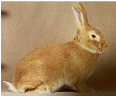
Obrázek č. 3: Burgundský králík (Šimek et al. 2020)