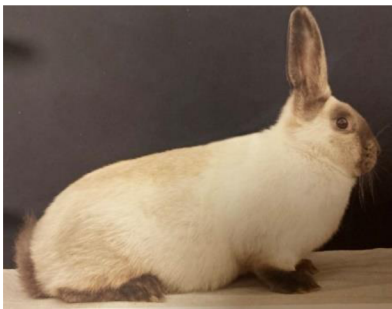
Obrázek č. 4: Siamský velký (Šimek et al. 2020)