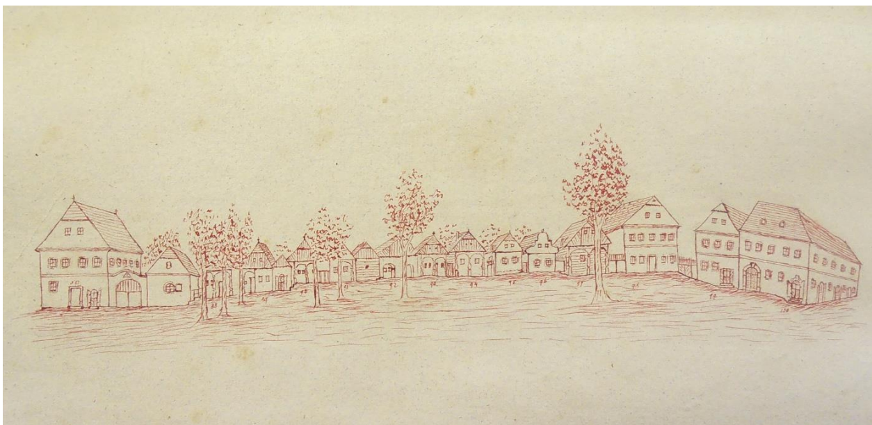
Jižní strana náměstí se Sousedským domem (třetí zprava) 103