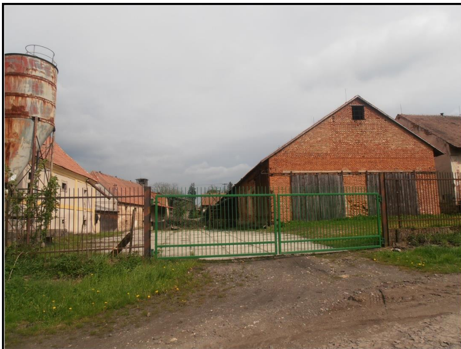
Areál zemědělského družstva – přibližné místo počátku požáru