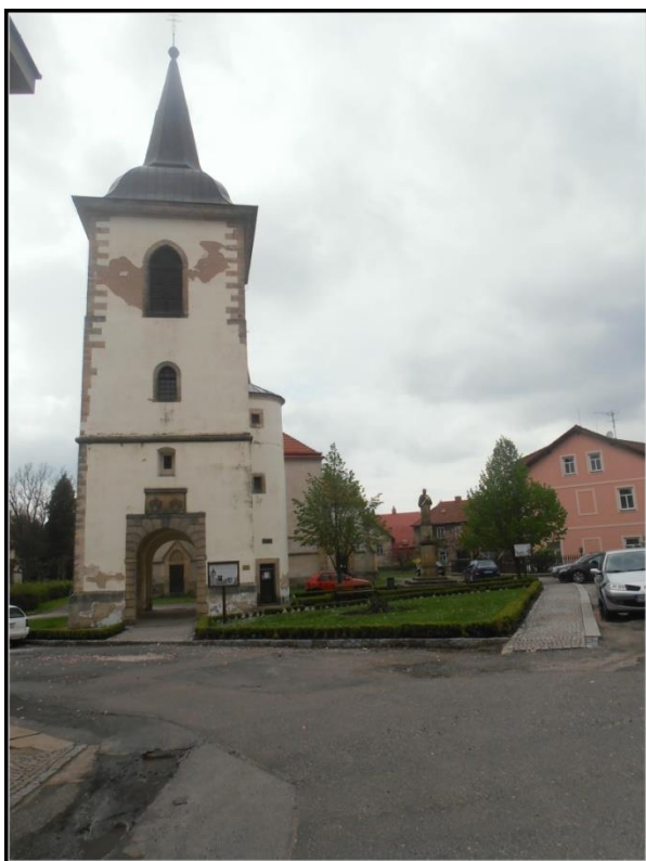
Zvonice se sochou sv. Jana Nepomuckého v místě zaniklé školní budovy