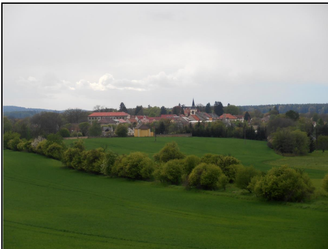
Pohled na Miletín od východu