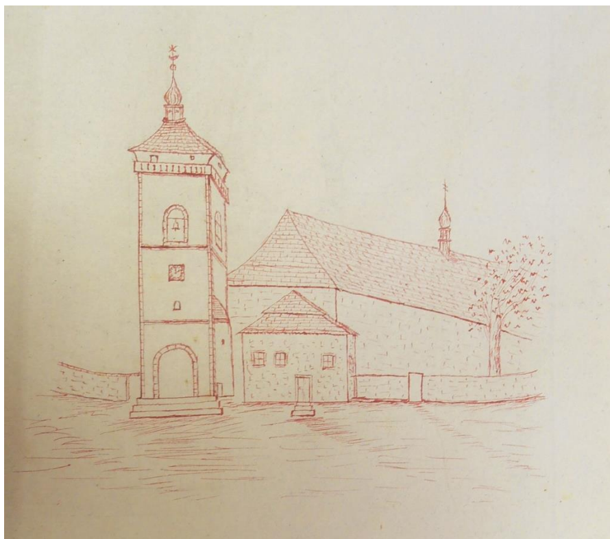
Podoba zvonice a školy před požárem 97