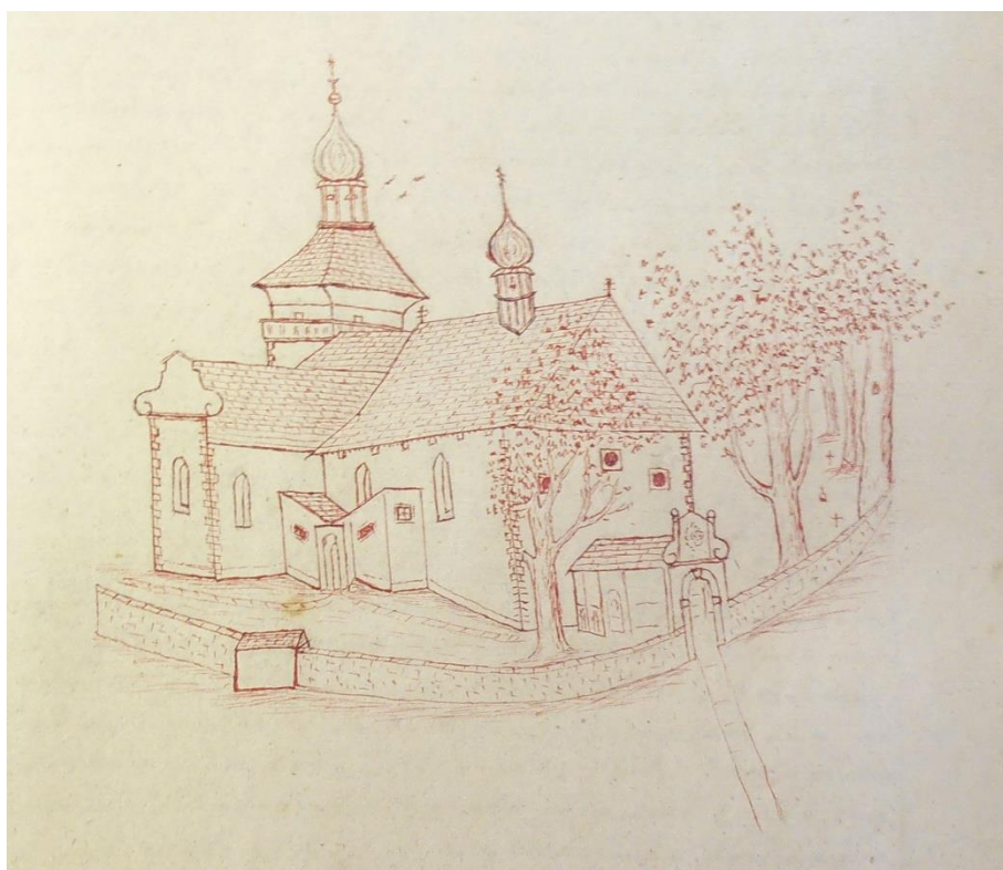
Miletiňský kostel před požárem 85

Hřbitovní prostor ozdobovaly staré lípy, které tu stávaly až do samotného požáru, kdy zcela vyhořely. U kostela se pohřbívalo až do roku 1822. Z důvodu nedostatku místa a zdravotních důvodů se hřbitov přesunul do jiných míst, na místo zvané „U roklí“. 83 Od té doby hřbitovní zeď ztrácela svůj účel a pomalu se rozpadávala. 84