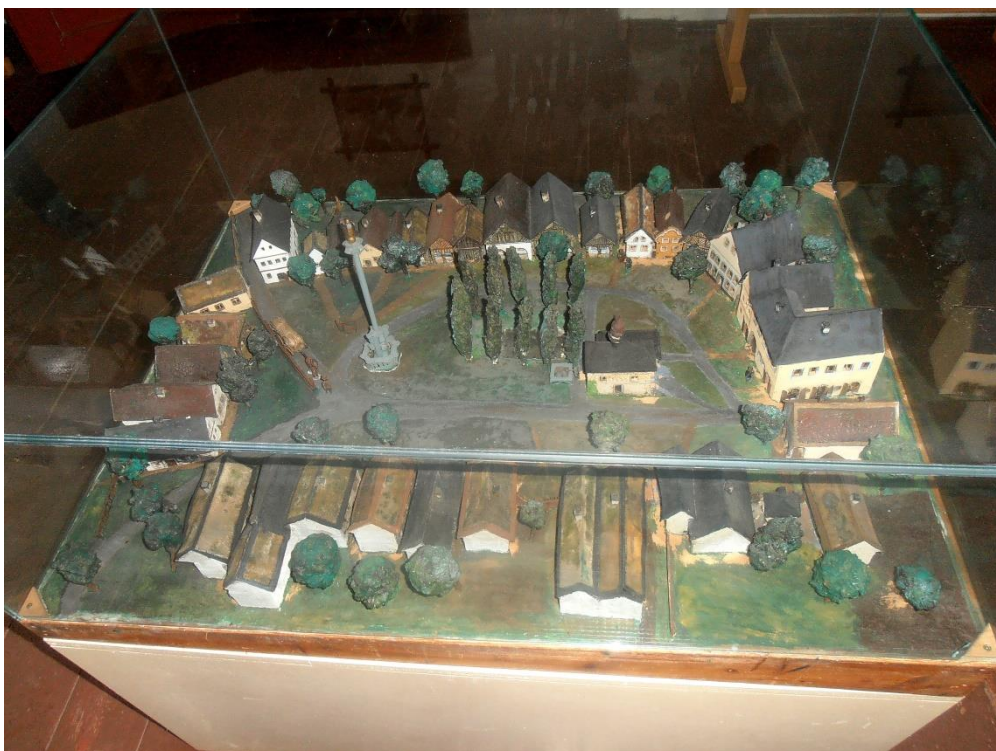
Model náměstí před požárem od Františka Birnera z roku 1946