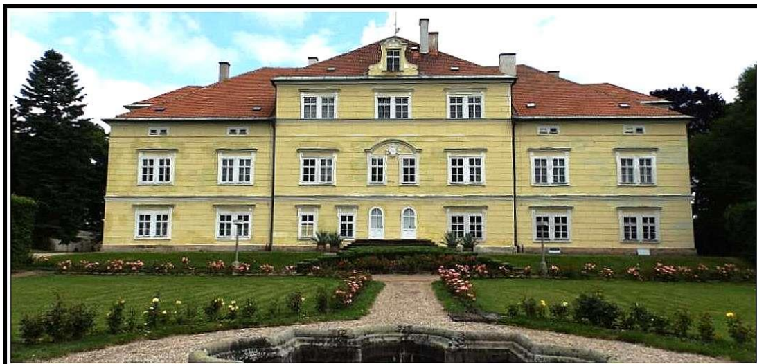
Zámek v Miletíně 230