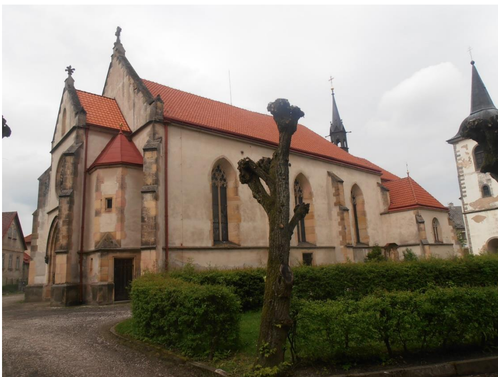
Kostel Zvěstování Panny Marie v současné podobě