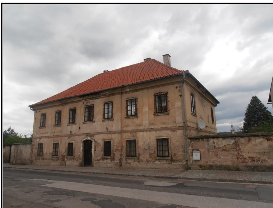
Současná podoba farní budovy