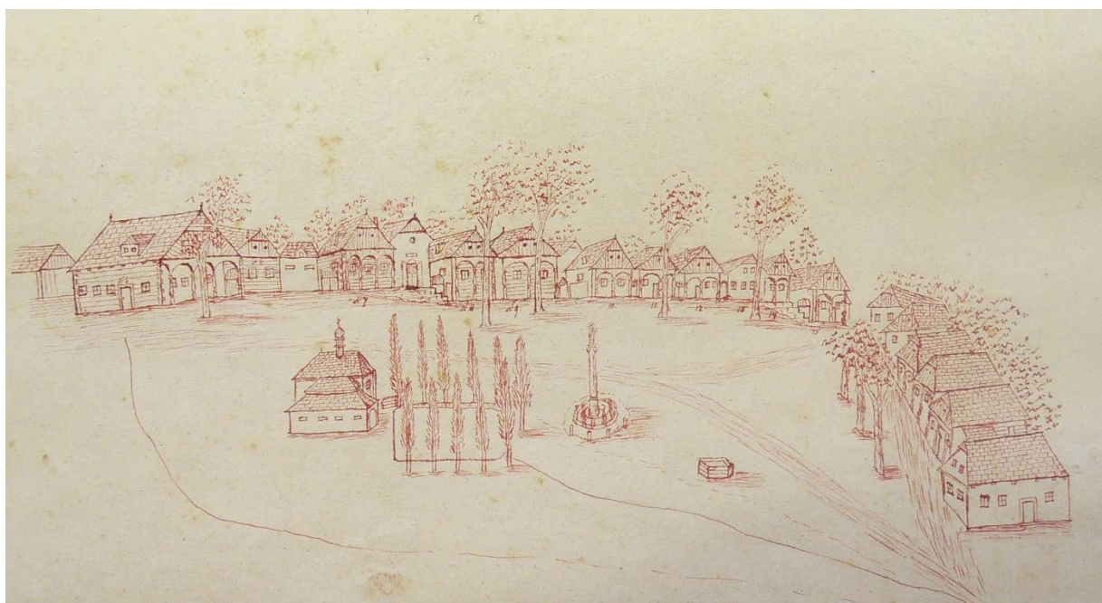
Severní část náměstí se starou radnicí, masnými krámy a rybníčkem uprostřed 70