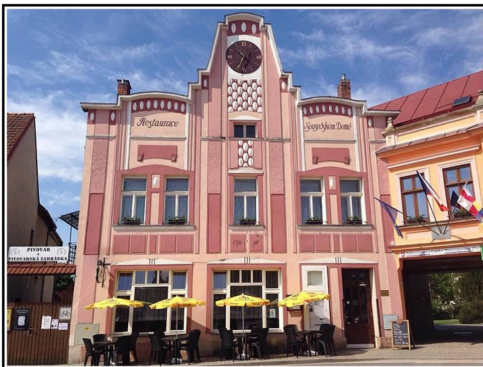
Sousedský dům s hodinami 231