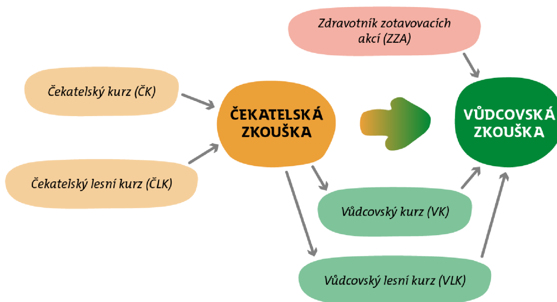
Obr. 3. Typické vzdělávací dráhy ( Typické vzdělávací dráhy [online], 2022)

Spousta skautských středisek svým členům na kurzy přispívá nebo je dokonce platí celé. Snaží se tak své členy motivovat k seberozvoji a vzdělávání. V dnešní době se již můžeme setkat s velmi pestrá nabídkou skautských kurzů. Jednotlivé kurzy se také mohou lišit svojí délkou, avšak musí dosáhnout daného minimálního počtu hodin. Nejtypičtější formou kurzů bývají dva víkendy během jara a na ně navazující letní běh, který může trvat i dva týdny. Dále pak mohou být kurzy jen víkendové nebo i zimní. ( Jak si vybrat vzdělávací akci [online], 2022)