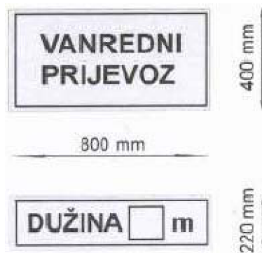
Obrázek č. 16 – Označení vozidel[56]

Materiál tabulí musí být vyroben podle standardu, který se používá u dopravních značek. Barva rámečků a textu je černá, pozadí tabule je vyplněno žlutou barvou.