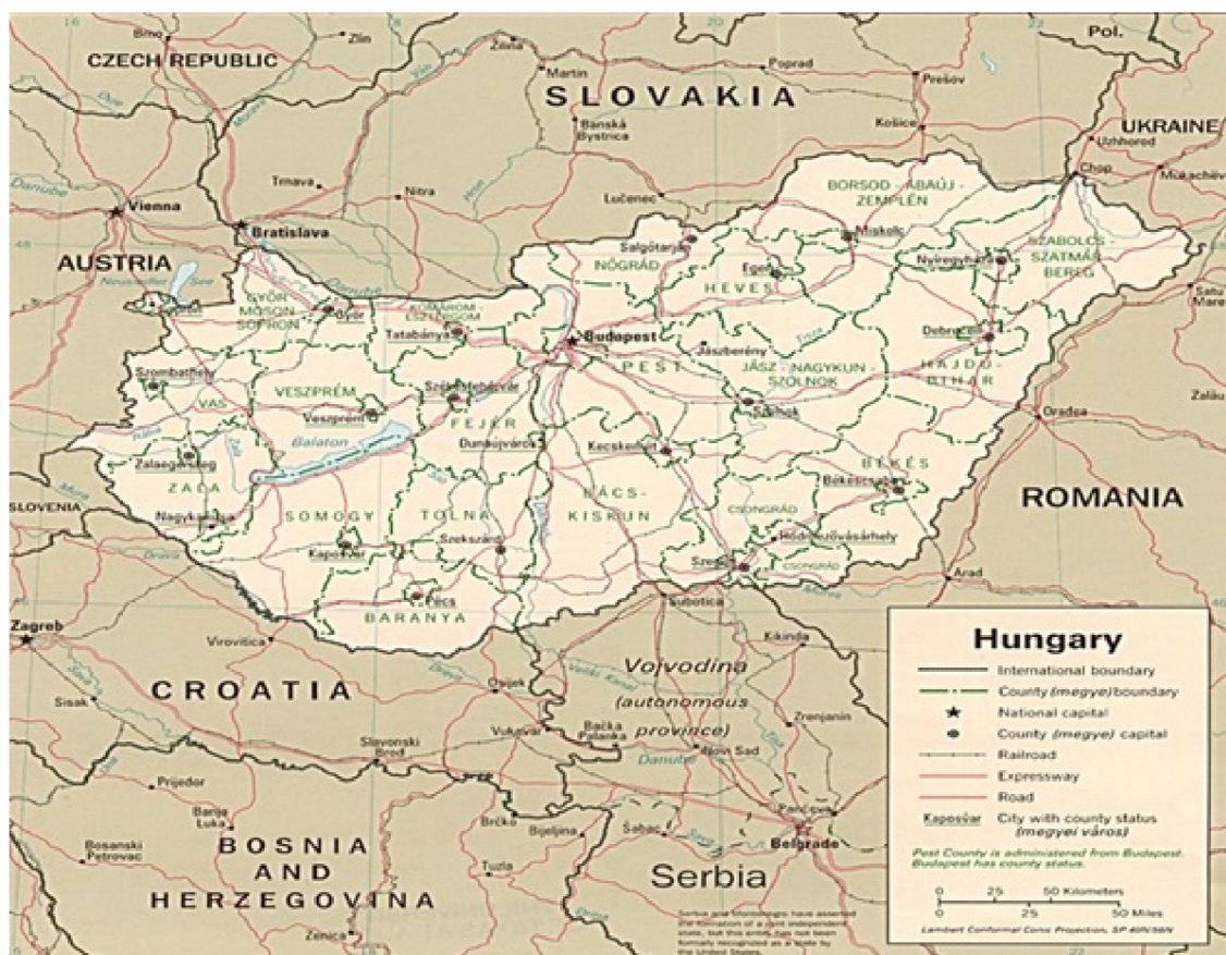
Obrázek č. 2 - Mapa Maďarské republiky[4]

Jedná se poměrně o rovinatou zem, pouze ze severu je ohraničeno menším pohořím, které je součástí Karpat. Na jihu se nachází Velká uherská nížina, která svou rozlohou zasahuje až do Rumunska a Srbska.