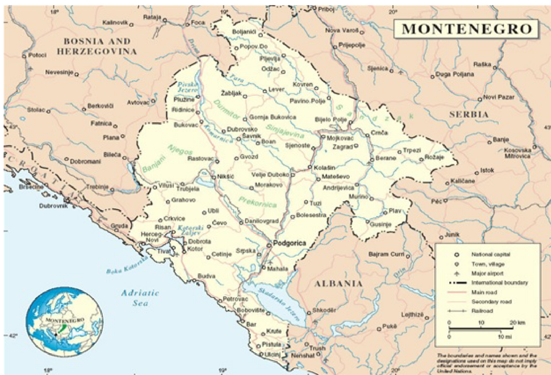
Obrázek č. 9 – Mapa republiky Černá Hora[2]