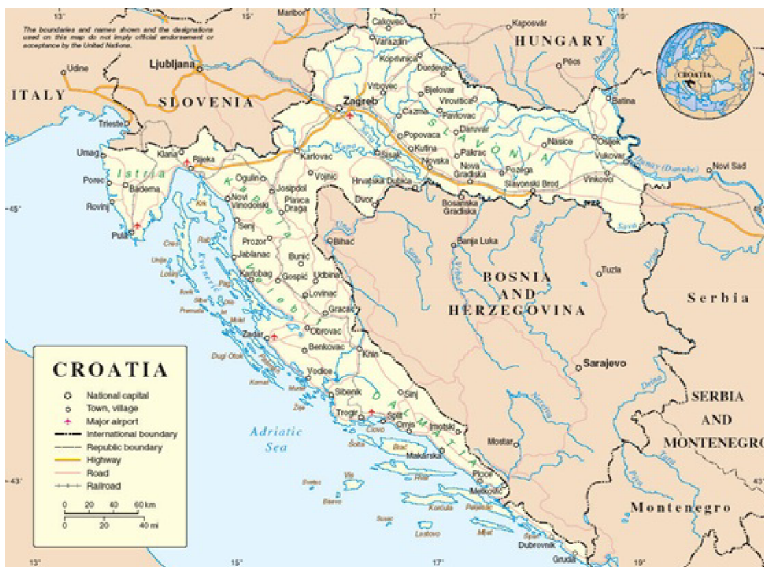
Obrázek č. 6 – Mapa Chorvatské republiky[2]

Chorvatská republika je umístěna na východním pobřeží Jaderského moře. Ze severu zasahuje do vnitrozemí, od počátku Alp do Panonské nížiny, břehů Dunaje a Drávy. Sousedící státy jsou ze severu Slovinsko, na severu a severovýchodně sousedí s Maďarskem, na východě se Srbskem, na jihu s Černou Horou a jižním a jihovýchodním směrem s Bosnou a Hercegovinou. Hlavním městem Chorvatské republiky je Záhřeb. Současná měna je Kuna (HRK), která byla uvedena v platnost 30. května 1994. Chorvatská republika není členem Evropské unie, plánovaný vstup se odložil na rok 2012.[6]