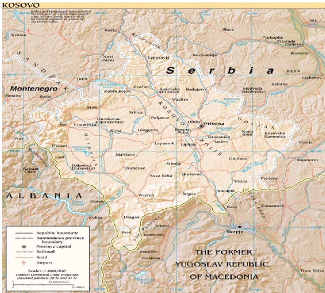
Obrázek č. 10 – Mapa republiky Kosovo[19]