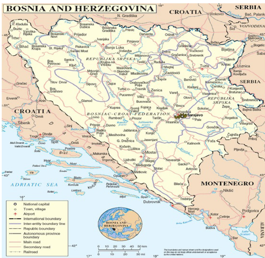
Obrázek č. 7 – Mapa republiky Bosna a Hercegovina[2]

Z geografického hlediska je Bosna a Hercegovina velmi hornatá, hory zabírají rozlohu okolo 9 000 km 2 .