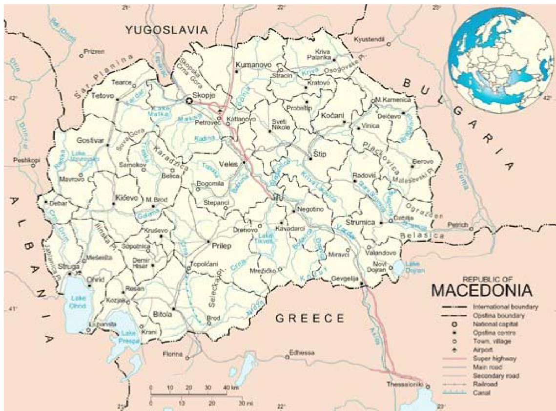
Obrázek č. 11 – Mapa republiky Makedonie[21]

172 km, vede od hranic se Srbskem k řeckým hranicím. Koridor 8 je plánován na trase z Albánie do Bulharska ve směru Bari, Brindisi – Durres, Vlora – Tirana – Rrogozhine – Elbasan – Qafe – Thane – Skopje – Sofie – Plovdiv – Burgas, Varna. Rozvoj dopravní infrastruktury v Makedonii dosáhl kladných výsledků v minulosti, ale stále na tom není tak, aby splňovaly požadavky moderní společnosti.[20]