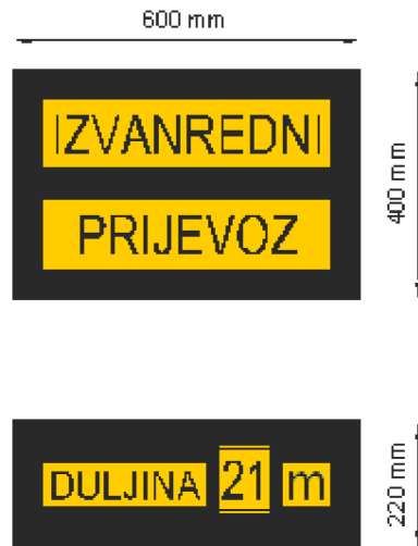
Obrázek č. 15 – Označení mimořádné přepravy[51]

Při překročení maximální přípustné délky vozidla nebo jízdní soupravy, musí být také označení, na kterém je uvedena skutečná délka vozidla nebo jízdní soupravy s nákladem „Duljina... m“. Tato dodatečná značka má mít rozměr 220 x 600 mm. Rámec, ve kterém jsou umístěny čísla délky vozidla, musí mít výšku 120 mm a musí být umístěny v rámečku o rozměru 170 x 170 mm.[51]