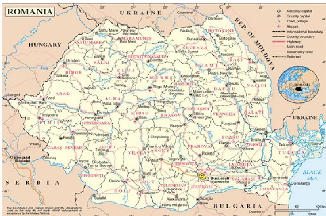
Obrázek č. 3 – Mapa Rumunské republiky[2]

Infrastruktura v Rumunsku stále zaostává za Evropským standardem. Dálniční síť má zhruba 321 km, celková délka silnic činí 81 713 km. Rumunsko usiluje, aby se tahle situace silničních a dálničních sítí zlepšila. V současné době probíhá několik projektů zaměřených jak na dokončení dálnic, tak i silnic. Také probíhají četné rekonstrukce pro zvýšení kvalit komunikací. Jeden z prioritních bodů je dokončení dálnice Bukurešť – Constanta. V železniční dopravě Rumunsko také pokulhává. Celková délka železničních tratí činí 11 077 km, z nichž pouze 35% je elektrifikovaných. V námořní dopravě se využívá Dunajsko – černomořský kanál, který o 400 km zkracuje námořní trasu z Bosporu a Středního východu. Zrychluje přístup západoevropským zemím a Severního moře s kapacitou nad 1500 tun.[6, 7]