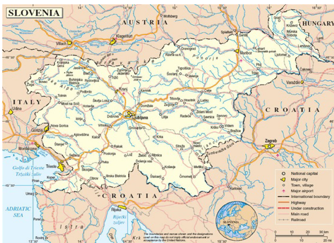
Obrázek č. 5 – Mapa Slovinské republiky[2]

Z jihovýchodu Slovinsko obklopuje Jaderské moře. Jižně od řeky Sávy geograficky spadá na Balkánský poloostrov. Umístění Slovinska patří do prostředí Alp, Dinárského pohoří, Panonské nížiny a Středozemního moře. Více než polovinu země pokrývají lesy.[1]