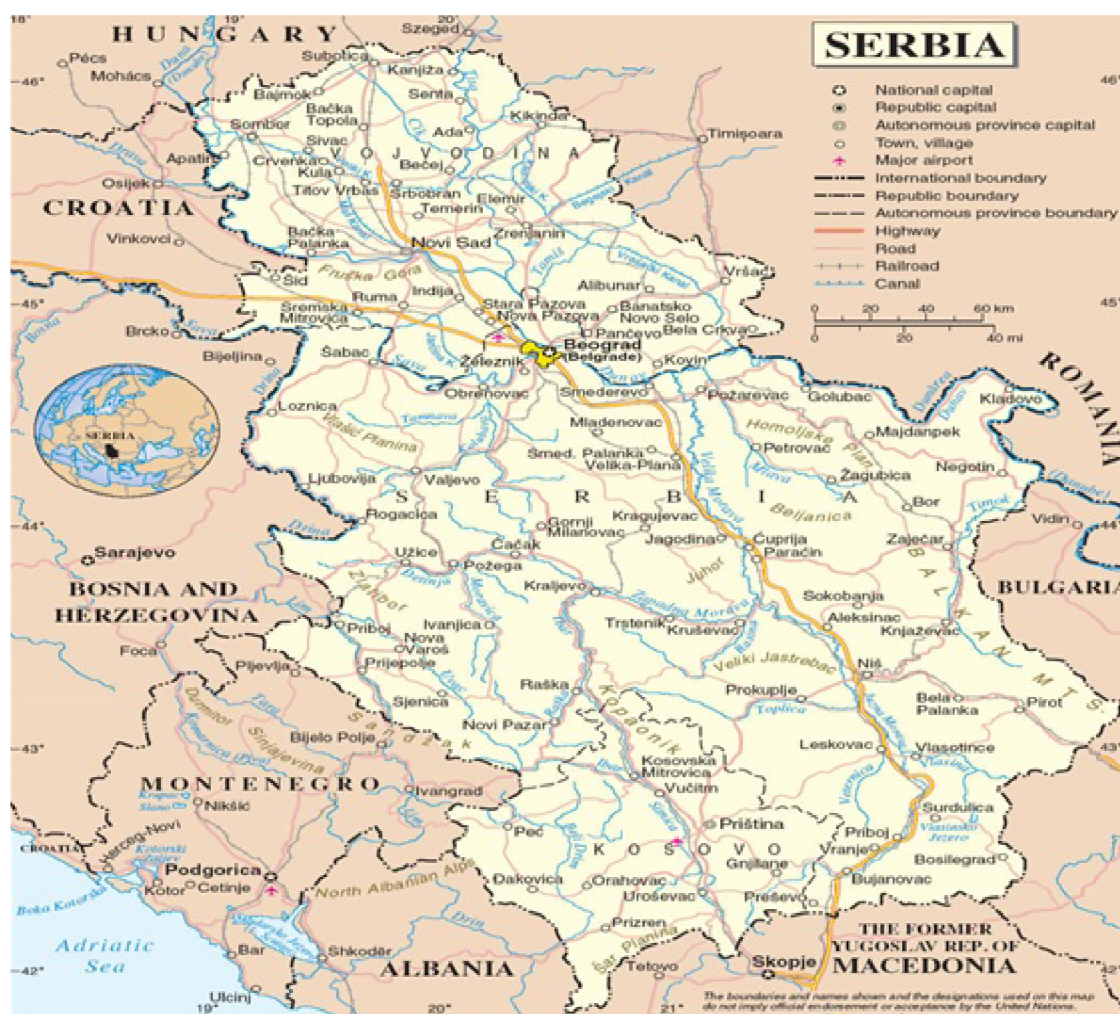
Obrázek č. 8 – Mapa Srbské republiky[2]

Nachází se v centru Balkánského poloostrova s hlavním městem Bělehrad. Jako samostatný stát vznikl 5. června 2006 po rozpadu soustátí Srbsko a Černá Hora. Sousedí na severu s Maďarskem, na východě s Rumunskem a Bulharskem, z jihu s Makedonií a na jihozápadě s Černou Horou a Kosovem, ze západu s Bosnou a Hercegovinou a Chorvatskem. Počet obyvatel Srbska se pohybuje kolem 8 milionu, z toho 82% je právě Srbů.[8, 15]