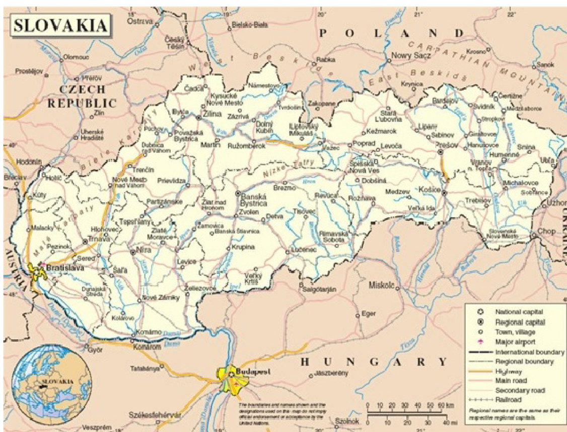
Obrázek č. 1 – Mapa Slovenské republiky[2]

Slovensko je vnitrozemský stát ležící ve střední Evropě s hlavním městem Bratislava. Slovensko má na jihu nížinatý charakter, střed a sever je hornatý a na východě je krajina mírně zvlněná. Sousedícími státy jsou Česko, Rakousko, Maďarsko, Ukrajina a Polsko[1].