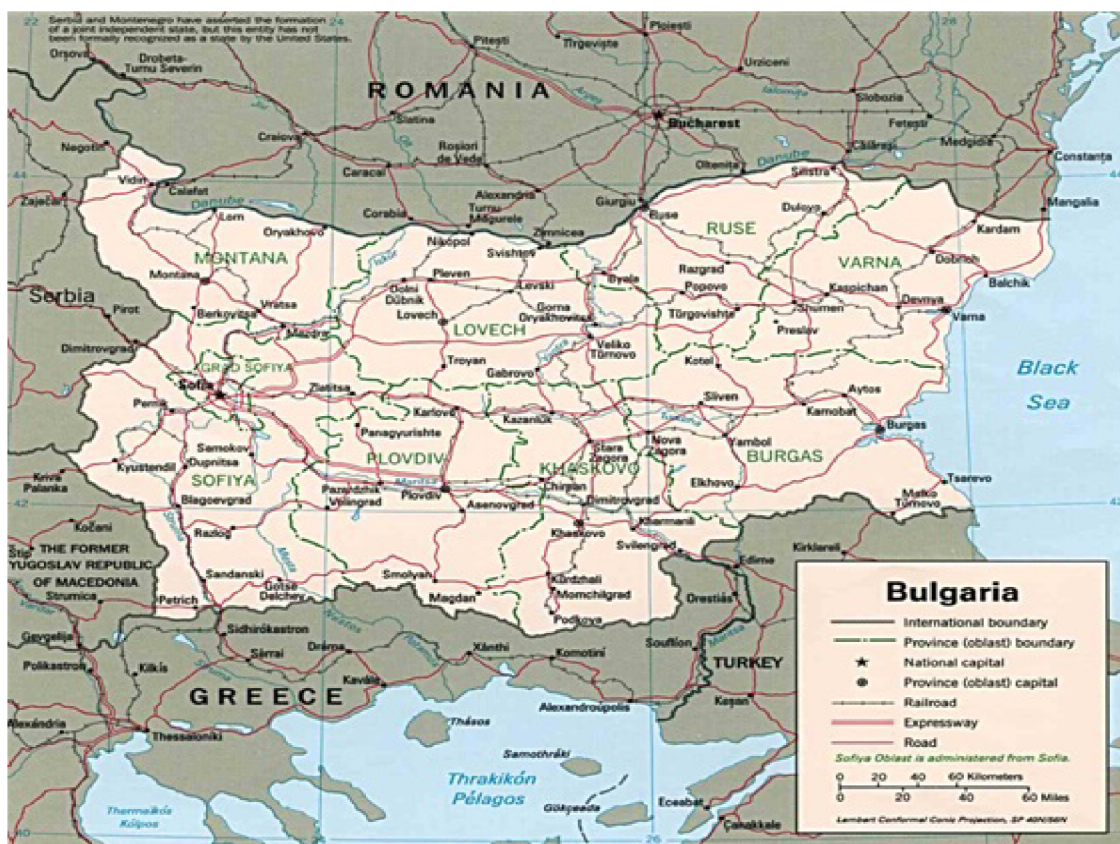
Obrázek č. 4 – Mapa Bulharské republiky[4]

Česká republika má s Bulharskem dobré dlouhodobé obchodní vztahy. V dnešní době se do Bulharska převážně dováží osobní auta, součástky pro tramvaje, železniční lokomotivy, léčiva a čisticí prostředky.[6]