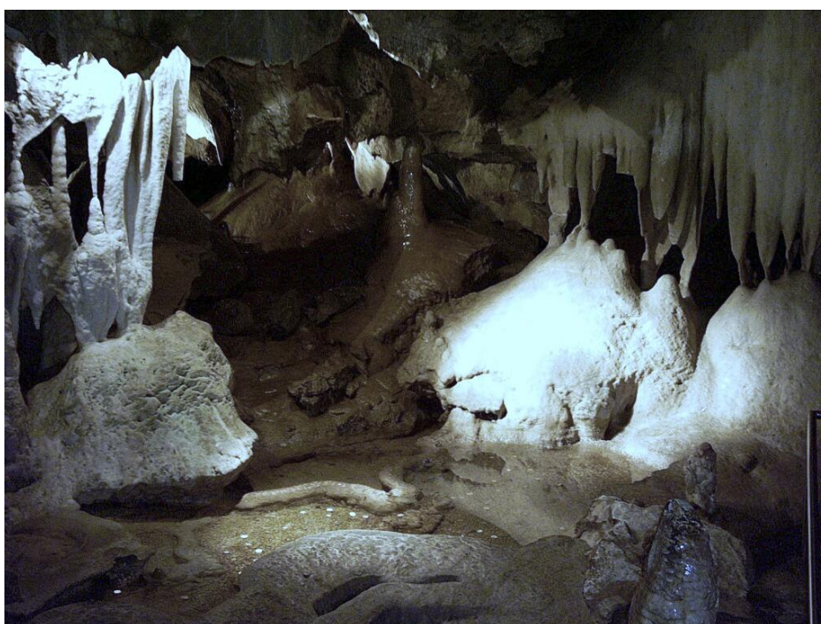
Obrázek č. 2: Jeskyně Na Pomezí

Od roku 1958 jsou jeskyně a jejich okolí zařazeny mezi chráněná území (dnes národní přírodní památka).