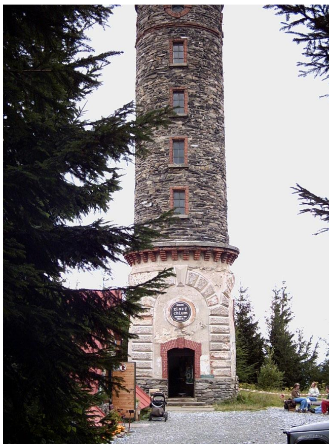
Obrázek č. 3: Rozhledna Zlatý Chlum

Na Zlatý Chlum se turisté mohou dostat z Jeseníku po červené a modré turistické značce. Rozhledna je otevřena od května do září za příznivého počasí. V zimním období pouze o víkendech. (jesenik.org, 2020e)