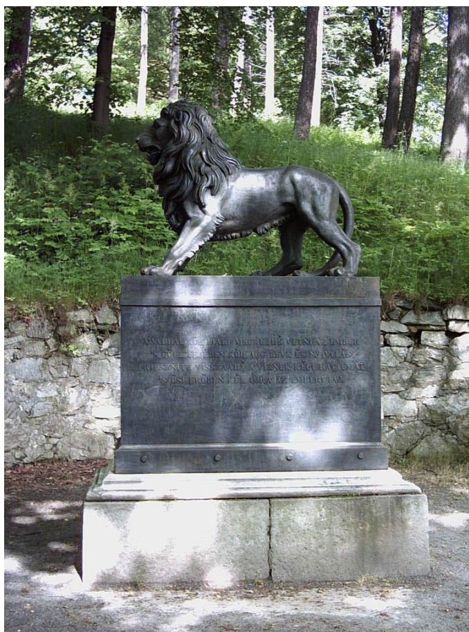
Obrázek č. 5: Maďarský pomník

Další byl zhotoven Francouzský památník, který nechal vytvořit v roce 1841 plukovník francouzské armády, rytíř de Plaremborg. (Kočka a Kubík, 2006:70-74)