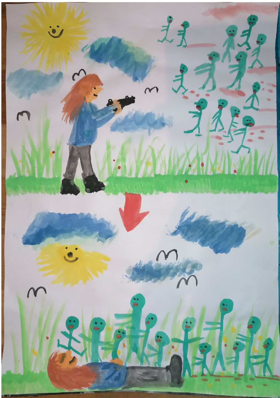
Obr. č. 1.