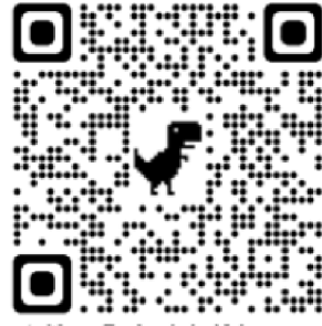
Aplikace Znakování s Nelou