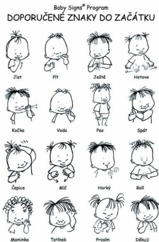
obrázek č. 1

Vyskytuje se i řada dalších programů znakování pro slyšící děti. Některé z nich vytvořili odborníci, jiné jsou pouze levnější alternativou kvalitnějších materiálů. Většina těchto programů se zaměřuje na výuku znakového jazyka pro neslyšící. Původ znaků (český znakový jazyk vs. program Baby Signs) není až tak důležitý, protože děti znakování přirozeně opouštějí s rozvojem mluvené řeči. Výhodou učení se českého znakového jazyka může být možnost osvojit si další jazyk v budoucnu.