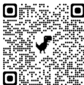
Pohádky ČT děčko