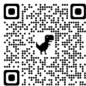
Aplikace Spread Signs