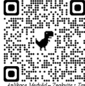
Aplikace Medvěď – Znakujte s Tamtamem