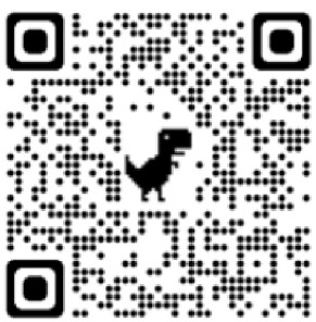
Aplikace Pexeso – Zakuňte s Tamtamem