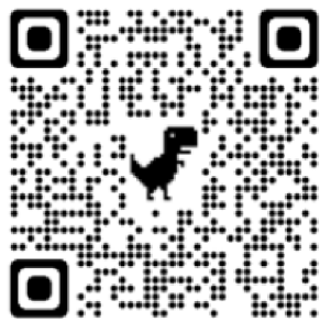
Pohádky ve znakovém jazyce