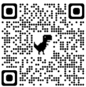
Aplikace Znakujte s Tamtamem