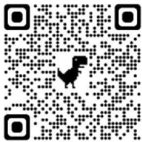
Tamtam e-hop, časopis Dětský sluch