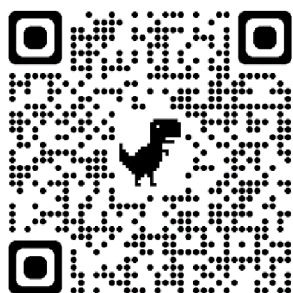
Sweet potatoes on the way