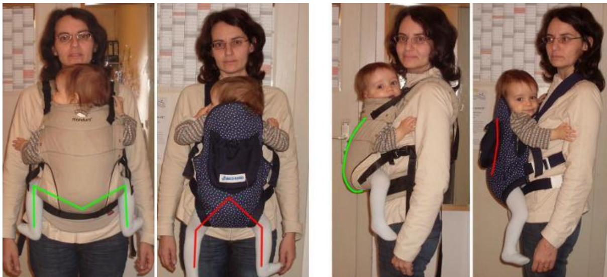
Obrázek 2 Porovnání ergonomického nosítka a klokanky

Neergonomická varianta nosítek, která má pouze úzký pruh látky v oblasti rozkroku dítěte a tuhou zádivou opěrku. V tomto případě tak není zajištěna správná poloha kyčlí a dítě v tomto nosítku spíše visí, což má za následek prohnutí zad do hyperlordózy (viz obrázek 2) (Kalousková, 2010, in press).