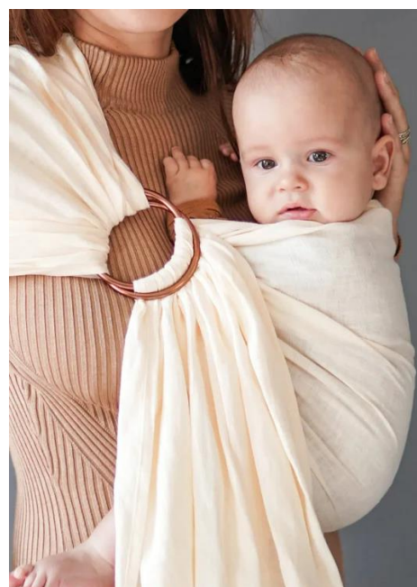
Obrázek 5 Ring sling