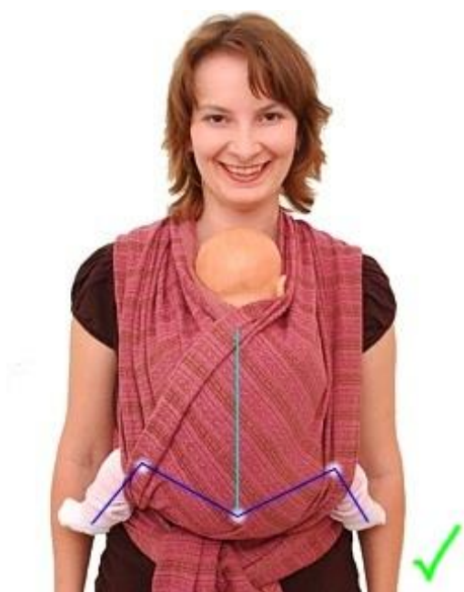
Obrázek 4 Šátek

Jde o krátký pevný šátek, na jehož jednom konci se nachází dva kroužky, jimiž se protáhne druhý konec šátku, díky čemuž se pak vzniklé nosítko utáhne (Kalousková, 2006). Kvůli svému způsobu úvazu jen přes jedno rameno je však vhodný spíše pro nošení malých dětí a na kratší dobu (viz obrázek 5) (Pohořálková, 2012).