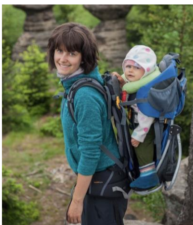
Obrázek 3 Krosna

Krosna je nosící pomůcka využívaná rodiči především při turistice. Pro menší děti je to ovšem další nevhodná varianta nosítka. Má pevnou kovovou konstrukci, ve které je sedátko pro dítě, které však nezajišťuje dostatečnou oporu zad. Navíc jak je vidět na obrázku 3, je dítě posazeno vysoko a daleko od nosící osoby, čímž jí mění těžiště těla, což ztěžuje udržení rovnováhy při chůzi a nutí rodiče k předklonu (Kalousková, 2010, in press).