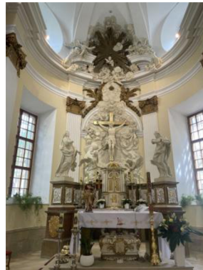
13. Hlavní oltář P. Marie Lurdské