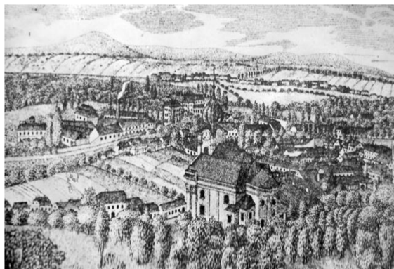
3. Pohled na Židlochovice, rytina z roku 1839

vlastnictví v roce 1896. 31 František II. potvrdil v roce 1793 občanům Židlochovic privilegia a roku 1873 byly Židlochovice povýšeny na město. Od roku 1921 je židlochovické panství ve správě Československé republiky. Pozemková reforma na panství proběhla v roce 1928. 32