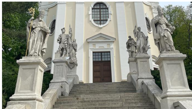
19. Sochy před vchodem do kostela

kněz, jeden z českých zemských patronů. Jeho socha je zde zobrazena oděná do kanovníckého roucha, v obou rukách drží krucifix a zvedá ho vzhůru. Druhá socha zobrazuje sv. Jana Nepomuckého a anděla, který nese jeho atribut. Socha sv. Linharta původně benediktinský mnich a poustevník. Je zde zobrazen v konvenční ikonografii na sobě má benediktinský mnišský hábit a vlasy má zastřižené do tonzury. V ohnutém levém lokti drží článek řetězu a u levé nohy mu leží dobytče. Socha sv. Augustina původně jednoho z církevních otců je opět zobrazena v obvyklé ikonografii. Světec je oděn v biskupském rouchu s mitrou na hlavě.