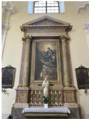
11. Vedlejší oltář zasvěcený Růžencové P. Marii

s korintskou hlavicí a jedním sloupem s korintskou hlavicí. Na podstavci oltáře stojí menší socha Krista. Oltář na protější straně nalevo od hlavního oltáře, je totožný, jiný je toliko obraz a menší socha na podstavci. Na obraze uvnitř oltáře je vyobrazení P. Marie a na podstavci stojí menší socha P. Marie. Hlavní oltář se nachází v západní části lodi, je pevně zasazený do podlahy. Centrálním motivem oltáře je ukřižovaný Kristus obklopený anděly. Po levé straně stojí postava P. Marie a po pravé straně postava sv. Jana Evangelisty.