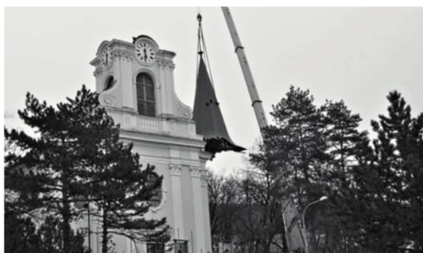
7.Rekonstrukce kostelní věže v roce 2013