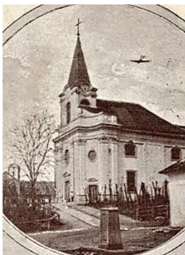
5. Pohlednice kostela z roku 1910

Legenda podává vysvětlení pojmu Povýšení svatého Kříže. Váže se k události z 4. století. Císařovna Helena, matka Konstantina Velikého, během své pouti do Jeruzaléma, dala hledat Kristův kříž. 52 Legenda praví, že byly v zemi nalezeny tři kříže, jeden z křížů přiložili k tělu mrtvého mladíka a ten byl zázračně vzkříšen. Na místě byl pak postaven chrám. V 7. století byla relikvie kříže ukořistěna perským králem Chosrevem II. a přesunuta do Persie. Byzantský císař Heraklesios kříž při vítězném tažení získal zpět a rozhodl se jej přesunout zpět do Jeruzaléma. Podle legendy jel Heraklios na koni a nesl kříž, anděl mu však zabránil vstoupit do Jeruzaléma. Císař se tak musel na výzvu anděla obléci jako kající, sesednout z koně a pěšky a bosý poté směl vnést kříž do města. Na památku této události je ustaven svátek Povýšení sv. Kříže. 53