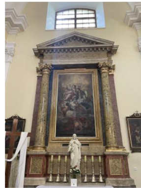
12. Vedlejší oltář zasvěcený sv. Janu Nepomuckému