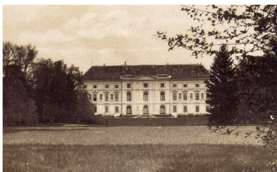
4. Zámek v Židlochovicích v první polovině 20. století