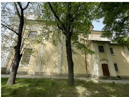
14. Pohled na boční stěnu kostela z jihu

nachází zvonice, je prolomeno okny půlkruhově zaklenutými s profilovanou šambránou. Okna jsou zakryta dřevěnou žaluzií. Nároží věže je členěno pilastry s kompozitní hlavicí. Nad okny jsou umístěny kruhové hodiny. Nad hodinovým ciferníkem se nachází kordonová římsa. Věž je zastřešená čtyřbokým stanem, který vrcholí makovicí s křížem. Strany věže zvýrazňuje nízký štít s volutovými křídly v šířce risalitu. Boční fasády [14,15] jsou členěné lizénami, prolomené dvěma okenními osami segmentově zaklenutými a jednou okenní osou pravoúhloú. Kněžiště je osvětleno dvěma pravoúhlými okenními osami a dvěma kruhovými okenními osami v patře. V závěru kněžiště [16] se nachází jedno slepé oválné okno.