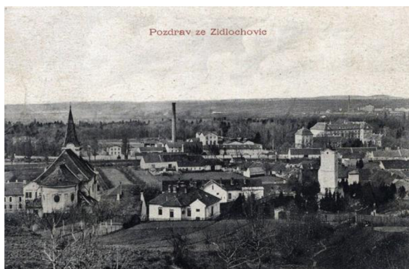
2. Historická pohlednice z roku 1910