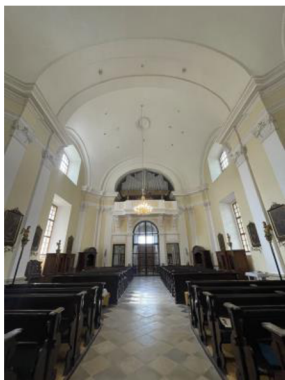
9. Interiér kostela, pohled směrem na hlavní vchod