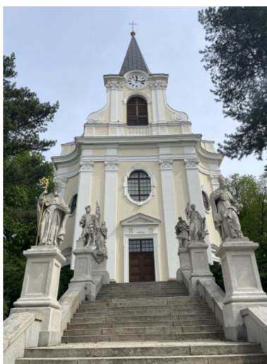
8. Aktuální vzhled kostela, pohled od východu

Jedná se o jednodlní orientovaný kostel [8], který se nachází v historickém centru města Židlochovice v okrese Brno-venkov a tvoří tak jeho dominantu. Orientován je ve směru západ-východ, s hlavním průčelím směřujícím k východu. Díky svému urbanistickému uspořádání, architektonické hodnotě a vazbám na okolní zástavbu je významným prvkem městského dědictví. V urbanistickém kontextu úzce souvisí s historickým vývojem Židlochovic. Kostel se nachází v severní části historického jádra, na mírném návrší při úpatí kopce Výhon. Kostel je situován v těsném sousedství farní budovy a necelý kilometr od židlochovického zámku. Je přístupný schodištěm lemovaným barokními sochami svatých, které navazuje na Komenského ulici. Kostel Povýšení sv. Kříže je chráněn jako kulturní památka České republiky.