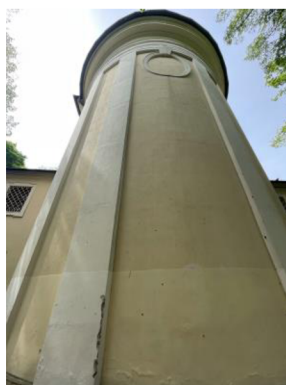
16. Pohled na závěr kostela

Pravoúhlá boční kaple o dvou okenních osách a kolem oken jsou šambrány. Podstřešní profilovaná římsa nese sedlovou střechu nad kněžištěm zvalbenou.