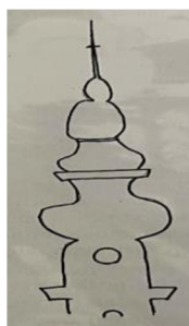
6. Pravidelný vzhled původní věže kostela