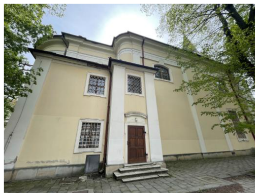
15. Pohled na boční stěnu kostela ze severu