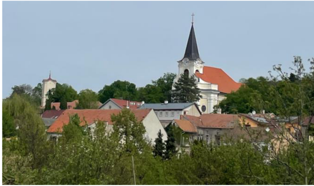
1.Současný pohled na město Židlochovice