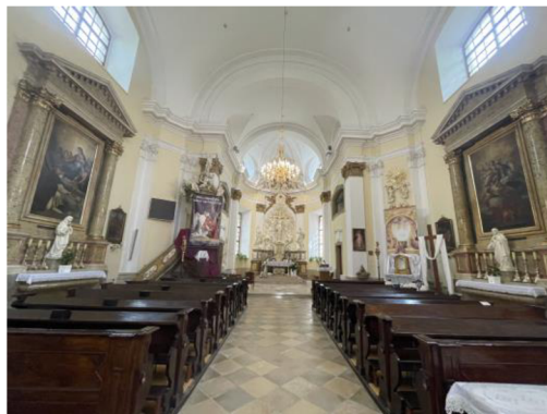
10. Interiér kostela, pohled směrem na hlavní oltář