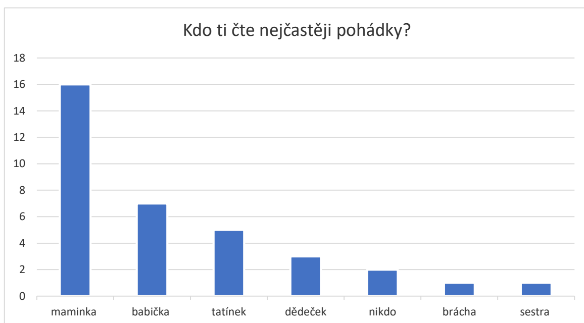
Graf č. 2 Vyjádření dětí, kdo jim čte nejčastěji pohádky (vlastní výzkum).

Povídali jsme si s respondenty o čtení a knihách. Když jsem se zeptala, jestli čtou doma sami, odpovědělo „ano“ 20 respondentů a „ne“ 15 respondentů. Dle odpovědí lze předpokládat, že děti spíše čtou. Ale vzhledem k počtu odpovědí „ne“ můžeme soudit, že tyto