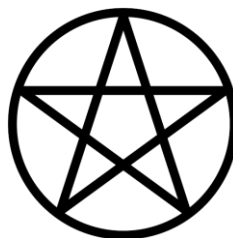
Obrázek č. 1 - symbol pentagram

provádění rituálů. Jeho další význam je například symbolika čísla pět, což lze vyložit jako čtyři základní živly (Voda, Oheň, Země, Vzduch) doplněné o další živel – Život. Nebo také jako pět lidských údů – hlava, nohy a ruce. Další možný výklad je z pohledu plynutí času, kdy každý cíp hvězdy označuje jedno období života – zrození, zrání, dospělost, stárnutí a smrt. 23