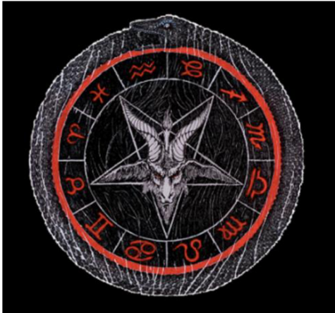
Obrázek č. 7 – znak P.ČS.CH.C.S.

Stejně jako většina církví má i P.ČS.CH.C.S. svou organizační strukturu. V té je 7 hierarchických postů, při čemž přechod mezi těmito posty může být jak vzestupný, tak mohou být jednotlivé stupně zasvěcení členům odebrány.