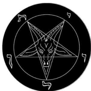
Obrázek č. 4 - symbol bafomet

funkci ochrannou, myšleno před vnějšími silami. Tento kruh má v satanismu poměrně velký význam kvůli jeho údajným ochranným vlastnostem. 27