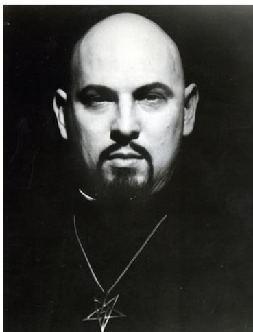
Obrázek č. 5 - Anton Szandor LaVey