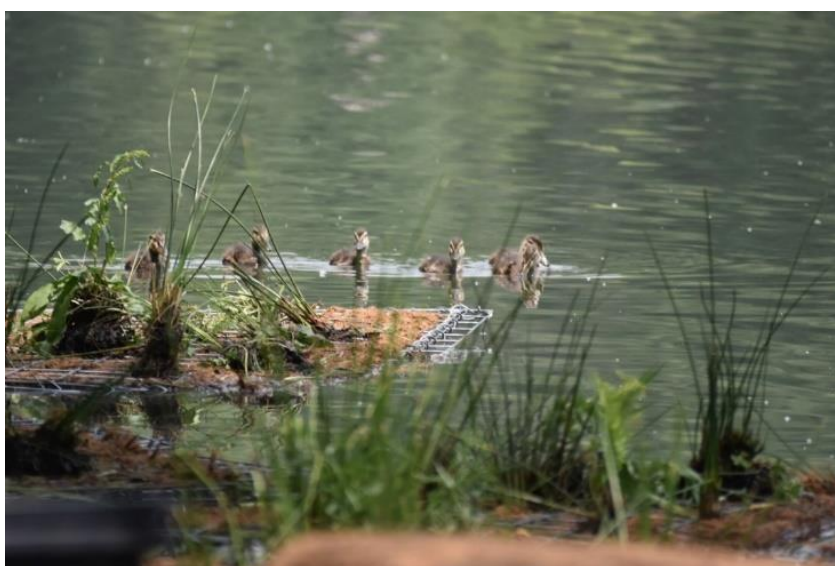
Obrázek 11: Využívání plovoucích ostrovů vodním ptactvem (URL 11).

V roce 2022 bylo zkonstruováno 8 z nich na rybnících Krvavý a Vlkovský a dále na lokalitách u Horního Jiretína. Projekt je úspěšný již po prvním roce. Na rybníce Krvavý se podařilo vyvést mladé samice Poláka chocholačky ( Aythya fuligula ). Na rybníce Vlkovský ptákům slouží ostrůvky jako odpočívadla. (Hladík a Musilová 2022).