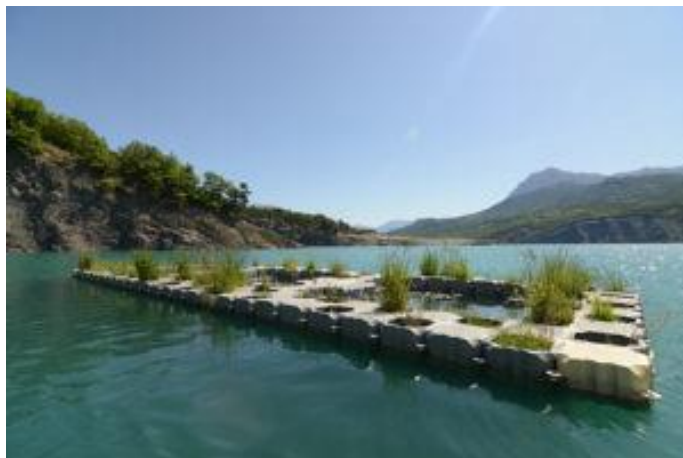
Obrázek 5: Konstrukční řešení umělých plovoucích ostrovů typu FLOLIZ (URL 5).

lanem, jehož délku je možné upravovat v závislosti na výšce vodní hladiny (Salmon a kol. 2022) (Obrázek 5).