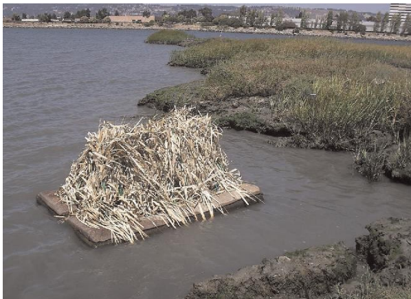
Obrázek 7: Konstrukce z recyklovaného plastu a matrace z vysokohustotní pěny (URL 7).

vytvořena zástěna z palmových listů, která byla připevněna k obvodovému rámu z PVC. Konstrukce byla upevněna pomocí nylonových lan a šroubových kotev. Celý objekt tak mohl působit dojmem uzavřeného prostoru (Overton a kol. 2015).