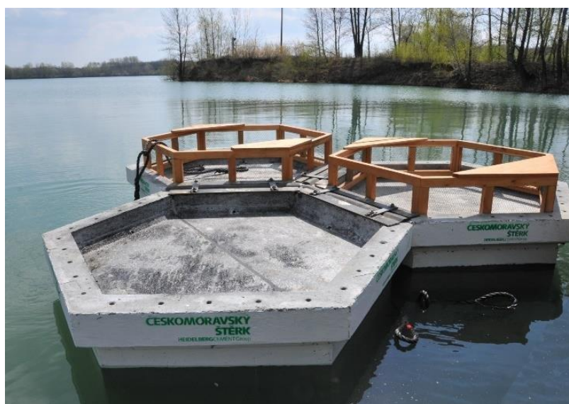
Obrázek 4: Stavba umělého plovoucího ostrova z betonových konstrukcí (URL 4).

Jako odolnější materiál pro tvorbu konstrukcí se jeví beton. Lépe odolává větru a vlnobití (Chytil a kol. 2017). Betonové kompozity navyšují odolnost a trvanlivost i podle Broukalové a Kohoutkové (2018). Vláknobeton byl zhodnocen jako moderní efektivní materiál pro stavbu plovoucích ostrovů. Je více ekologický než klasický beton, protože při menší tloušťce vykazuje stejnou odolnost. Zároveň je považován za trvale udržitelný materiál. Při stavbě bloků ve tvaru šestibokých hranolů určených pro konstrukci ostrovů byl použit vysokopevnostní vláknobeton, který byl navíc ještě vyztužen umělými vlákny (Obrázek 4). Odlehčen byl ostrov pomocí polystyrenové vrstvy uvnitř konstrukce. Ve spodní části jsou připevněny háky, pomocí kterých je ostrov ukotven. První takový umělý ostrov byl aplikován v roce 2009 (Broukalova a Kohoutkova 2018).