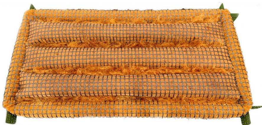
Obrázek 3: Konstrukce 3D modulu plovoucího ekosystému firmy Biomatrix (URL 3).

Konstrukční řešení skotské firmy Biomatrix se podobá konstrukci dle užitého vzoru CZ 34438 U1. Ke konstrukci umělých plovoucích ostrovů jsou používány moduly různých velikostí a tvarů. Základem konstrukce je plastový rám vyplněný plastovou sítí. Rohože z kokosových vláken poskytují prostor pro zakořenění rostlin. Rostliny jsou na ostrově upevněny pomocí flexibilních válců. Dohromady je vše propojeno kovovými destičkami. 3D moduly (Obrázek 3) patří k nejpoužívanějším typům konstrukcí od této firmy (Anonymus 5).