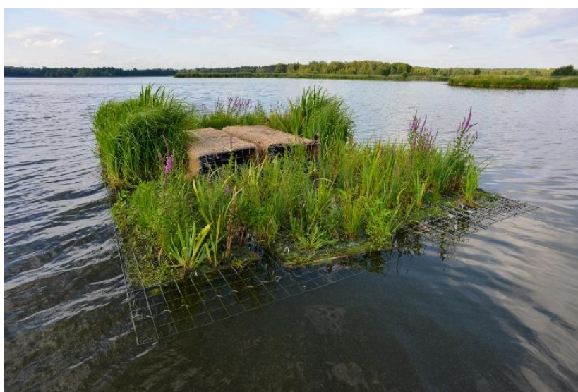
Obrázek 12: Vodní plovoucí ostrov zkonstruovaný v rámci programu RAGO (Jůnek 2022).