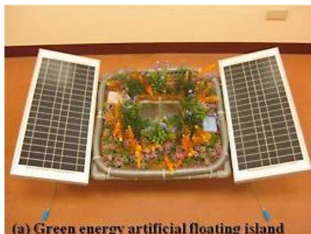
Obrázek 8: Konstrukce umělého plovoucího ostrova s provzdušňovacím zařízením (URL 8).

Některé firmy se dnes zabývají přímo zakázkovou výrobou plovoucích ostrovů. Příkladem může být skotská firma Biomatrix, jejíž technické řešení ostrova bylo použito i v rámci projektu Plovoucí zelené ostrovy nebo americká společnost BioHaven. Další společnosti poskytující zakázkovou výrobu umělých plovoucích ostrovů jsou německá firma Bestmann Green Systems nebo britská firma ARM Reedbeds Ltd, A.G.A. (Kohut 2015). Mezi české firmy zabývající se zakázkovou výrobou plovoucích struktur patří například firma Beňo-biotech.