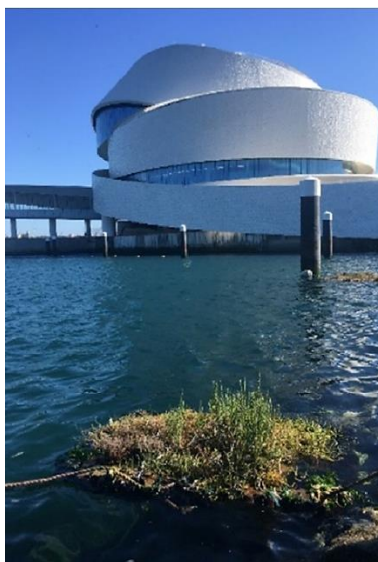
Obrázek 6: Konstrukce z korku (URL 6).

Jiný typ konstrukčního řešení používal Calheiros a kol. (2020) při své studii v Portugalsku. Plovoucí systém byl vyroben z korku, ve kterém byly vytvořeny otvory pro rostliny zasazené v kelímcích z kokosového vlákna. Korková vrstva byla připevněna ke kovové konstrukci. K propojení byly použity plastové svorky. Ostrov byl ukotven pomocí dvou lan se závažím tak, aby byl schopný reagovat na změnu výšky vodní hladiny (Calheiros a kol. 2020) (Obrázek 6).