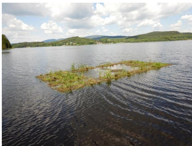
Obrázek 10: Zelené plovoucí ostrovy na nádrži Lipno (URL 10).

Jedním z projektů zabývajících se vývojem technologií umělých plovoucích ostrovů zejména pro prostředí vodních nádrží byl projekt Plovoucí zelené ostrovy, perspektivní alternativa pro zlepšení ekologického potenciálu a podporu rozvoje litorálních společenstev na vodních nádržích (TH02030633). Byl uskutečněn mezi lety 2017 a 2020 v rámci programu Epsilon. Cílem bylo vytvořit plovoucí systémy, které by odolaly přírodním podmínkám v České republice a zároveň by zlepšovaly ekologickou funkčnost vodních nádrží. Součástí projektu bylo i sestavení ostrova zapuštěného pod vodní hladinou a poskytujícího vhodné podmínky pro růst emerzních rostlin. V projektu byla použita konstrukce firmy Biomatrix. Instalace vodního ostrova proběhla na vodní nádrži Lipno (Anonymus 3) (Obrázek 10).