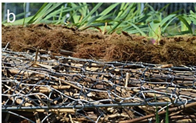
Obrázek 2: Detail konstrukce z ocelové sítě vyplněné rákosem (URL 2).

Konstrukční řešení skotské firmy Biomatrix se podobá konstrukci dle užitého vzoru CZ 34438 U1. Ke konstrukci umělých plovoucích ostrovů jsou používány moduly různých velikostí a tvarů. Základem konstrukce je plastový rám vyplněný plastovou sítí. Rohože z kokosových vláken poskytují prostor pro zakořenění rostlin. Rostliny jsou na ostrově upevněny pomocí flexibilních válců. Dohromady je vše propojeno kovovými destičkami. 3D moduly (Obrázek 3) patří k nejpoužívanějším typům konstrukcí od této firmy (Anonymus 5).