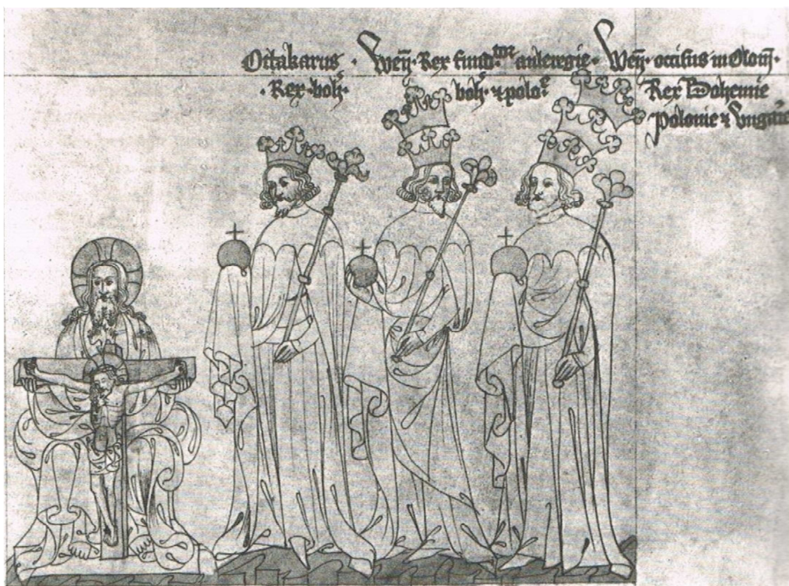
Příloha č. 3