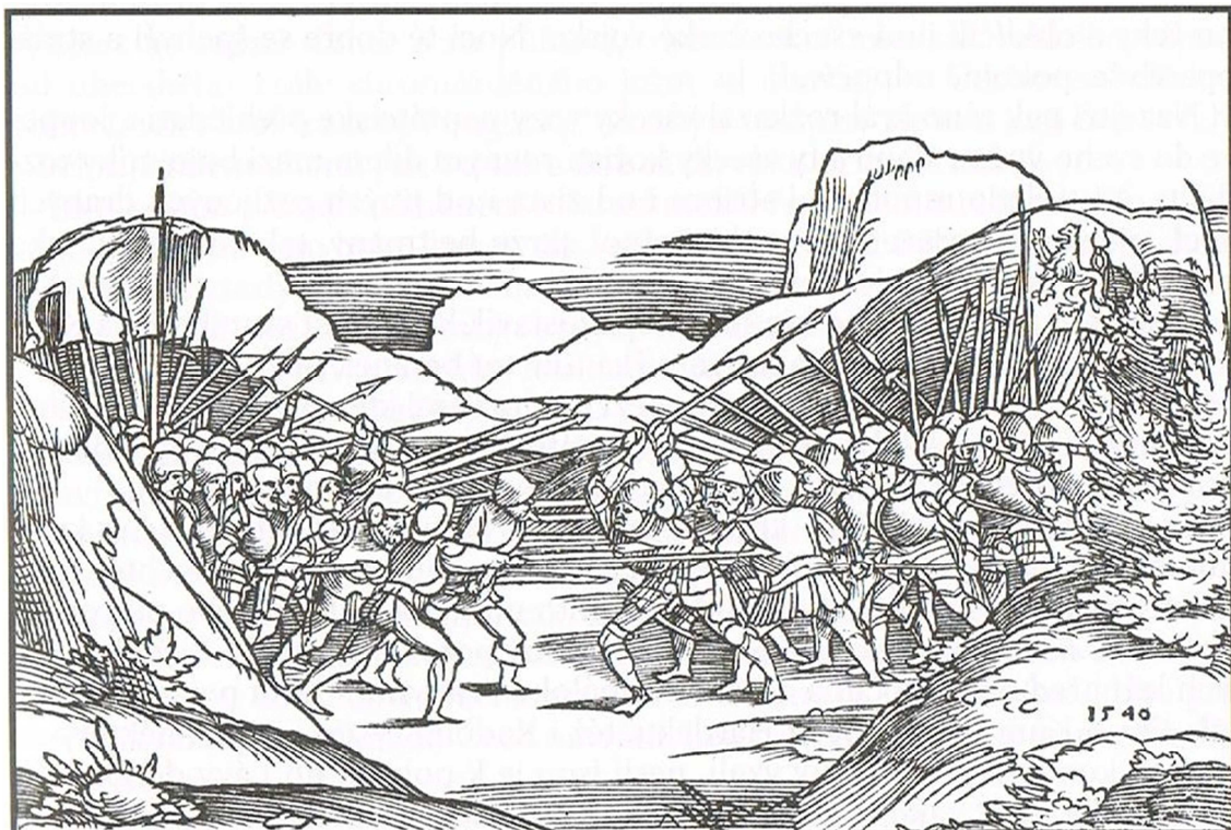
Příloha č. 5