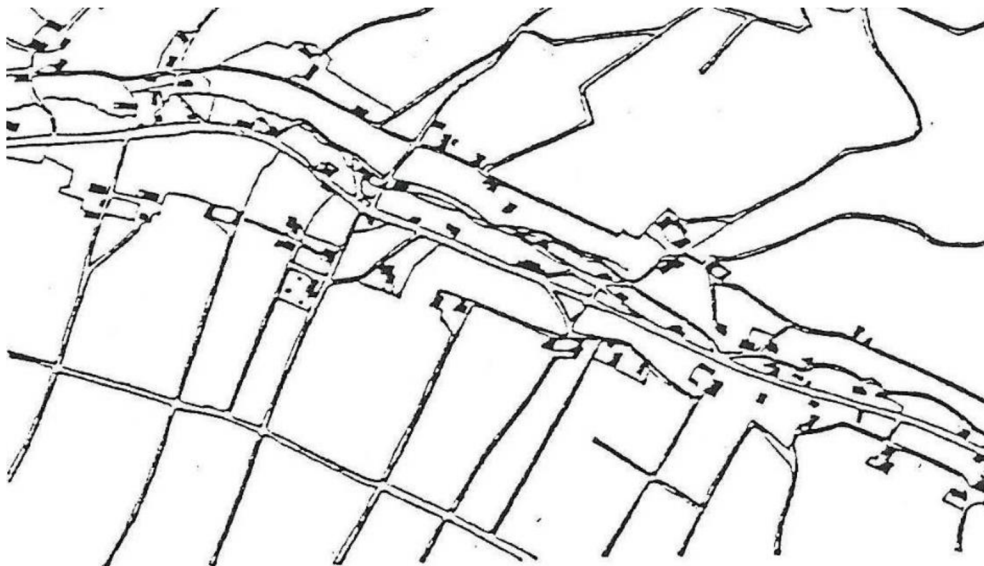
Obrázek 3 - Vesnice s rozvolněnou zástavbou