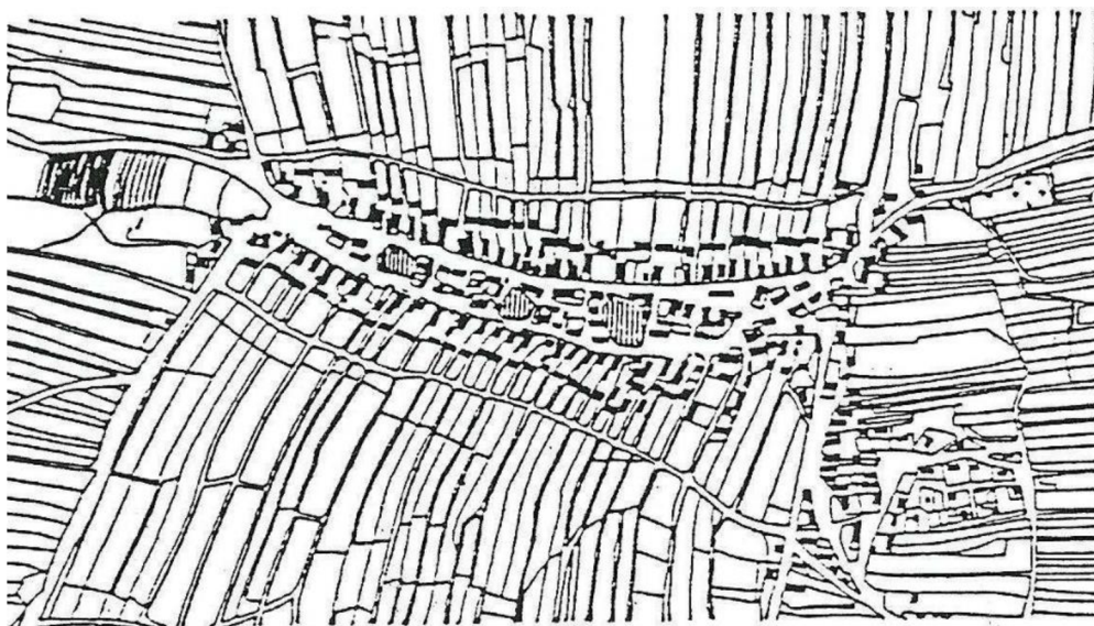
Obrázek 2 - Vesnice s řadovým, lineárním půdorysem

Zdroj: Ekosystémová a krajinná ekologie, Kovář, 2014