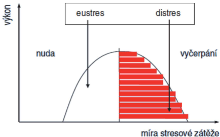
Obrázek 1 - Reaktivita stresu 14