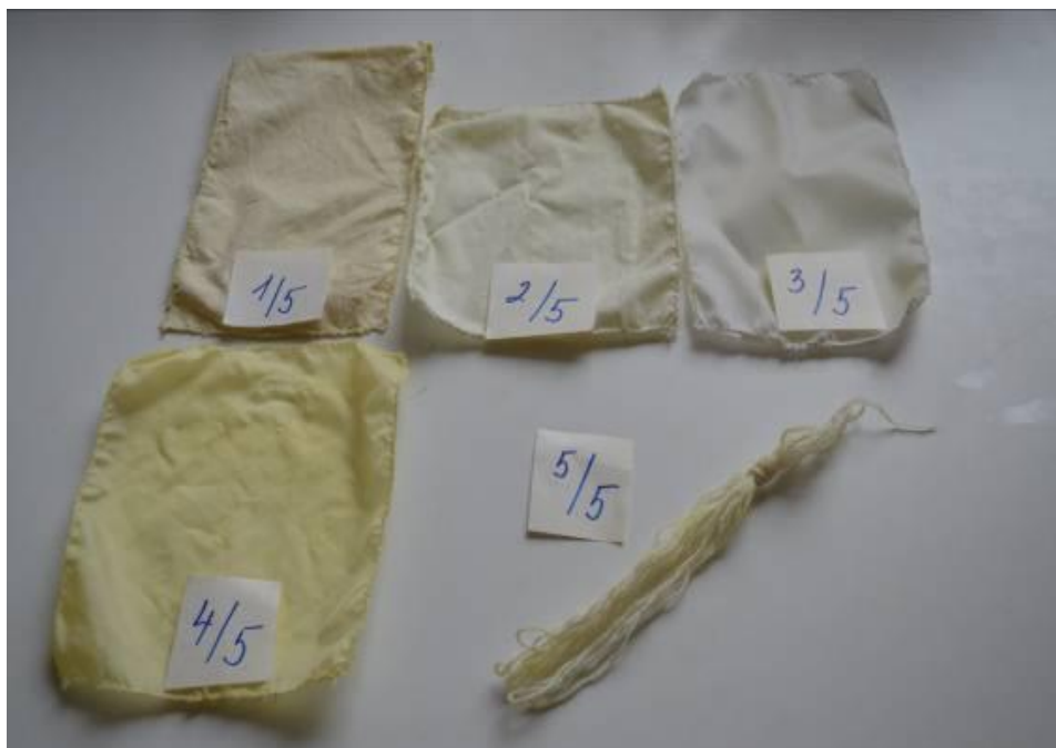
Obr. 11 Porovnání všech barvených materiálů z lázně krátce louhovaného sušeného vratiče (Gálová, 2014)

Legenda Obr. 11 – 1/5 (bavlna), 2/5 (plátno), 3/5 (slotera), 4/5 (šusťákovina), 5/5 (vlna)