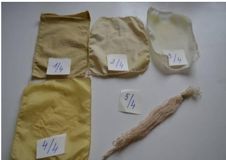
Obr. 10 Porovnání všech barvených materiálů z lázně krátce louhovaných sušených plnokvětých aksamitníků (Gálová, 2014)

Legenda Obr. 9 – 1/3 (bavlna), 2/3 (plátno), 3/3 (slotera), 4/3 (šusťákovina), 5/3 (vlna)