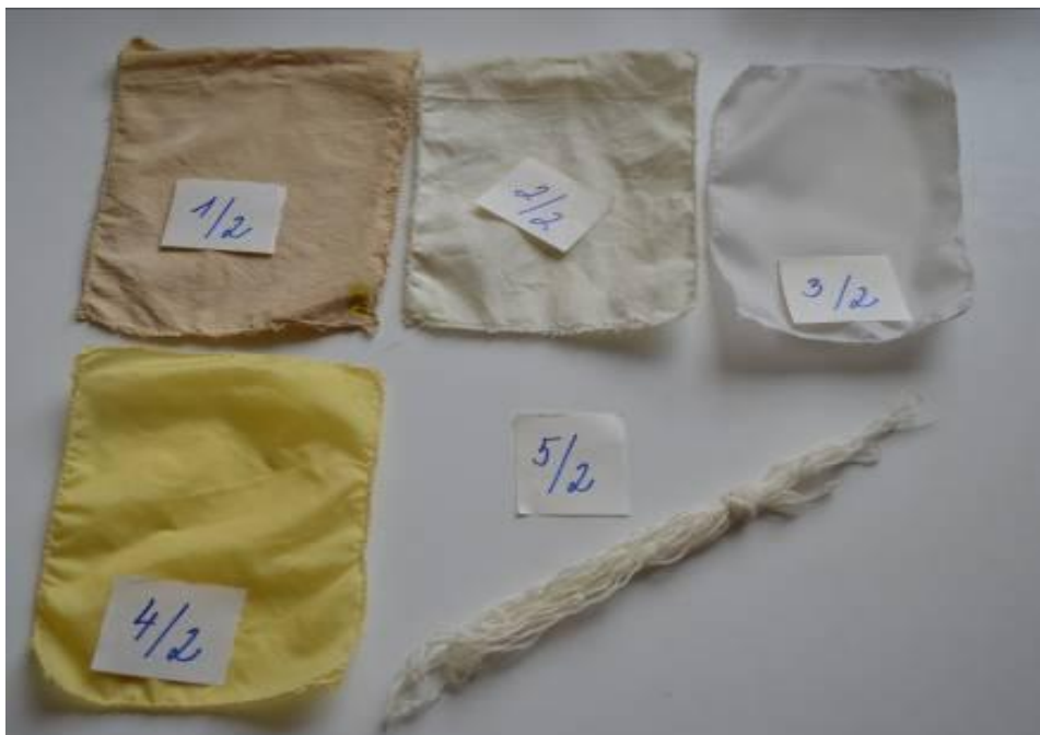
Obr.8 Porovnání všech barvených materiálů z dlouze louhované lázně plnokvětých oranžovohnědých aksamitníků (Gálová, 2014)

Legenda: 1/1 (bavlna), 2/1 (plátno), 3/1 (slotera), 4/1 (šusťákovina), 5/1 (vlna)