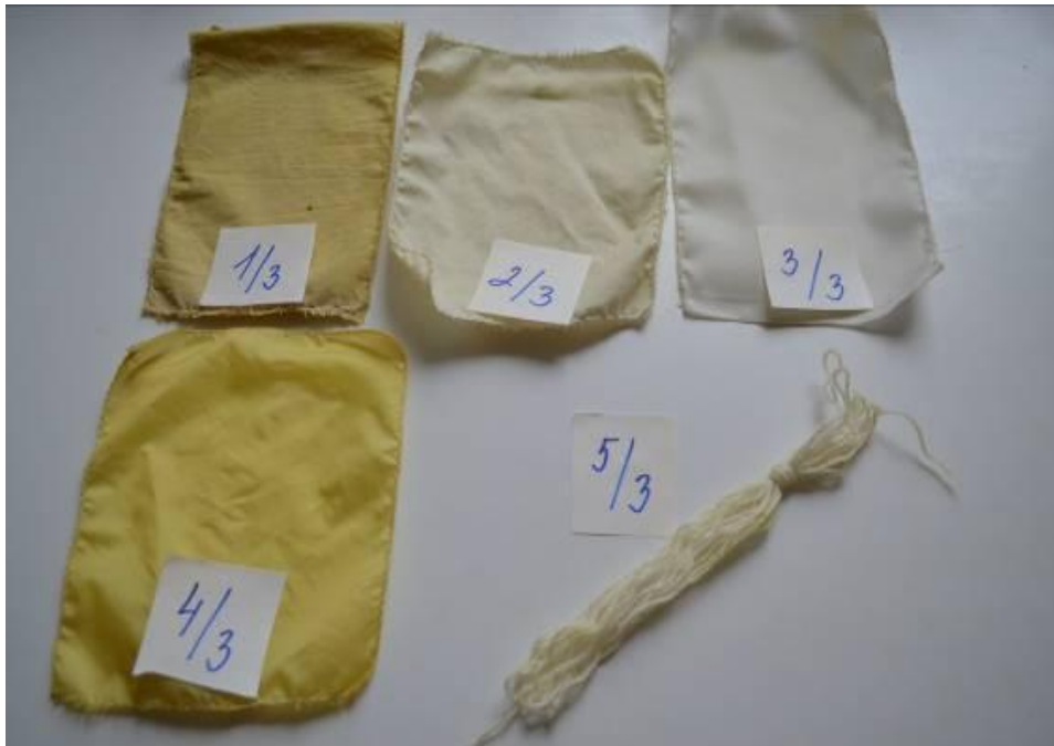
Obr. 9 Porovnání všech barvených materiálů z lázně krátce louhovaných živých plnokvětých aksamitníků (Gálová, 2014)

Legenda Obr. 9 – 1/3 (bavlna), 2/3 (plátno), 3/3 (slotera), 4/3 (šusťákovina), 5/3 (vlna)