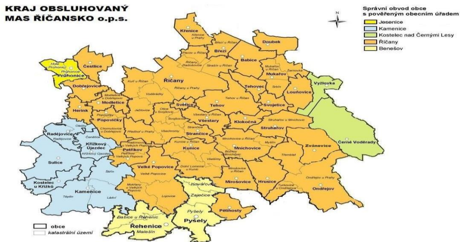
Obrázek 7 Mapa území MAS Říčansko