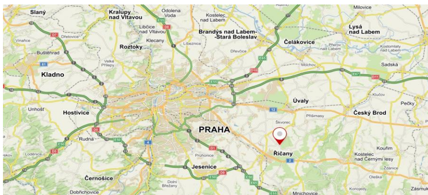
Obrázek 2 Umístění obce Březí