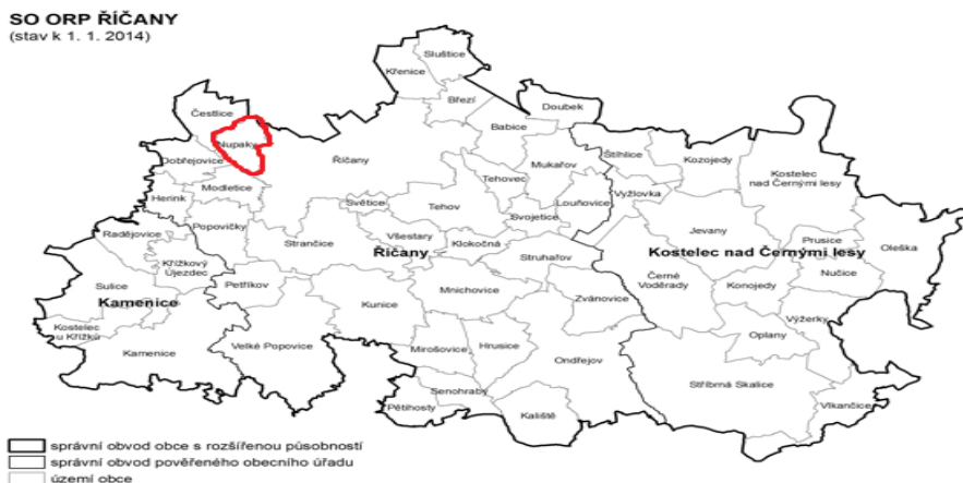
Obrázek 6 Umístění obce Nupaky