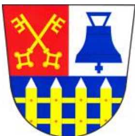
Obrázek 5 Znak obce Nupaky

Obec Nupaky leží ve Středočeském kraji, v okrese Praha-východ. Nachází se v nadmořské výšce 310 m. n. m. Rozloha obce činí 318 ha s 1339 obyvateli. Nupaky spadají do správního obvodu obce s rozšířenou působností Říčany, ty jsou vzdálené přibližně 4 km. Obec leží jihovýchodně od Prahy, blízko k 8. km dálnice D1. Poblíž Nupak se nachází Průhonický park, Dendrologická zahrada Průhonice, Aquapalace Praha, Čestlice a jsou součástí obcí Ladova kraje. Obcí vede cyklotrasa 0027 Průhonice – Čestlice – Nupaky – Kuří – Říčany, dlouhá 9 km. Své sídlo zde má Policie ČR, obvodní oddělení Čestlice, územní pracoviště Celního úřadu pro Středočeský kraj a MŠ Klubíčko, jež je zřízena obcí Nupaky. Starostu obce je Ing. Václav Řezáč, místostarostou Pavel Chmelíček (Nupaky, 2020).