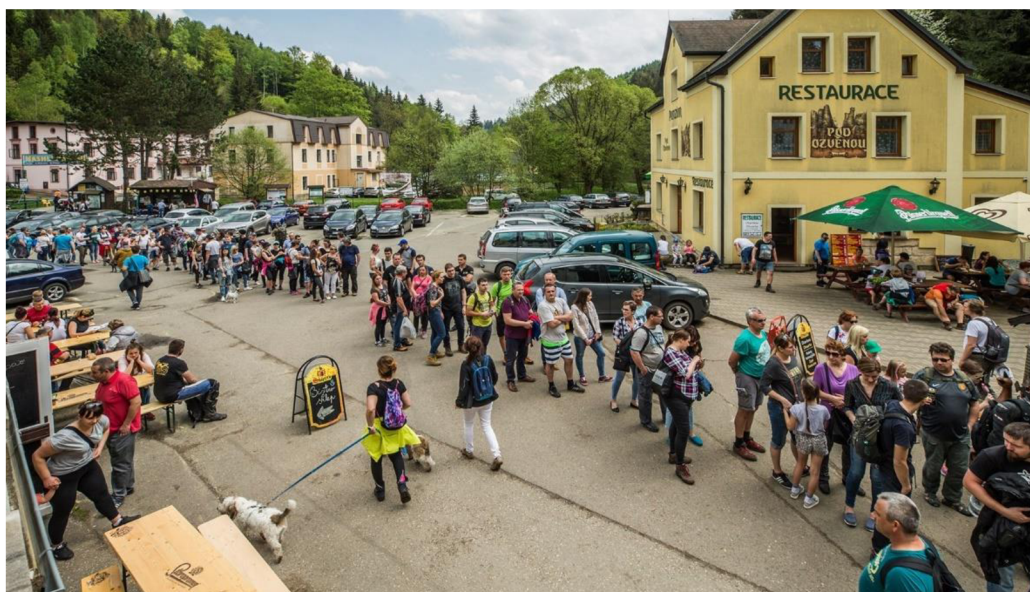
Obrázek 4: Fronta návštěvníků čekajících na vstup do Adršpašsko-teplických skal

Adršpašsko-teplické skály se na žebříčku návštěvnosti památek Královehradeckého kraje řadí již na druhou příčku a jedná se o jedno z nejoblíbenějších míst v České republice. Národní přírodní rezervace vznikla již v roce 1933. Památka se nachází v regionu Broumovsko a představuje největší celistvé skalní město, jaké lze ve střední Evropě navštívit. V roce 2019 hostily Adršpašsko-teplické skály více než 530 000 návštěvníků. S nadměrným počtem návštěvníků přírodní památky se pojí nadměrné dopravní zatížení zde i v okolí, kdy často dochází k přetížení parkovacích ploch určených návštěvníkům.