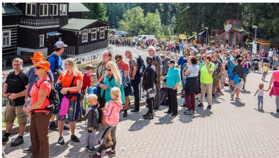
Obrázek 6: Fronta čekajících na lanovku na Sněžku

Vyjma karty hosta, která již na území Krkonošského národního parku funguje, by bylo v rámci KRNAPU možné na určitou dobu uzavřít, alespoň za pomoci ohraničení, části krajiny, jež jsou nadměrnou koncentrací turistů nejvíce poškozeny, a umožnit tak tamní flóře i fauně jejich obnovu a regeneraci. Důležité by bylo informovat o této skutečnosti také budoucí návštěvníky Krkonošského národního parku, kteří by svůj záměr návštěvy poté mohli přehodnotit nebo se alespoň těmto místům vyvarovat. Další způsob, jak přinejmenším zamezit negativním dopadům nadměrného turismu v této oblasti, je umístění většího množství odpadkových košů na místa, kde se návštěvníků shlukuje nejvíce. Řešení častého porušování pravidel týkajících se pěší turistiky po vyznačených trasách a následné ničení místní vegetace by mohlo představovat umístění většího množství kamer či používání dronů pro kontrolu pohybu hostů po celém národním parku. Z důvodu rozlehlosti Krkonošského národního parku je ovšem plošné omezení pro celou lokalitu velice náročné zrealizovat.