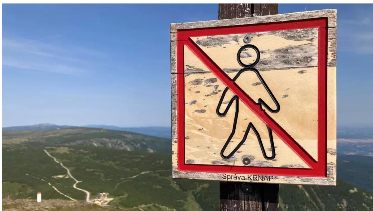
Obrázek 7: Značení upozorňující návštěvníky KRNP na zákaz vstupu