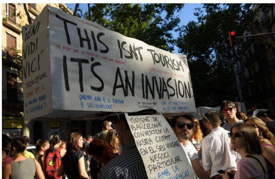
Obrázek 2: Obyvatelé Barcelony protestující proti nadměrnému množství turistů

Mezi další z hlavních faktorů, který vznik overturismu značně podporuje a usnadňuje, lze zařadit snadnou dostupnost veškerých míst, ať už automobilovou, autobusovou či vlakovou dopravou. U téměř každé památky nalezneme prostorné parkoviště, kde – i když ve většině za vysokou částku – lze bez problému zaparkovat auto, autobus nebo jiné motorové vozidlo a pokračovat směrem k našemu stanovenému cíli. Horší ale je, že tato příčina vzniku overturismu není snadno odstranitelná a lidé jí nejspíše ani odstranit nechtějí. (Seznam Zprávy, 2022)