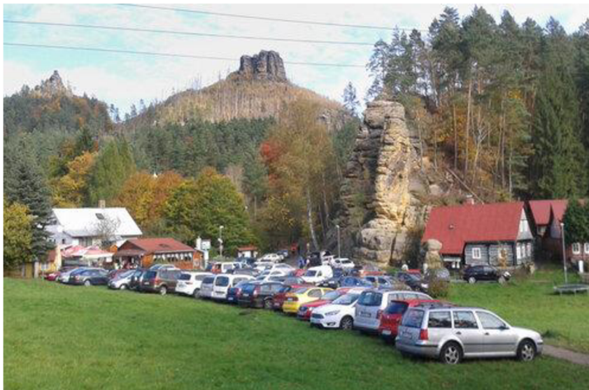
Obrázek 5: Problém s nárůstem individuální automobilové dopravy

vývoje návštěvnosti mezi lety 2009 až 2019 lze vyzorovat její postupný nárůst. V roce 2019 navštívilo České Švýcarsko více než 1 000 000 návštěvníků.