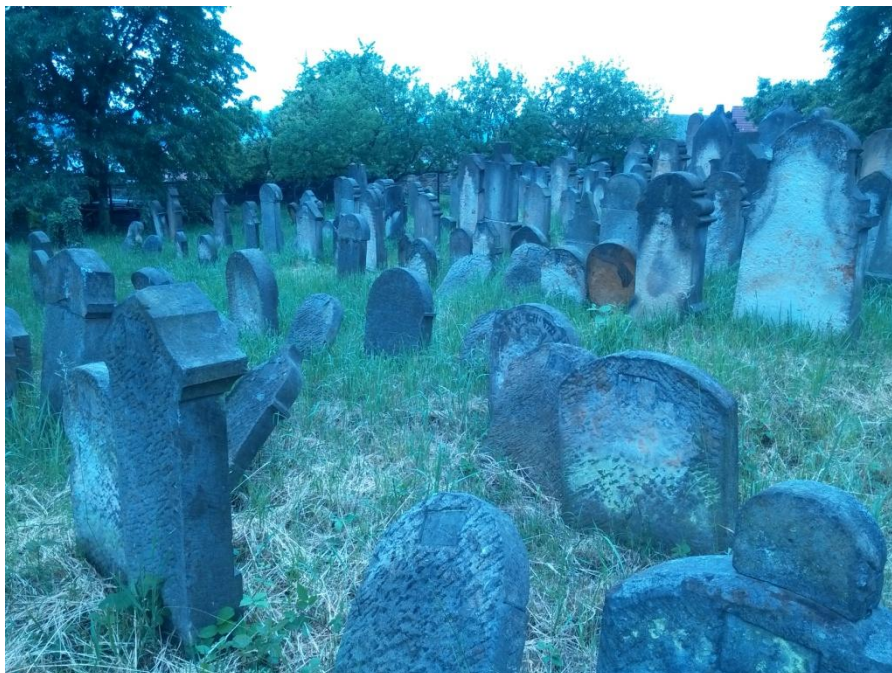
Obrázek 2 – Koheni – Žehnající ruce (autor, 5. 6. 2016)