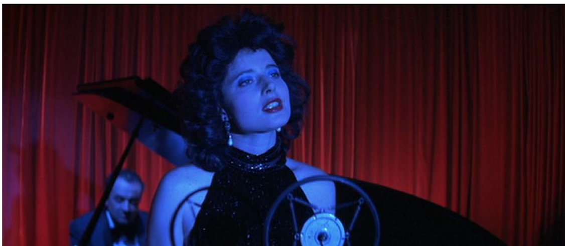
Obr. 11 – Blue Velvet . David Lynch. 1986

zachycenou ve filmu a svět myšlenek a pocitů. Dobrým příkladem je toho Lost Highway , film, který má tolik narativních úrovní, které na sebe nenavazují, že většina lidí neví ani po letech o čem tento film vlastně je. Přesto toto dílo jako celek velmi dobře funguje. Jeho struktura je spíše podobná přemýšlení zmateného a poblouzněného člověka, jehož myšlenky