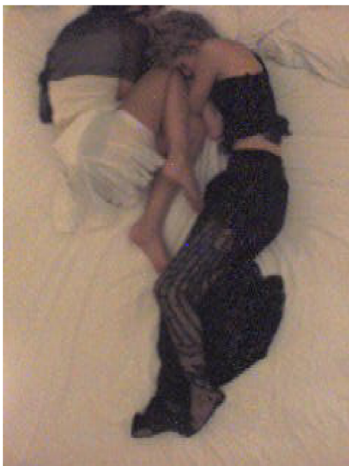
Obr. 9 – Sleep . Nick Knight. 2001

další příklad blízkosti mezi filmem a fotografií, ovšem v tomto případě v obecném kontextu, nikoliv pouze v případě módního zaměření, ačkoliv snímky Věry Chytilové jsou velmi podobné dnešním fashion filmům, zejména kvůli experimentálnosti a kamerovým technikám, které její filmy nabízejí. Co týče tématu staticčnosti, je důležité zmínit experimentální přístup, který zvolila menší skupina tvůrců spojená se SHOWstudio, mezi něž patří Jean-François Carly či samotný Nick Knight, kteří se ve svých dílech