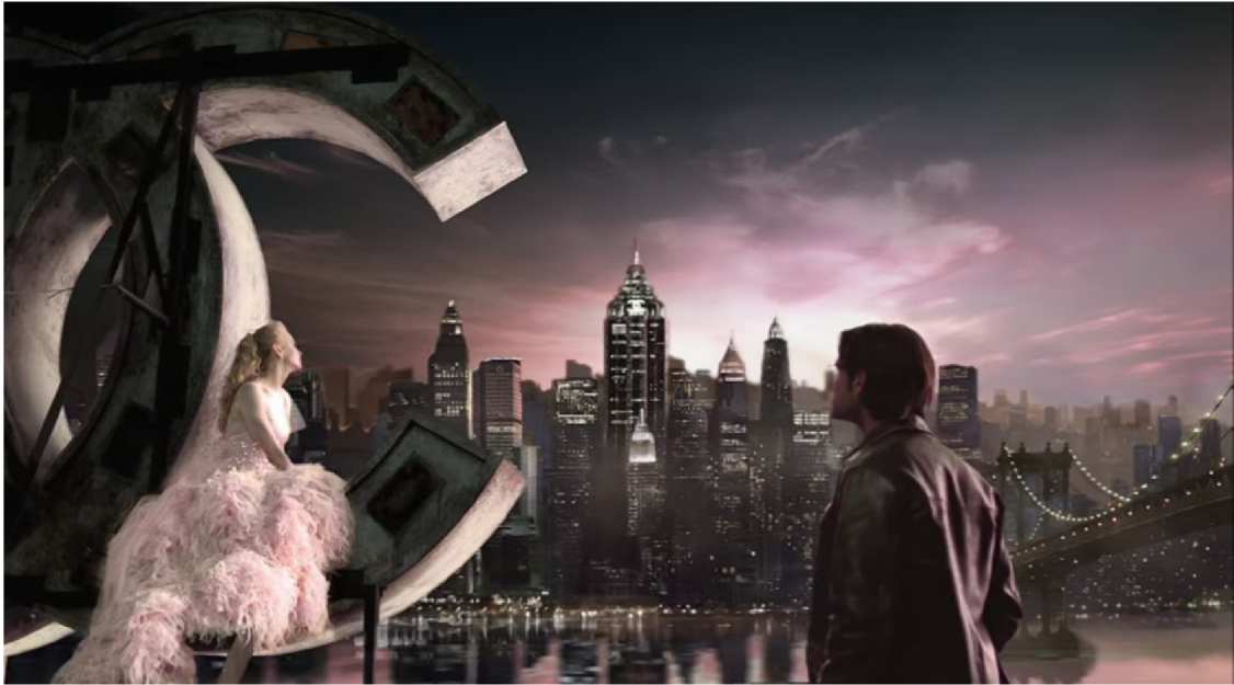
Obr. 12 – Chanel N°5. Buz Luhrmann. 2004

prostředníky mezi značkou a jejím publikem. Mají evidentní svůdnou a aspirační funkci. V tomto případě nejsou produkty zdůrazňovány a někdy není ukázáno ani logo nebo jiné fyzické atributy značky. Paul Ricoeur by řekl, že lidská identita se buduje prostřednictvím vyprávění našeho vlastního příběhu, výběráním faktů a jejich propojováním podle zápletky. 9 Celistvost vyprávění tak vytváří identitu postavy. I když módní filmy nemusí být striktně založeny na mýtech, jsou to také vyprávěné příběhy, které mají funkci zprostředkovat význam. Dávají smysl naší identitě a v oblasti spotřeby dávají smysl aktu nákupu konkrétního produktu. Mýty však stále vytvářejí a přenášejí narativní obrysy a archetypy, které se stávají součástí všeobecného přesvědčení. Postavy jako hrdina, padouch nebo dobrodruh a hodnoty jako čest, svoboda, vzpoura či nevinnost se skrývají pod příběhy, které některé značky představují.