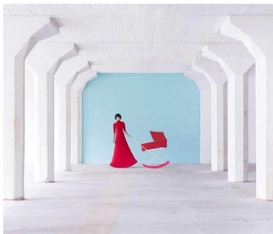
Obr. 10 – Clock . Bára Prášilová. 2019

významné české módní fotografky Báry Prášilové, která ovšem jako předlohu využívá místo tradičního filmu právě současné módní filmy. Abstrakce, neobvyklý pohyb a výrazná barevnost jsou aspekty, které propojují její fotografickou tvorbu se současnými trendy módního filmu.