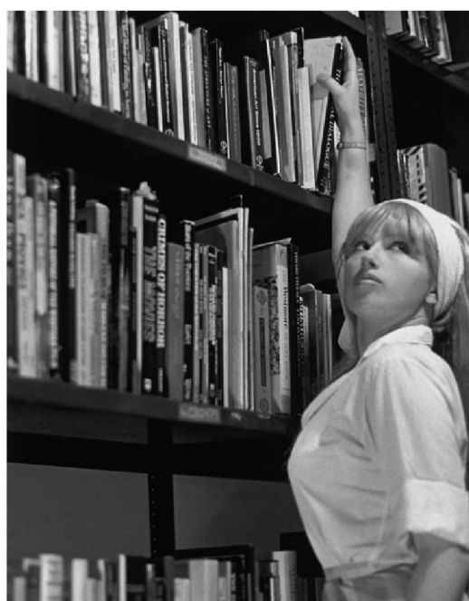
Obr. 3 – Untitled Film Stills . Cindy Sherman. 1978