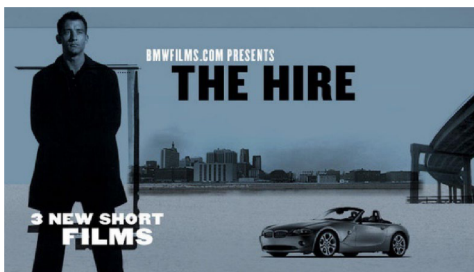
Obr. 7 – The Hire . BMW. 2002

snímky byly krátké délky. Ovšem účel krátkého filmu se v průběhu desetiletí měnil. Během první dekády 21. století se módní film a jeho principy začal objevovat čím dál tím častěji, a to zejména příchodem digitální doby. Jak již bylo zmíněno výše, principy módního filmu nejsou postaveny pouze na samotné podstatě módy a jejího explicitního promítnutí do snímku. Módní film je do jisté míry audiovizuální filosofie aplikovatelná na širší spektrum obsahu i produktů, může tedy být i o jiném obsahu než o tom módním. Dobrým příkladem jsou tomu krátké filmy, které si nechávají vytvořit automobilky. Jedná se o projekty, kde je komerční účel více patrný nežli v případě módy, ovšem způsob, jakým je k nim přistupováno, je velice podobný. Průkopníkem v této oblasti byla automobilka BMW, která v průběhu let nechala vytvořit sérii krátkých filmů, kde byl hlavní postavou hollywoodský herec Clive Owen, který zde ztvárnil postavu kurýra cenného a neobvyklého obsahu. Tato série vznikala s odstupem let a její režie se ujali věhlasní filmoví tvůrci. Přístup BMW byl ovšem více přímočarý a zaměřený na obsahovou stránku, než jak je tomu u módního