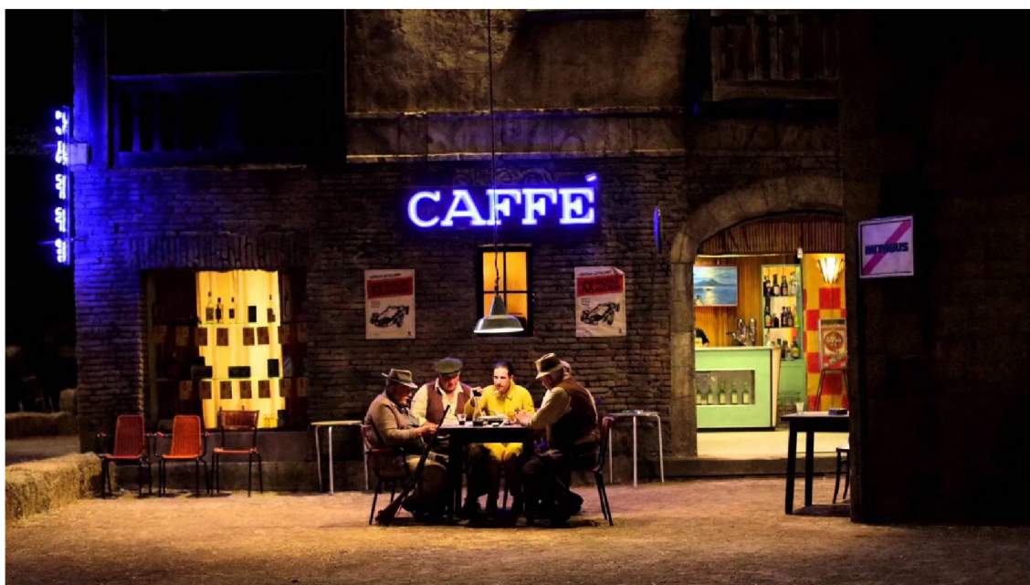
Obr. 4 – Castello Cavalcanti . Wes Anderson. 2013

Ačkoliv historie módního filmu sahá až do první poloviny 20. století, kdy se jednalo o čistě umělecké a nezávislé snímky, je tento druh krátkého filmu známý především díky komerčním počínům. Mnoho známých i méně známých módních značek své výrobky rádo vystavuje v audiovizuálním formátu, kde jsou často zachyceny ve videích různých formátů a účelů. Ve většině případů jsou video a krátké filmy pouhým informačním sdělením obohacným o jistou vizuální estetiku, mnohdy tomu tak bývá například při uvádění nových kolekcí či pro účely reklamy. Jsou však i případy, kdy si značka zaplatí významného filmového režiséra, aby zachytil esenci a filosofii značky. V takovýchto případech vznikají krátké filmy s narativem. Dobrým příkladem takového módního filmu je snímek Castello Cavalcanti od slavného filmového tvůrce Wese Andersona, kterého si pro natočení snímku najala Prada. Osmi minutový snímek zachycuje dění jednoho večera