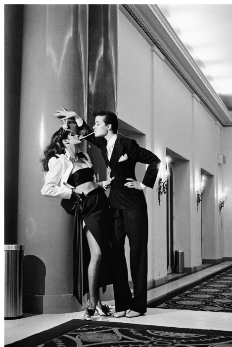
Obr. 1 - Yves Saint Laurent. Helmut Newton. 1979

Film i pohyblivý obraz obecně mají specifika, která nelze do fotografie přenést, v případě módního filmu, je však filosofie tím klíčovým prvkem. Pomyslný král módní fotografie Helmut Newton přinášel do statického obrazu zcela novou vrstvu kreativity a estetiky, která měla významný vliv jak na fotografii jako takovou, tak i na audiovizuální díla. Postavil tedy silné základy umělecky unikátního žánru, ze kterých módně založené vizuální umění čerpá do dnes. Výhodou fotografie je, že dokáže snadno přenést divákovi svou