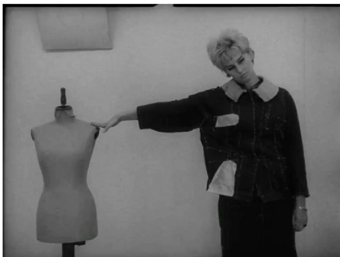
Obr.8 – Strop . Věra Chytilová. 1962

Filmaři pracují do velké míry odlišně. Ovšem i ona staticčnost může být umělecký záměr profesionálního filmaře, a to pro vytvoření napětí. Tento princip využívala například Věra Chytilová ve svém filmu Strop i mnoha dalších filmových dílech. Jedná se o