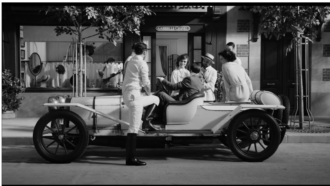
Obr. 5 – Once Upon A Time ... . Karl Lagerfeld. 2013

vzdálených příbuzných, po zbytek večera se už nechává obklopovat svými příbuznými a talířem špaget. Vizuální estetika je jasným rukopisem Wese Andersona, hodně žluté, trochu červené a hlavně geometrické. Prada si tak nechala vytvořit jako punc unikátnosti snímek od slavného režiséra vytvořený přímo pro ni. Unikátním spojením spolupráce podobného typu jako v případě Prady byla série fashion filmů vytvořena pro značku Chanel. V tomto případě byl režisérem člověk, jehož jméno nese ve světě módy stejnou váhu jako značka, pro níž byla série vytvořena. Tím člověkem byl Karl Lagerfeld, který pro Chanel vytvořil tři krátké filmy různých délek. Nejúspěšnější z nich nese název Once Upon A Time ... a hlavní roli v něm