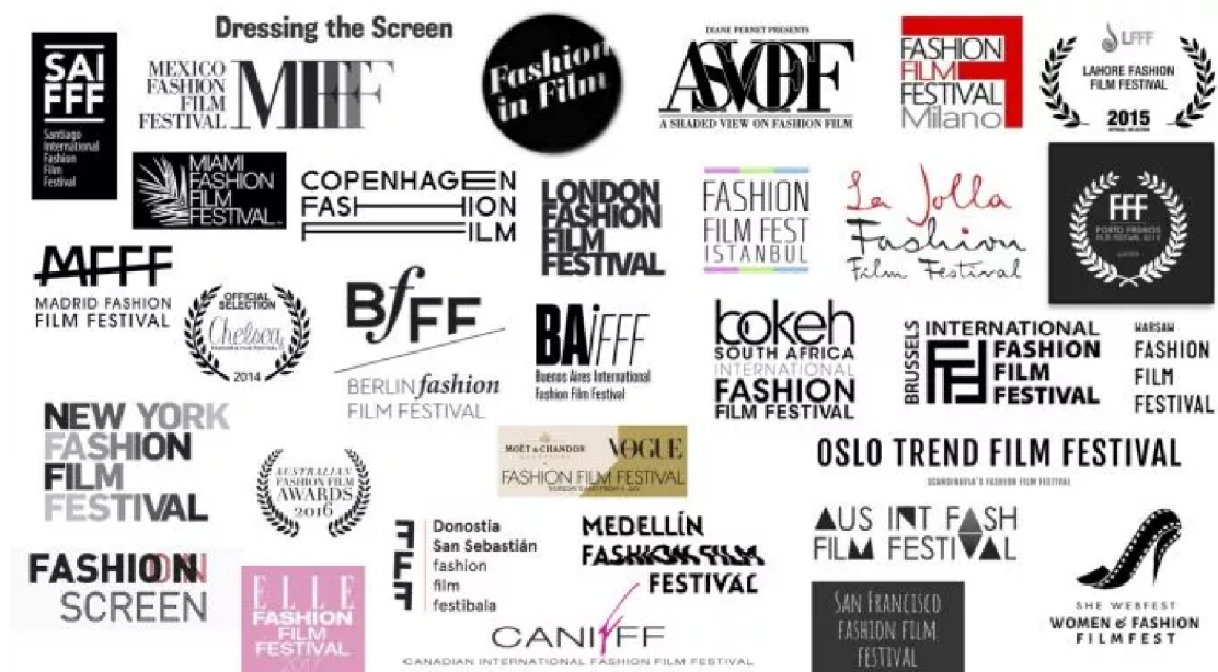
Obr. 6 – Fashion Film Festivals overview