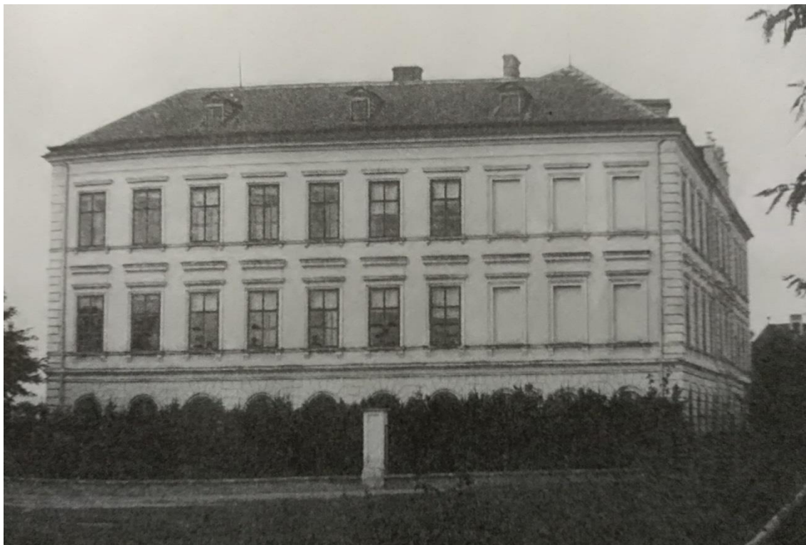
Fotografie: Budova Vyšší zemské reálky v Telči ke konci 19. století