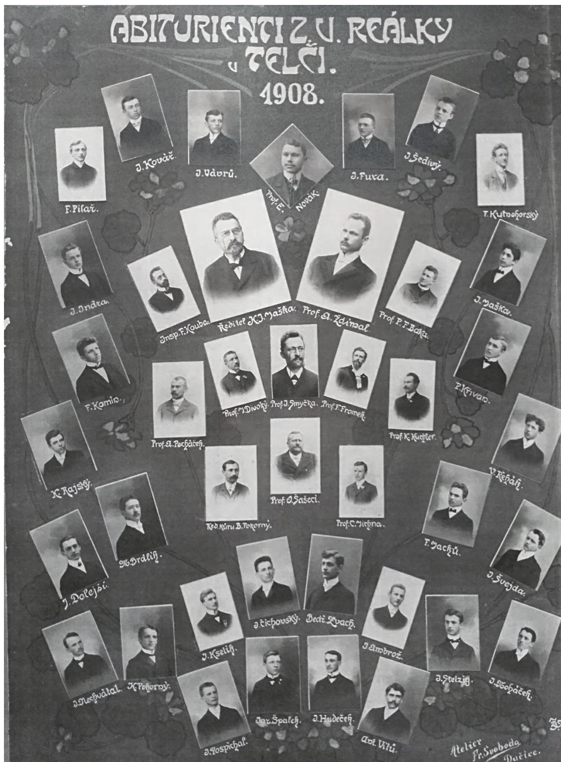
Fotografie: Ukázka tabla z roku 1908