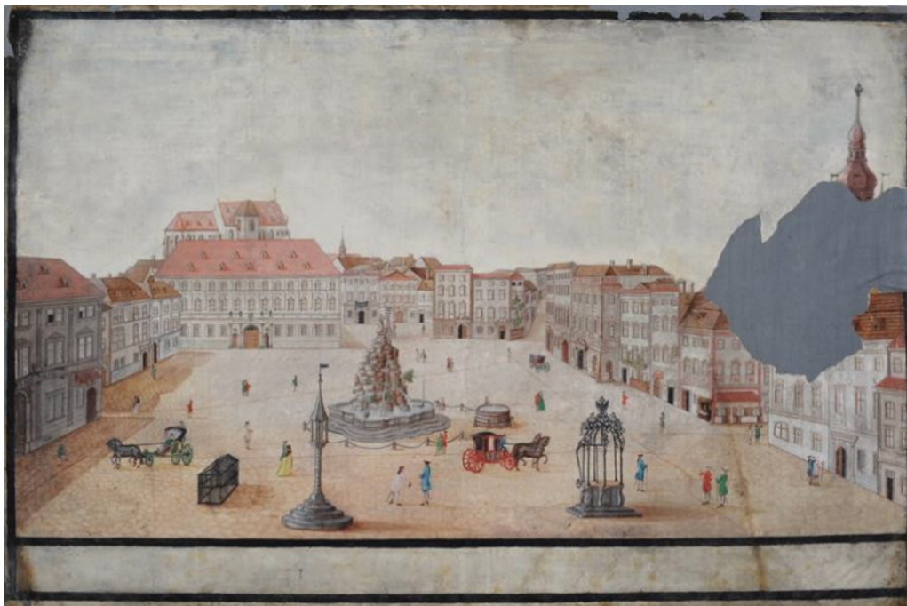
Obr. 1: Pohled na dnešní Zelný trh v Brně od Josefa Maserleho; ve spodní části kresby lze vidět klec určenou pro vystavování choromyslných.

Moravská galerie Brno, karton B 14565, bez signatury.