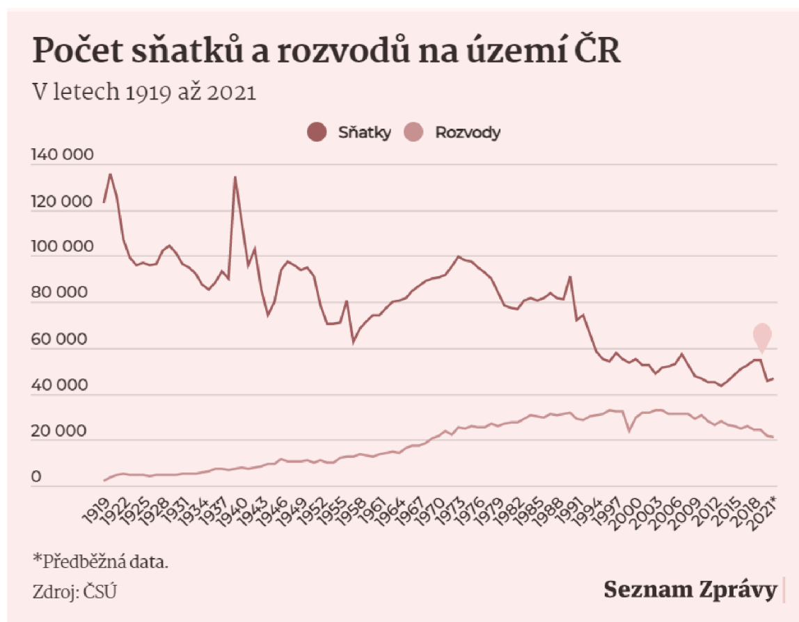
Graf č. 1 - Počet sňatků a rozvodů na území ČR v letech 1919–2021