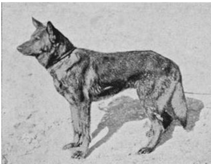
Horand von Grafrath