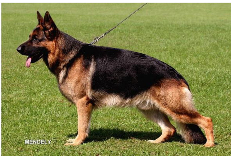
obrázek č. 2 Krátkosrstý standard NO (“Fédération Cynologique Internationale” n.d.)