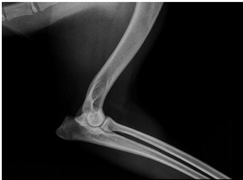
obrázek č. 11 RTG loketního kloubu (“RTG vyšetření DKK a DLK - Veterinární ordinace Slavičín” n.d.)

kteřá by znehodnotila výsledky Klinickým vyšetřením se zjistí bolestivost, zvýšená citlivost, ztuhlost, křeče a bolest v loketním kloubu a okolí (How 2016). V kloubu zasaženém dysplazií vzniká artróza, která se s věkem postupně zhoršuje a způsobuje permanentní bolest, což vyžaduje podávání analgetik (Cook & Cook 2009; How 2016).