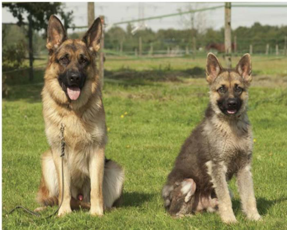
Obrázek č. 5 Dva stejně staří jedinci plemene německý ovčák ve věku 14. měsíců, vpravo trpící dwarfismem (Voorbij et al. 2011)

Objevuje se špatný stav srsti připomínající podobnost se srstí štěněte. Srst je řidší a méně hustá, někdy i kratší. Může být zaznamenáno i nadměrné vypadávání srsti (alopecie), které může být zapříčiněno hormonální nerovnováhou (Voorbij et al. 2011). Alopecie může být oboustranně symetrická a objevuje se i hyperpigmentace a infekce kůže (Kitzmann et al. 2021). Postižení jedinci mívají problémy s pohybem, které se projevují netypickou chůzí, bolestivostí a sníženou pohyblivostí kvůli abnormalitám kostí a kloubů, které vedou k jejich dalším poruchám. U psů samců může nedostatek gonadotropinů způsobit kryptorchismus. Feny mívají hárání bez ovulace (Voorbij & Kooistra 2009).