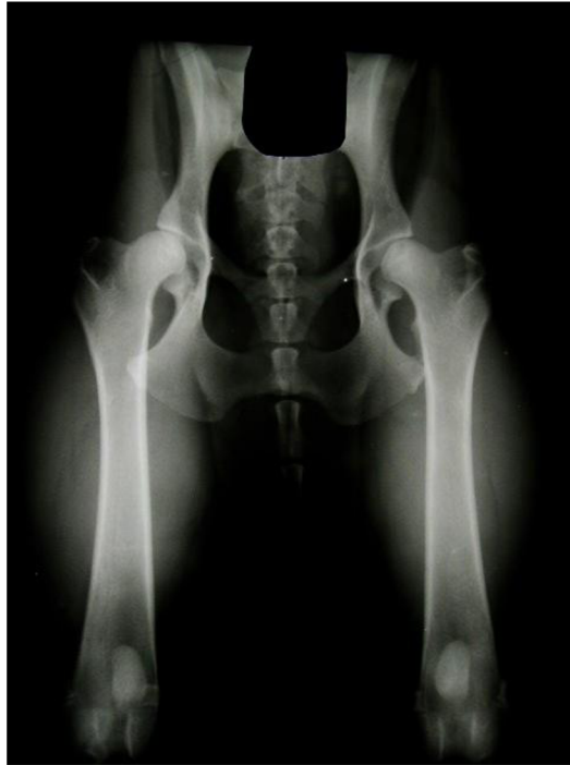
obrázek č. 8 RTG DKK 2 / 2 (C – lehký) (“Výsledky DKK, DLK | ARTAY OF HIGHLAND” n.d.)