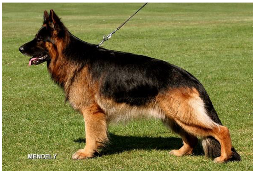
obrázek č. 3 Dlouhosrstý standard NO (“Fédération Cynologique Internationale” n.d.)