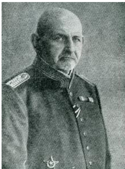
Max von Stephanitz