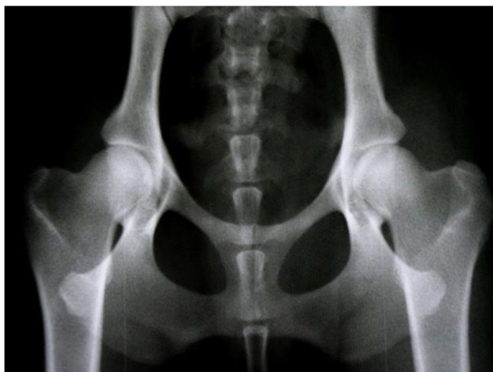
obrázek č. 6 RTG DKK 0 / 0 (A – negativní) (“Výsledky DKK, DLK | ARTAY OF HIGHLAND” n.d.)