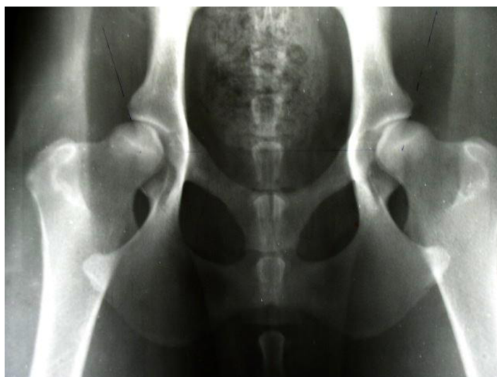
obrázek č. 7 RTG DKK 1 / 1 (B – hraniční) (“Výsledky DKK, DLK | ARTAY OF HIGHLAND” n.d.)