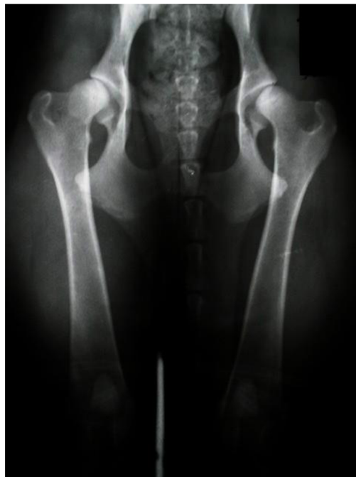
obrázek č. 9 RTG DKK 3 / 3 (D – střední) (“Výsledky DKK, DLK | ARTAY OF HIGHLAND” n.d.)