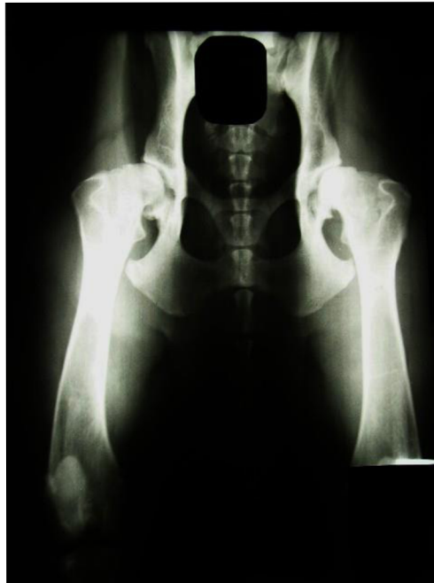
obrázek č. 10 RTG DKK 4/4 (E – těžký) (“Výsledky DKK, DLK | ARTAY OF HIGHLAND” n.d.)