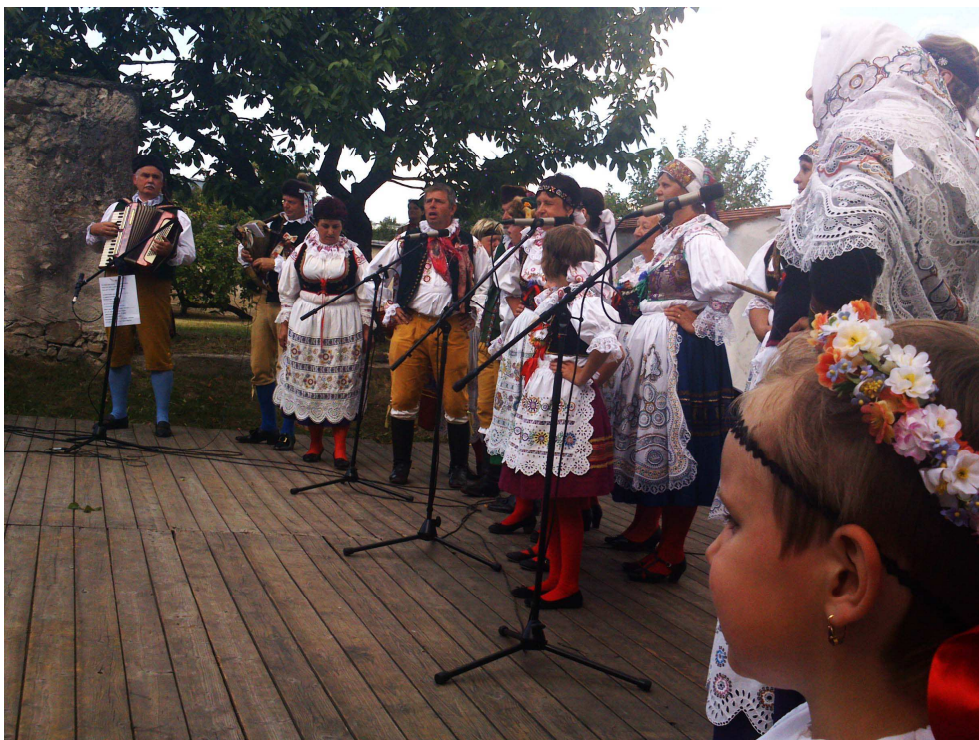
Obr. 7 Festival folklorních souborů v Jindřichově Hradci