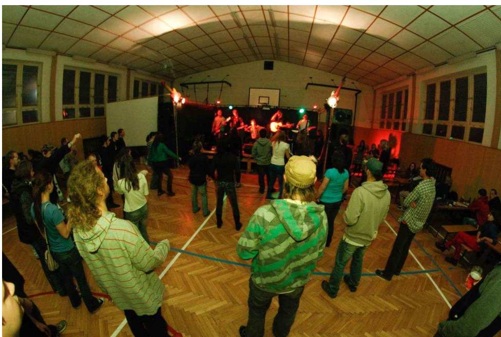
Obr. 14 Noc Rockových nadějí, 2011