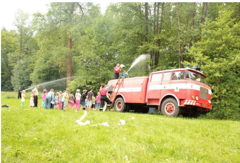
Obr. 3 Dětský den – pohádkový les v lomu, 2013