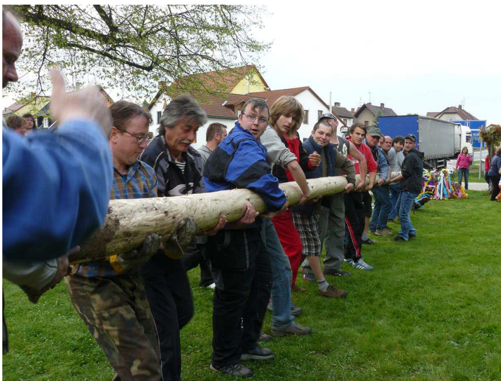
Obr. 13 Stavění májky, 2011