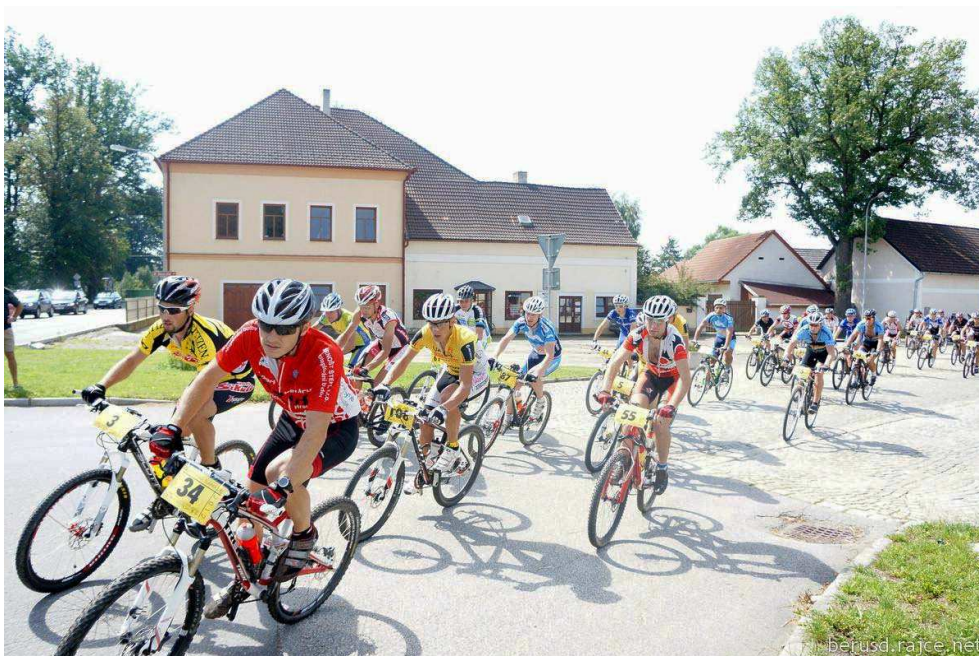
Obr. 12 Jarošovská šlapka, 2012