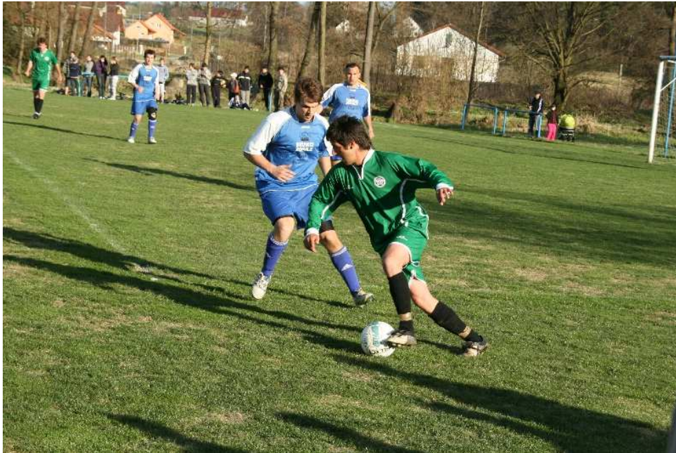
Obr. 9 Fotbalový zápas, 2011