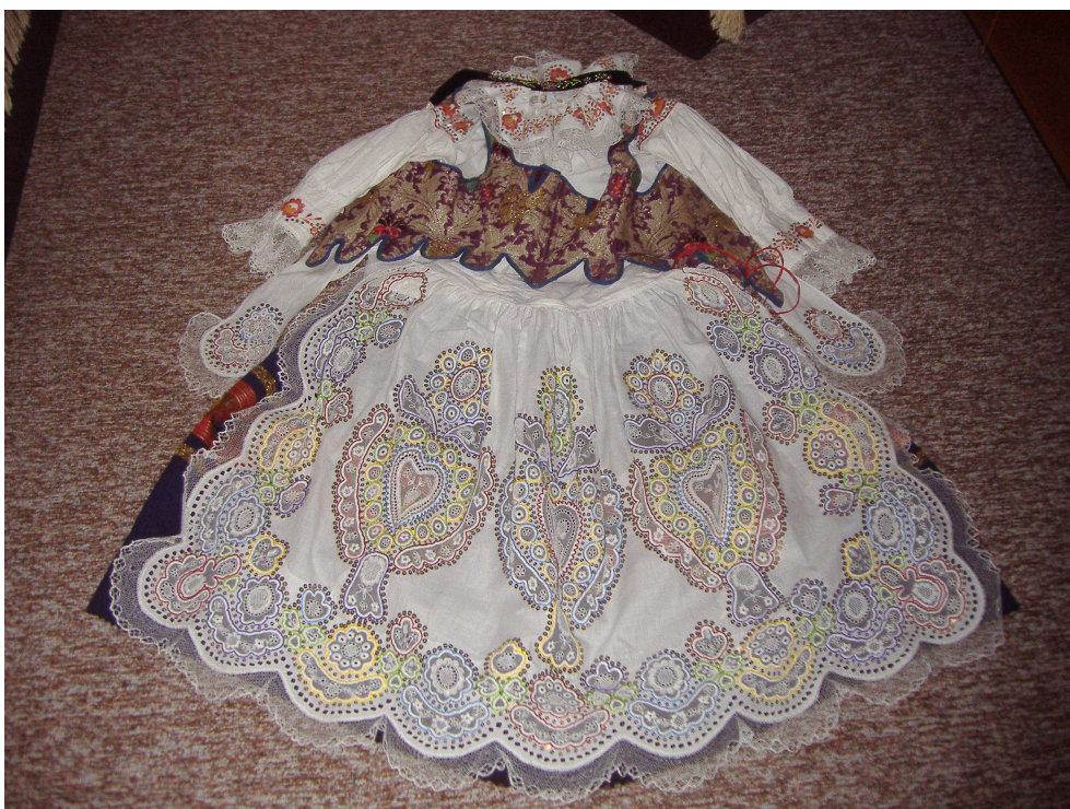
Obr. 8 Blatský kroj