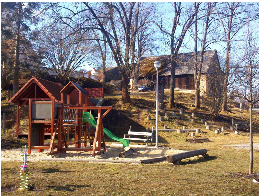
Obr. 5 Dětské hřiště