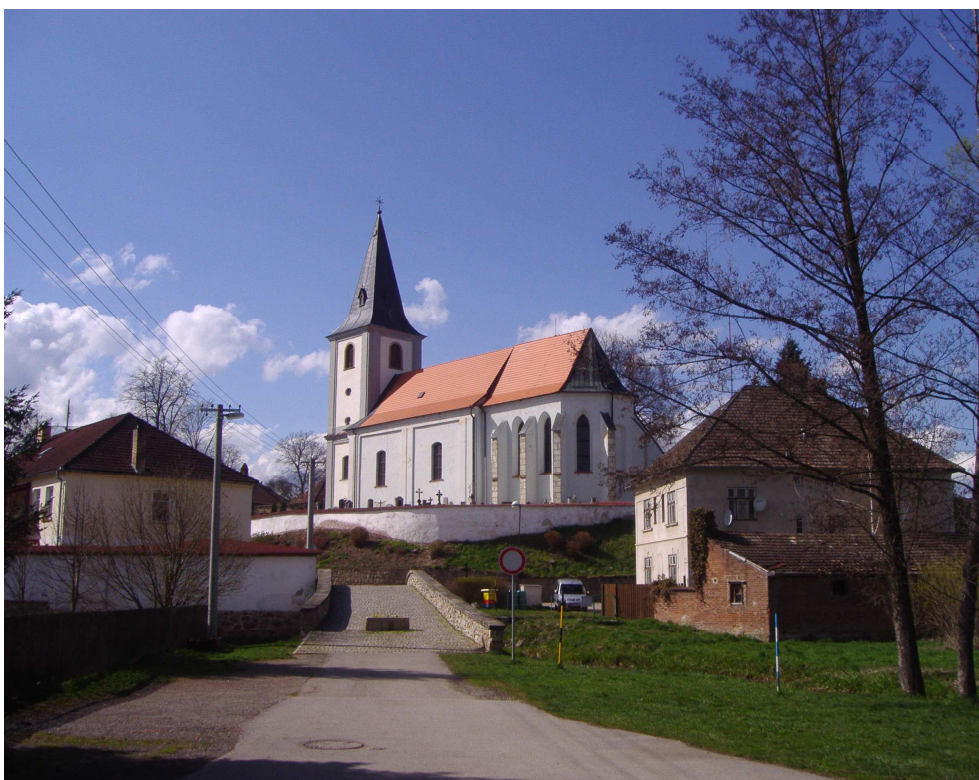
Obr. 1 Jarošov nad Nežárkou