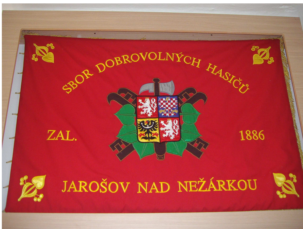
Obr. 2 Praporek SDH Jarošov nad Nežárkou