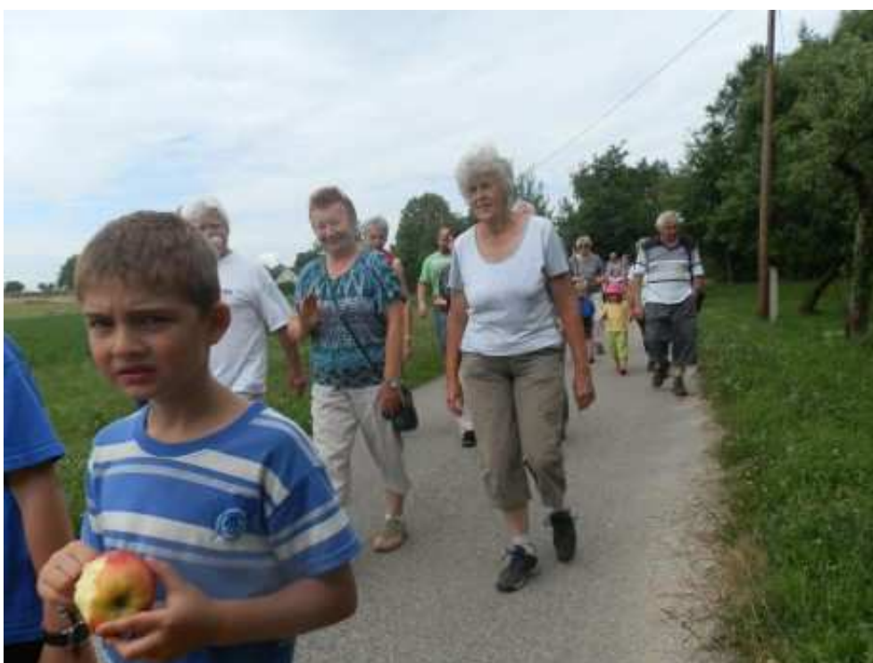
Obr. 4 Poutňová vycházka, 2013