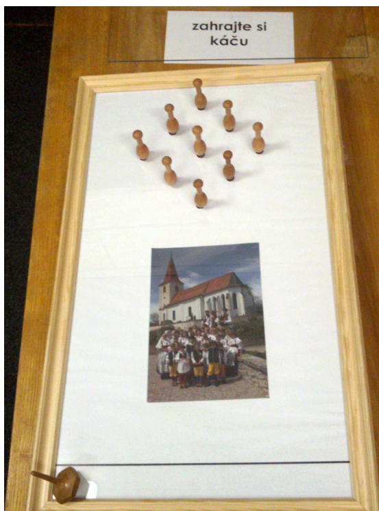
Obr. 11 Jarošovská Káča