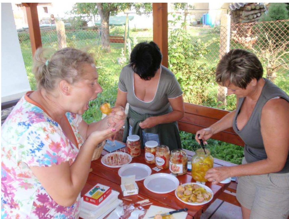
Obr. 6 Pořádná nakládačka, 2013