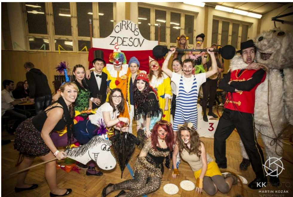
Obr. 10 Maškarní ples, 2014