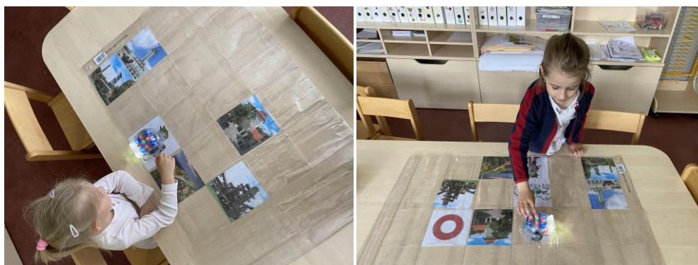
Obrázek 8 Praktické provedení aktivity č. 5

Varianta pro věkovou skupinu 5-6 let: Děti pracují s množinou nejméně pěti prvků.