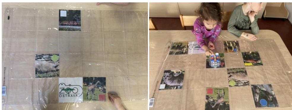
Obrázek 6 Praktické provedení aktivity č. 3

V této skupině děti pracují s nejméně pěti prvky a postupují od jednoho kritéria, přes dvě u pětiletých dětí až po tři kritéria u šestiletých dětí. Na pracovní podložku jsou také navíc vloženy tematické kartičky s překážkami.