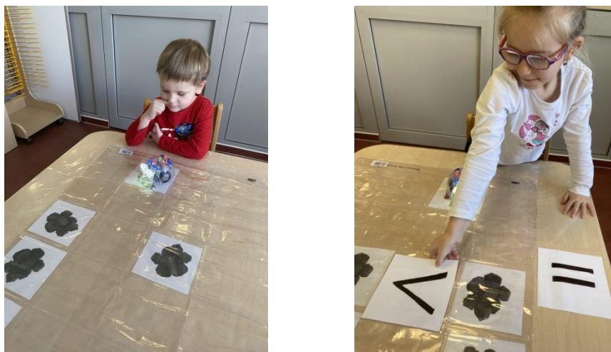
Obrázek 5 Praktické provedení aktivity č. 2

Děti pracují s množstvím prvků pět a více. Dětem jsou rovněž představeny symboly menší, větší, rovná se. Úkoly zadává nejprve pedagog. Následně jsou děti rozděleny do skupinek a procvičují porovnávání množství a určování vzájemných vztahů mezi nimi. Jedna skupina pracuje se včelkou, další skupiny pouze s kartičkami. Všechny skupiny se u včelky vystřídají. Pedagog kontroluje správnost práce se včelou i správnost výsledků v jednotlivých skupinách.