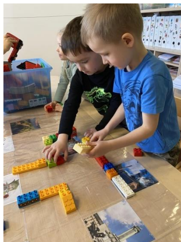
Obrázek 7 Praktické provedení aktivity č. 4