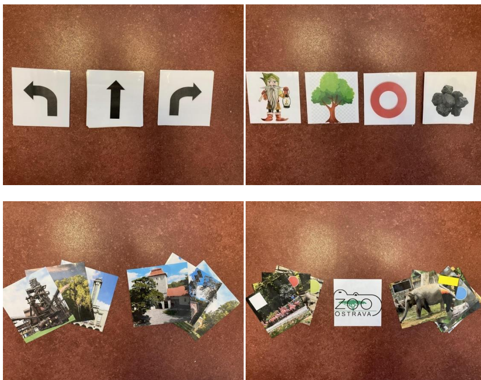
Obrázek 3 Tematické vkládací karty

Při práci s včelkou Bee-bot byla mimo jiné použita pracovní podložka s možností vkládání tematických karet, dále tematické vkládací karty vyrobené cíleně pro aktivity spjaté s daným výzkumem a stavebnice Lego Duplo.