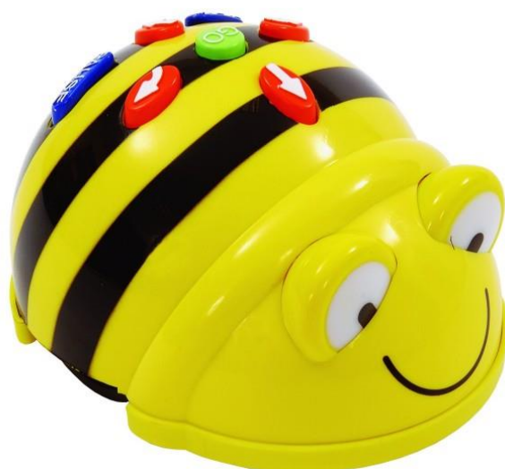
Obrázek 2 Včelka Bee-bot

Včelka Bee-bot je určena k pohybu po ploše. Proto je možno při práci s touto pomůckou využívat na trhu dostupné podložky. Lze si vybrat s tematických podložek nebo transparentních podložek se vkládacími kapsami pro tematické karty. Podložka je složená ze čtverců o velikosti 15x15 cm. Takováto podložka nejvíce připomíná svým vzhledem šachovnici, po které se včelka po krocích o délce 15 cm pohybuje dle předem naprogramovaných příkazů. (Kopecký, Szotkowski, 2018)