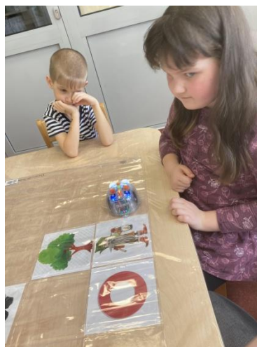
Obrázek 4 Praktické provedení aktivity č. 1