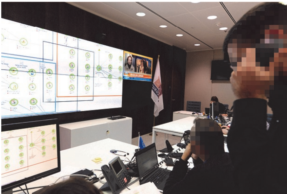
Obrázek 2: Pracoviště Eurojust na pozadí se vztahovou analýzou (grafické znázornění požadovaných vazeb)

Slovinsko reagovalo, že trestní řízení proti společnosti Neptun nevede a italská strana i přes opakované urgency nereagovala.