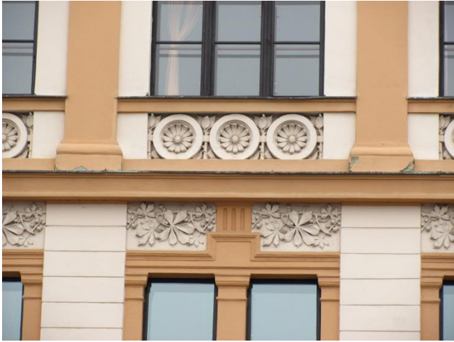
Rostlinné ornamenty na budově Gymnázia Polička.