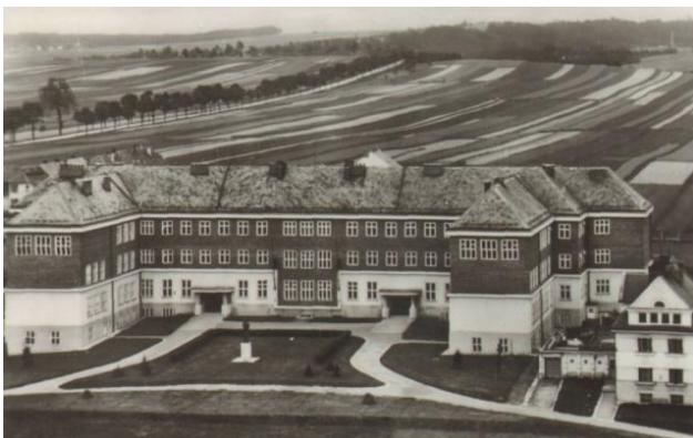
Budova Masarykovy školy.

Za zaslání digitálních verzí fotografií děkuji Centru Bohuslava Martinů v Poličce.