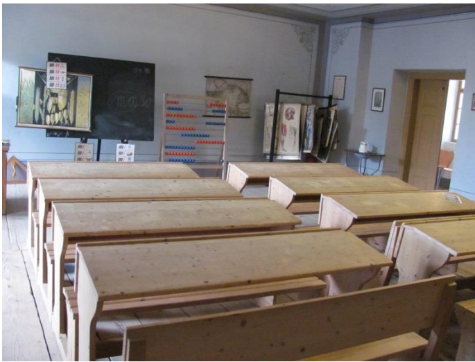
Expozice je doplněna o dobový materiál.