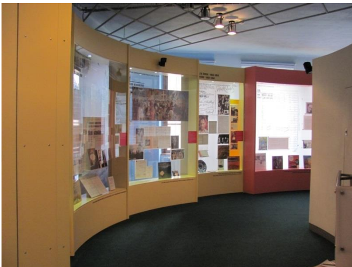
Expozice Barevný svět Bohuslava Martinů.