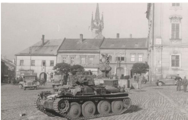
Tank na náměstí v Poličce.