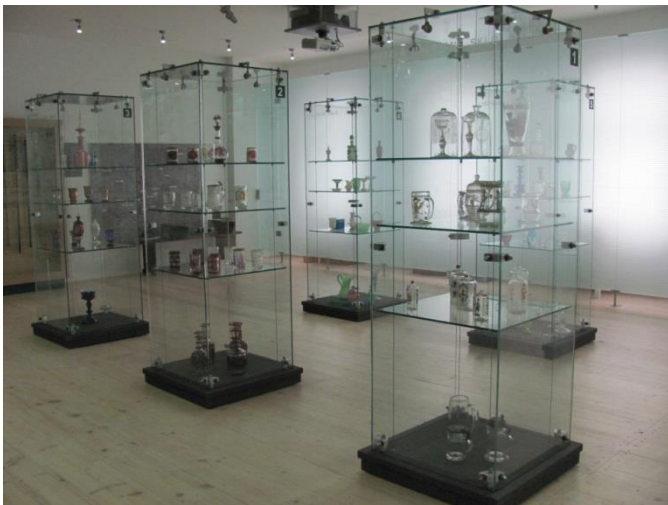
Expozice Sklářství na Horácku.