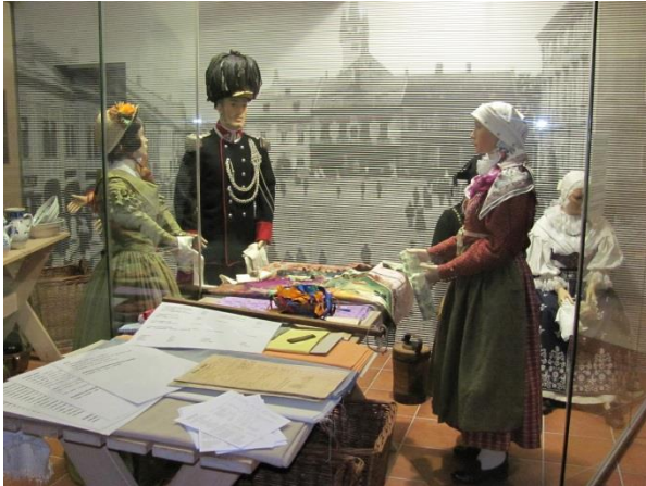
Ukázka trhu a krojů, které se na Poličsku nosily.