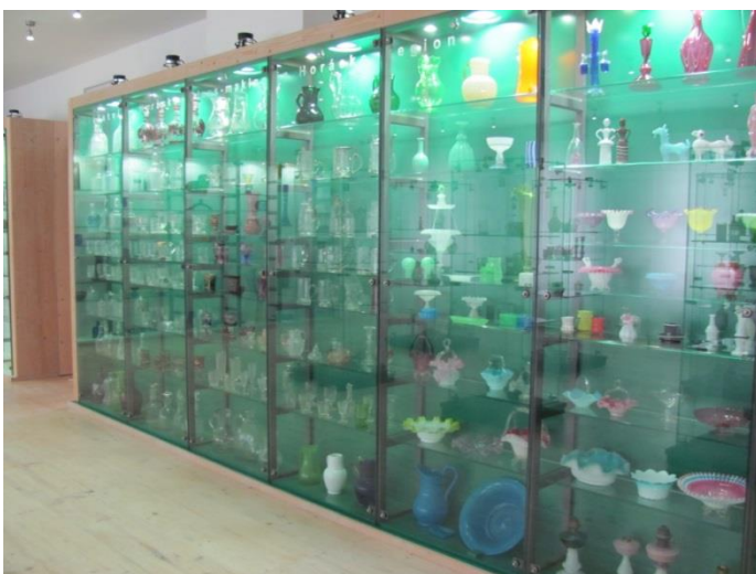
Vitrína podél zdi.