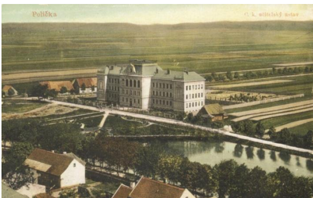
Budova dnešního Gymnázia Polička.