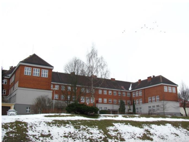
Budova Masarykovy školy.