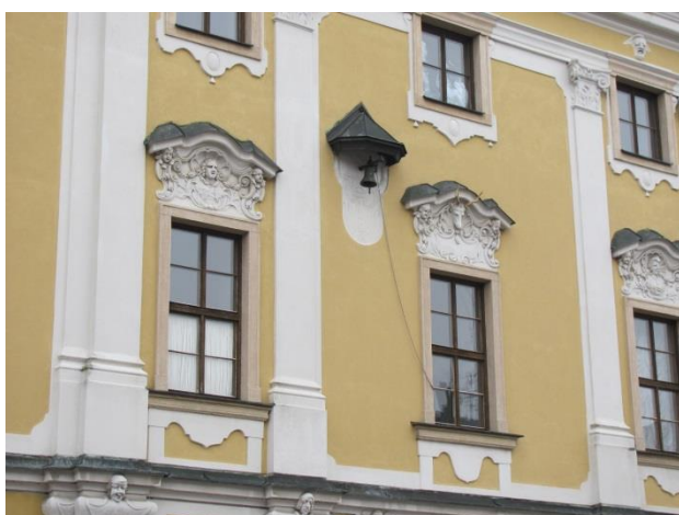
Hlava jelena a zvonek na radnici.