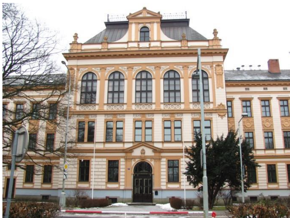
Budova Gymnázia Polička.