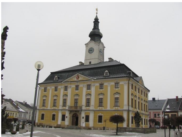
Budova radnice na náměstí v Poličce.