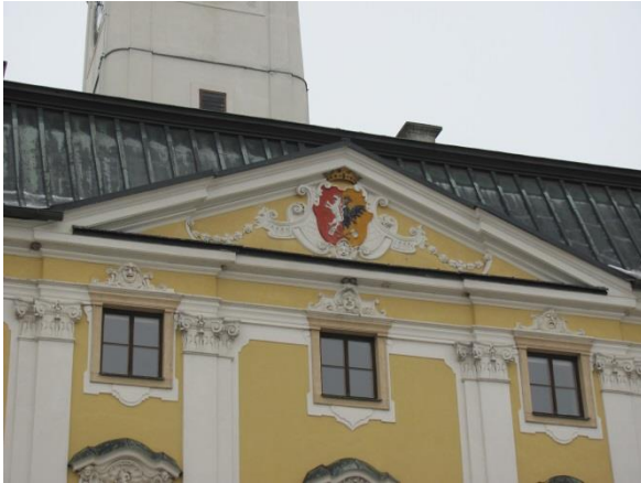
Znak města Poličky na radnici.