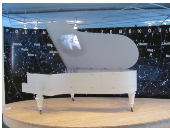
Maketa klavíru, na kterém jsou promítány dobové snímky s Bohuslavem Martinů.