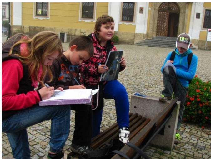
Žáci plní úkoly v Poličce u radnice.