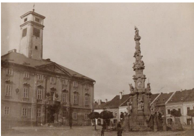
Náměstí v Poličce.