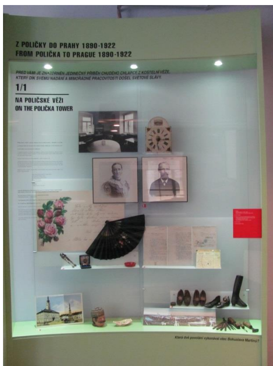
Ukázka jedné z vitrín