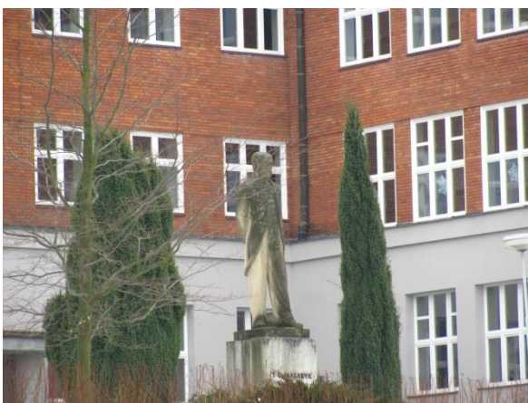
Socha T. G. M. u Masarykovy školy.