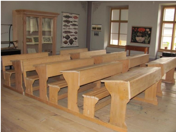
Historická třída Bohuslava Martinů.