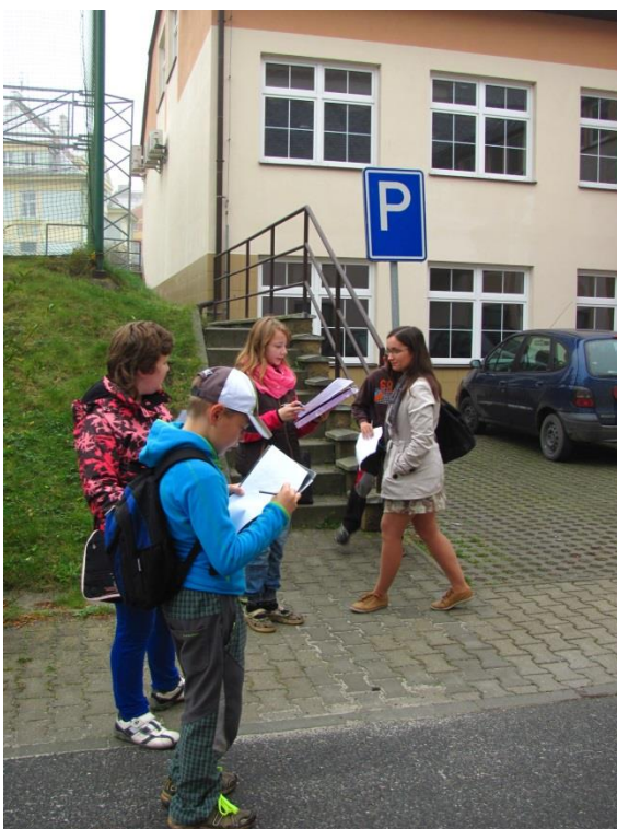
Žáci plní úkoly u budovy Gymnázia Polička.