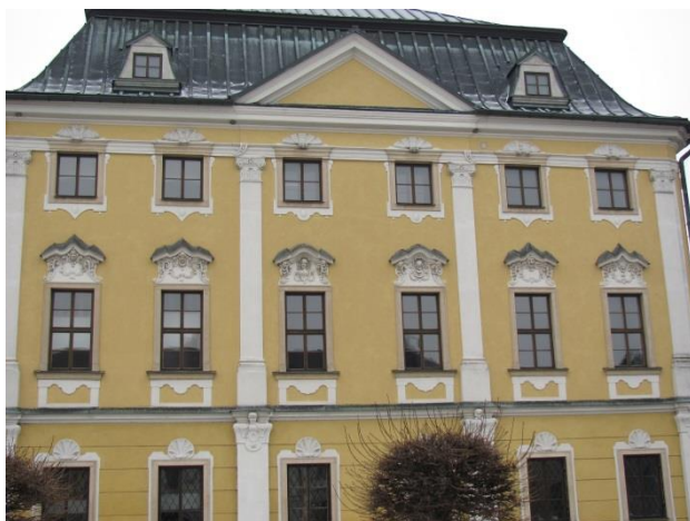
Busty soch nad okny radnice.