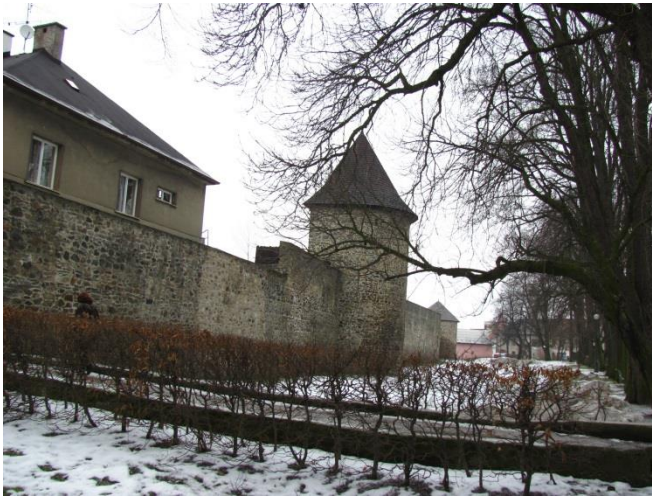
Opevnění města Poličky.