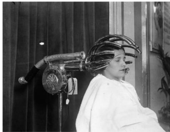
Secador de pelo de 1950

Las peluqueras en esta obra tienen el objetivo muy importante, funcionar como las “hadas” de la protagonista, ya que la están acompañando durante toda la trama atendiéndola siempre cuando despierta de sus sueños. Lo irónico aquí es que a Lupita la están obligando sus propios sueños a pensar en el miedo que le produce la boda y su función como mujer casada.