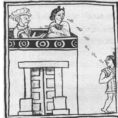
Códice florentino (Glantz; 2001; 35)

Como había de esperarse de la autora, Castellanos otra vez puso la prioridad en el personaje de la Malinche, a la cual ya había tratado antes en el poema homónimo “Malinche”. En este poema sembró Castellanos las raíces del personaje de la Malinche. Como dice Hernández en uno de sus textos, «No sorprende el intento de Castellanos de reivindicación de la figura de la Malinche» (Hernández N.; 1998; 34)