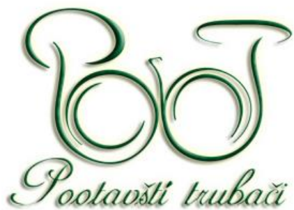
Příloha č. 3: Znak Klubu trubačů ČMMJ