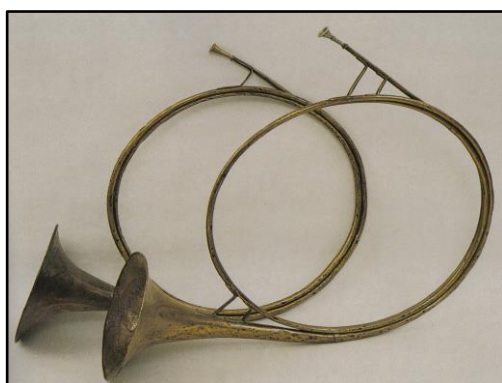
Obr. č. 1 – Lovecké rohy, Anton Kerner, Vídeň, 1769 a 1777 (Čížek, 2002)

V roce 1814 se na roh přidaly dva ventily, roku 1830 tři. Díky tomu bylo možné na nástroj zahrát všechny chromatické tóny. Popularita nástroje v 19. století velice vzrostla (v Haydnově a Mozartově době působili v orchestru dva hráči na lesní rohy, avšak Beethoven pro svou Symfonii č. 3 - Eroicu potřeboval lesní rohy tři). Kvarteto lesních rohů získalo své pevné místo v symfonickém orchestru až v romantismu (první a třetí roh jsou laděny vysoko, druhý a čtvrtý nízko). Toto rozdělení ladění se v symfonickém orchestru používá dodnes. 6