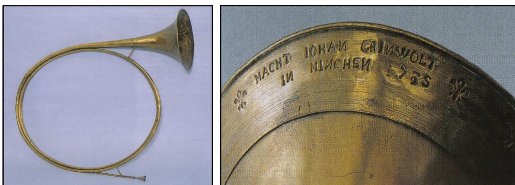
Obr. č. 2, 3 – Lovecký roh, Johann Grinwolt, Mnichov, 1735 (Čížek, 2002)

Lovecká hudba má své nezastupitelné místo v hudební praxi i v dnešní době a její produkování patří ke zvyklostem, které byly přežaty z minulých dob. Většina mysliveckých událostí (jako jsou například myslivecké zkoušky, výstavy, schůze, pasování na myslivce, poslední loučení s myslivcem) se bez troubení neobejde. 10