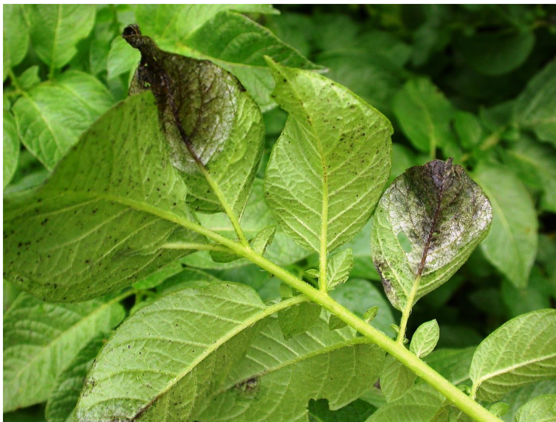
Obrázek 1: Plíseň bramboru na listech bramboru.

Podle ÚKZÚZ (2022a) se na rostlinách infikovaných primární nákazou z hlíz projevuje hnědnutím a odumíráním lístků, stonků i vzrostných vrcholů, přičemž systémově se infekce šíří po řapících. V případě sekundární infekce pozorujeme první příznaky ve spodních listových patrech a na špičkách mladých lístků, kde se nejvíce a nejdéle drží voda. V epidemické fázi se nákaza projevuje se žlutými rychle tmavnoucími skvrnami až do černých nekrotických a šíří po celé rostlině včetně stonků. Při vysoké vlhkosti v porostech se na rostlinách objevuje i šedobílý plísňový povlak (Obrázek 1), a to na spodní straně listů a na okrajích skvrn. Průměrná inkubační doba je jeden týden.