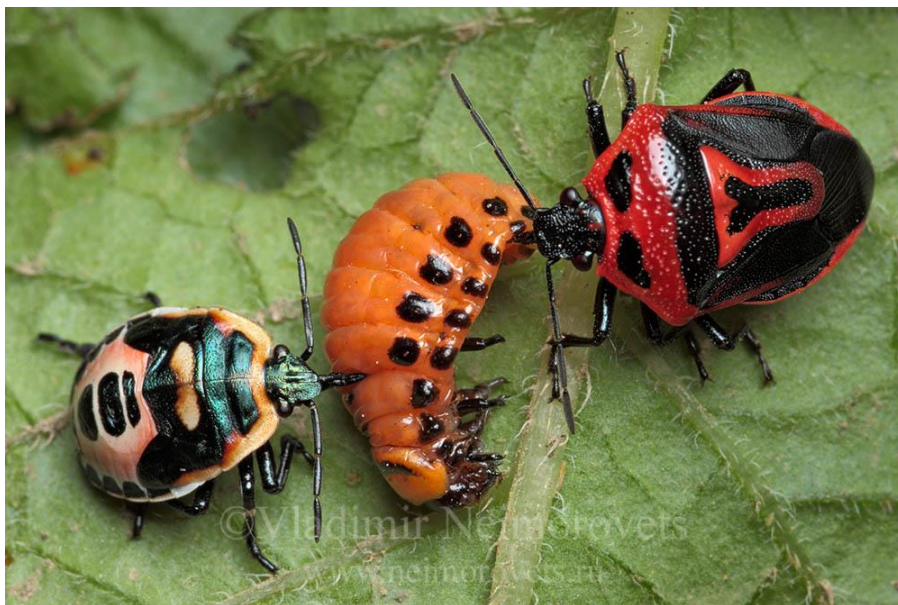
Obrázek 4: Perillus bioculatus likvidující larvu mandelinky bramborové

Tamaki a Butt (1978) uvádějí, že efektivita této ploštiny jako parazita se může jevit jako neefektivní, neboť „nikdy neplývají potravou“ a nenapadnou další kořist, dokud předešlou kompletně nevysají. Toto chování ovšem může být výhodné, pokud se nabízená potrava skládá spíše z vajíček nežli z larev – tedy na počátku sezóny, před vylíhnutím larev. Na rozdíl od mandibulárních predátorů, kteří vajíčka často pouze poškodí, což nemusí nutně zamezit dalšímu vývoji, likvidují ploštiny vajíčka celá (Hough-Goldstein et al. 1993).