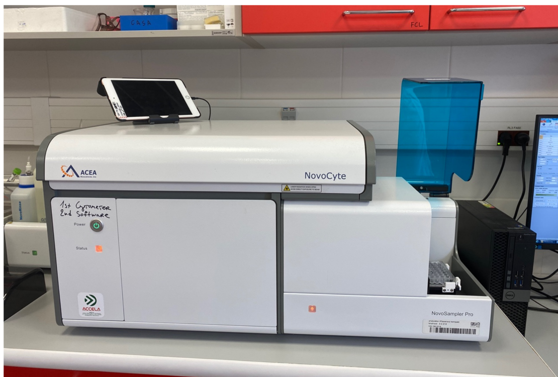
Obrázek 5: Průtokový cytometr (osobní archiv)

cytometru pro rutinní analýzu spermatu, jeho použití je často omezeno kvůli nákladům a obtížnému provozu. Je tudíž zapotřebí zkušený operátor. Kromě toho je průtokový cytometr poměrně velký a nemůže být vystaven třesům spojeným s pohybem, což znamená, že vyžaduje vyhrazené místo v laboratoři (Gillan et al. 2005).