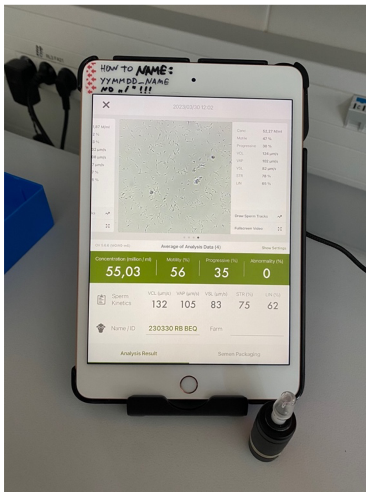
Obrázek 4: Analýza CASA