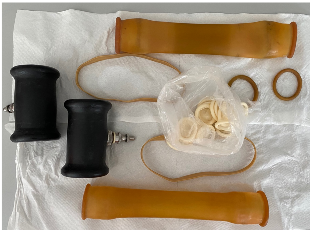
Obrázek 2: Umělá vagína