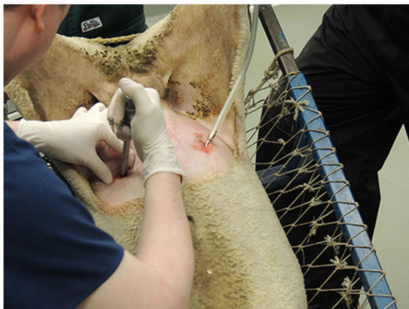
Obrázek 6: Laparoskopická inseminace (Sathe 2018)