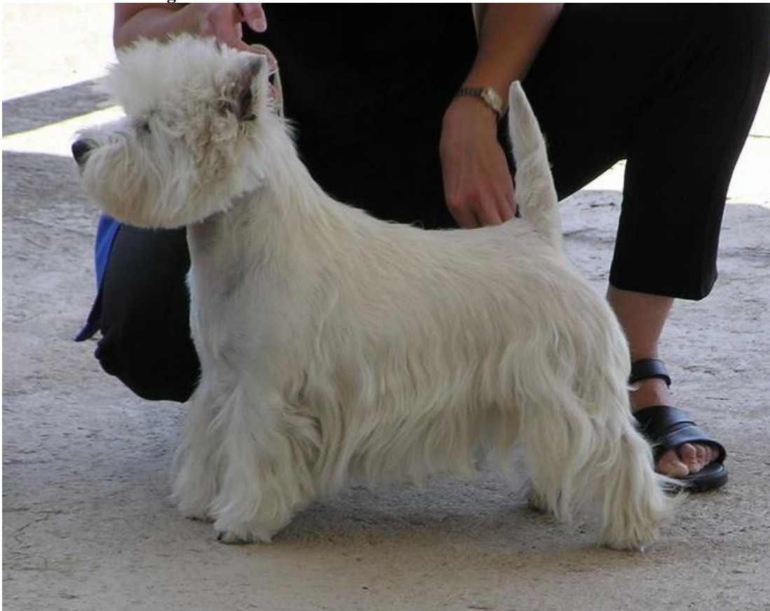
Obrázek 3 - West Highland White Teriér