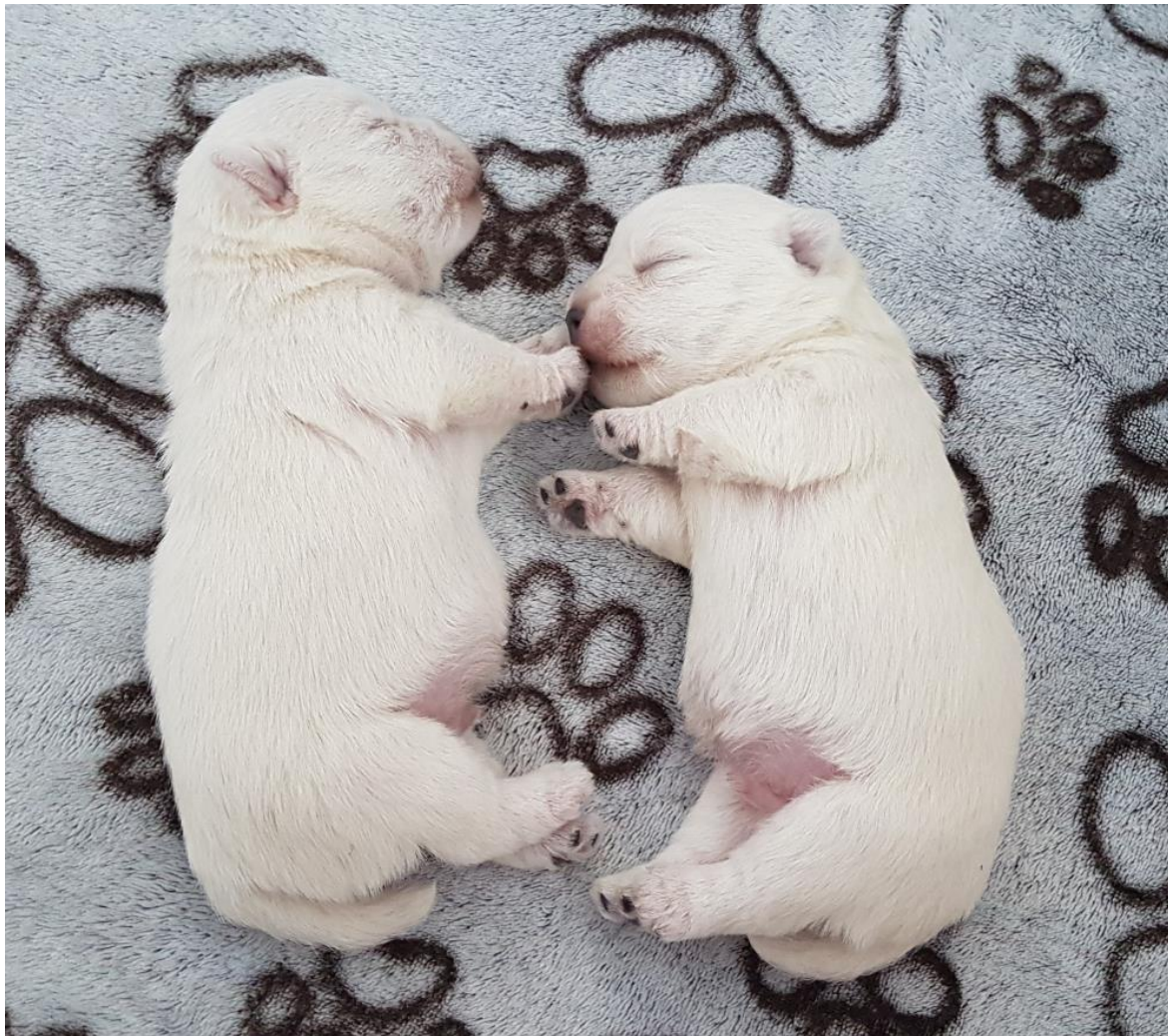
Obrázek 7 - malá štěňata Westů