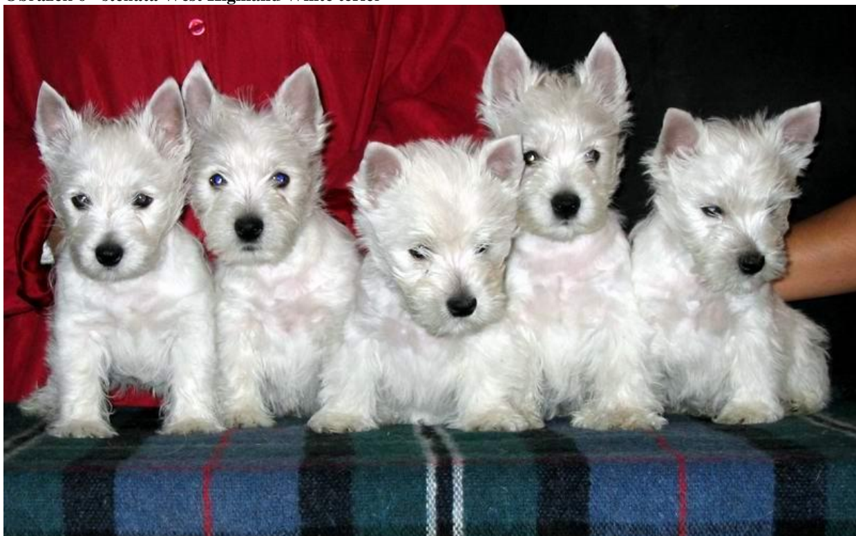
Obrázek 6 - štěňata West Highland White teriér