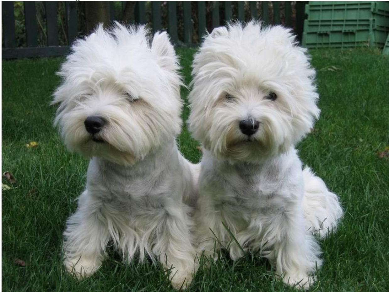
Obrázek 5 - West Highland White teriér