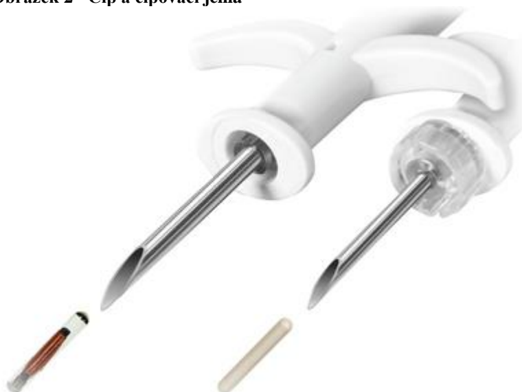
Obrázek 2 - Čip a čipovací jehla