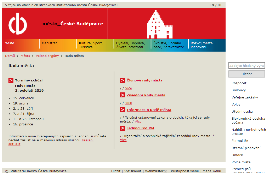
Obrázek č. 2 – informace o Radě města – České Budějovice