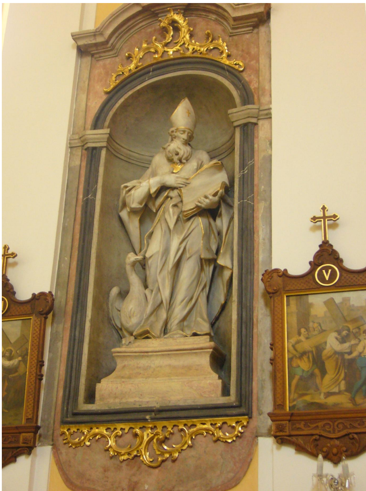
14. Kostel sv. Jakuba Většího v Kostelci na Hané socha sv. Martina.