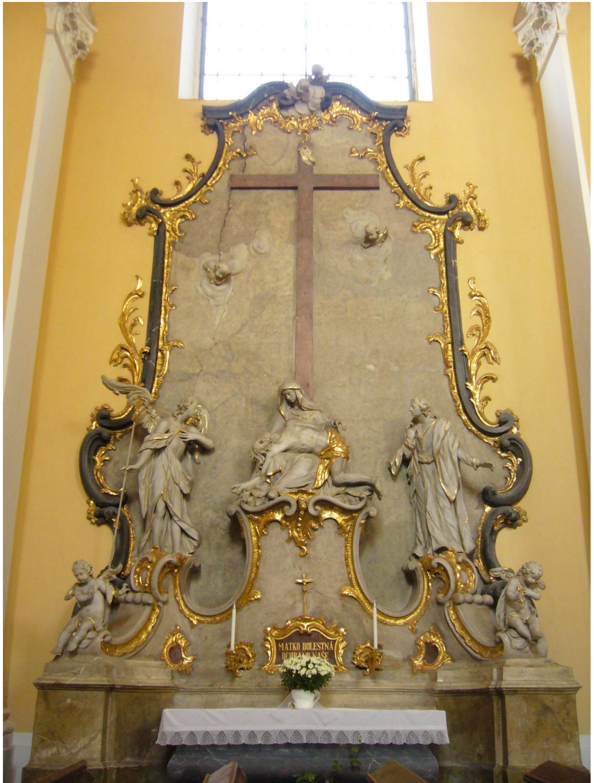
6. Kostel sv. Jakuba Většího v Kostelci na Hané, oltář Bolestné Panny Marie.