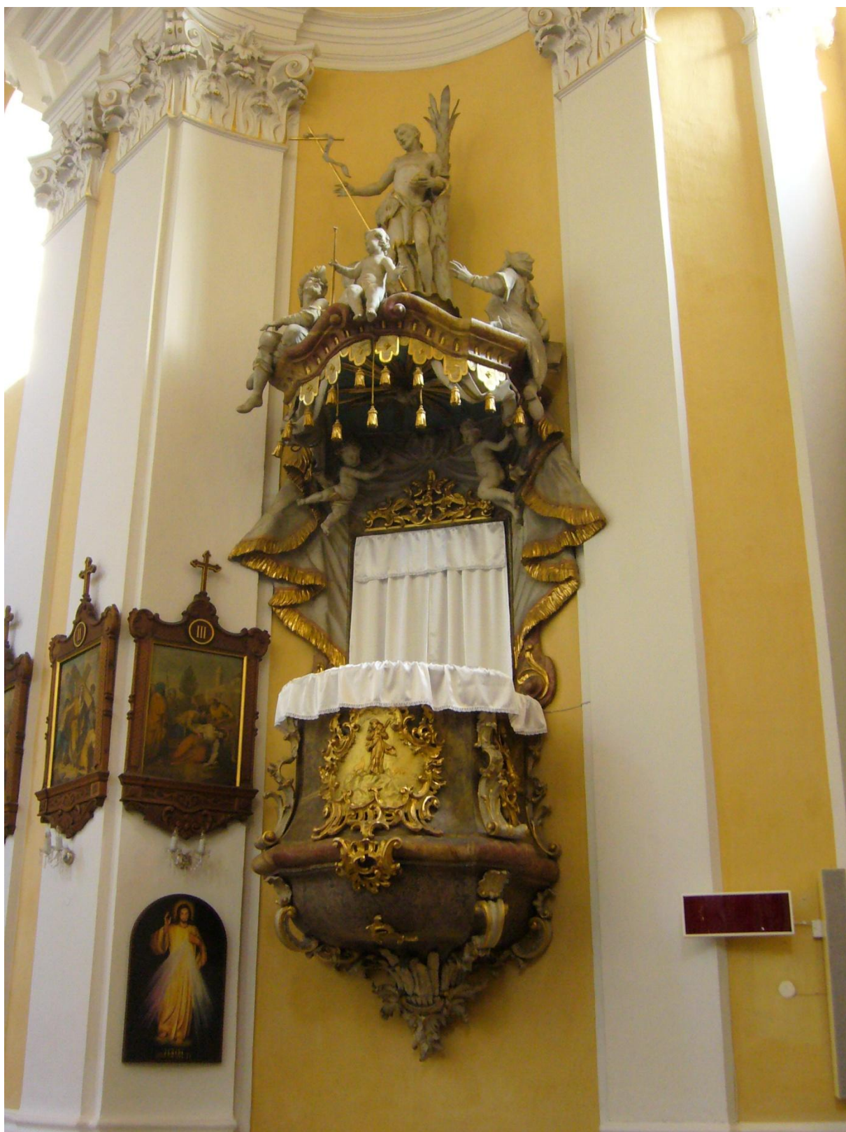
12. Kostel sv. Jakuba Většího v Kostelci na Hané, kazatelna.