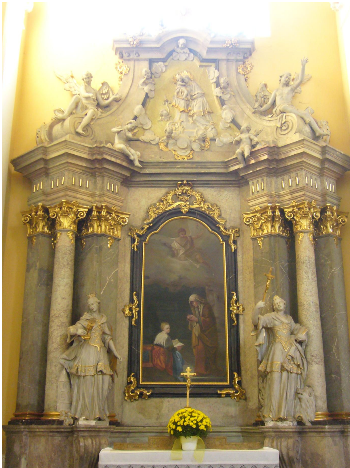
13. Kostel sv. Jakuba Většího v Kostelci na Hané, oltář sv. Anny.