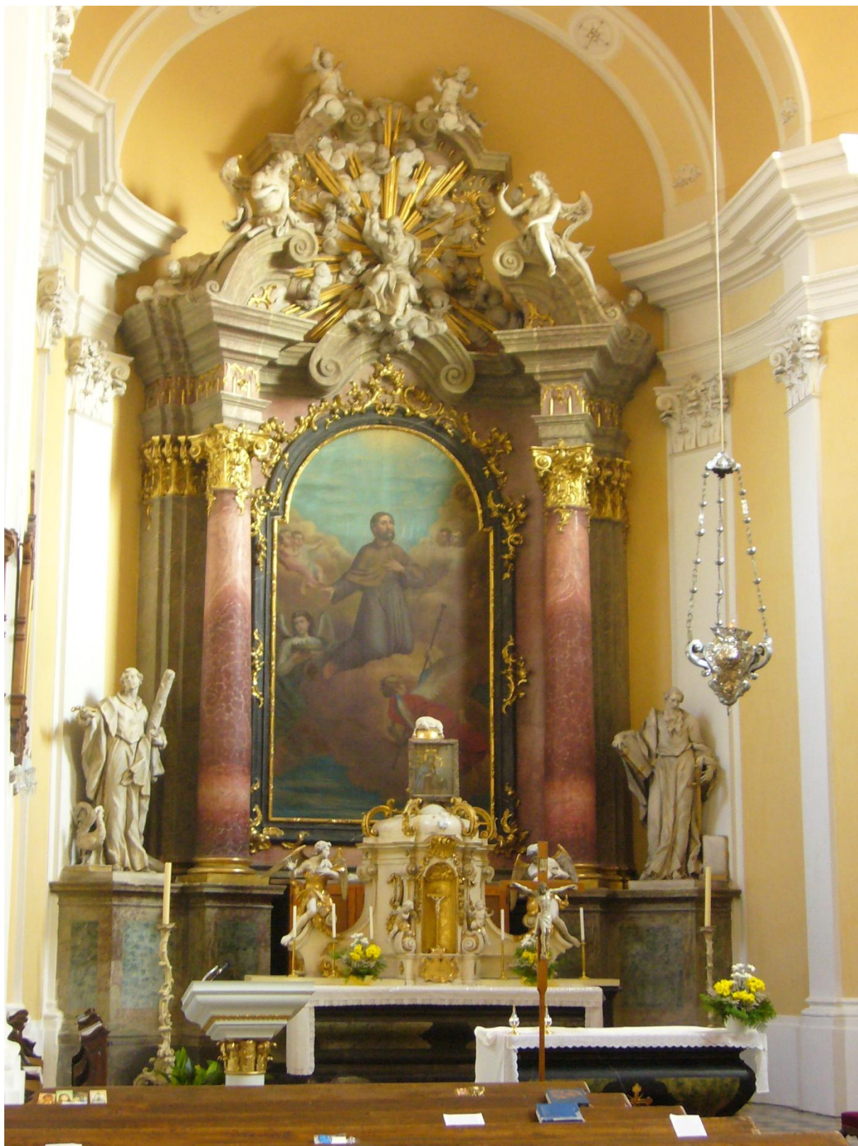
11. Kostel sv. Jakuba Většího v Kostelci na Hané, hl. oltář.