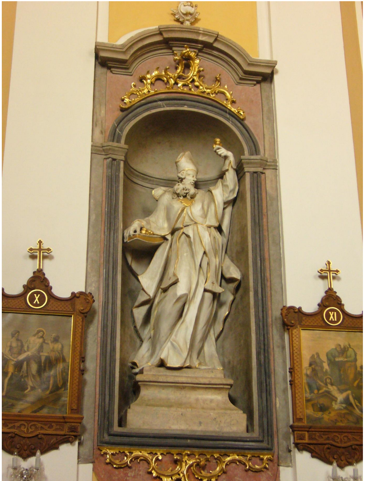
7. Kostel sv. Jakuba Většího v Kostelci na Hané, socha sv. Mikuláše.