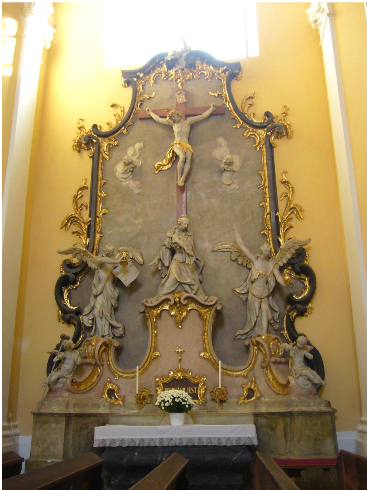
15. Kostel sv. Jakuba Většího v Kostelci na Hané, oltář sv. Kříže.