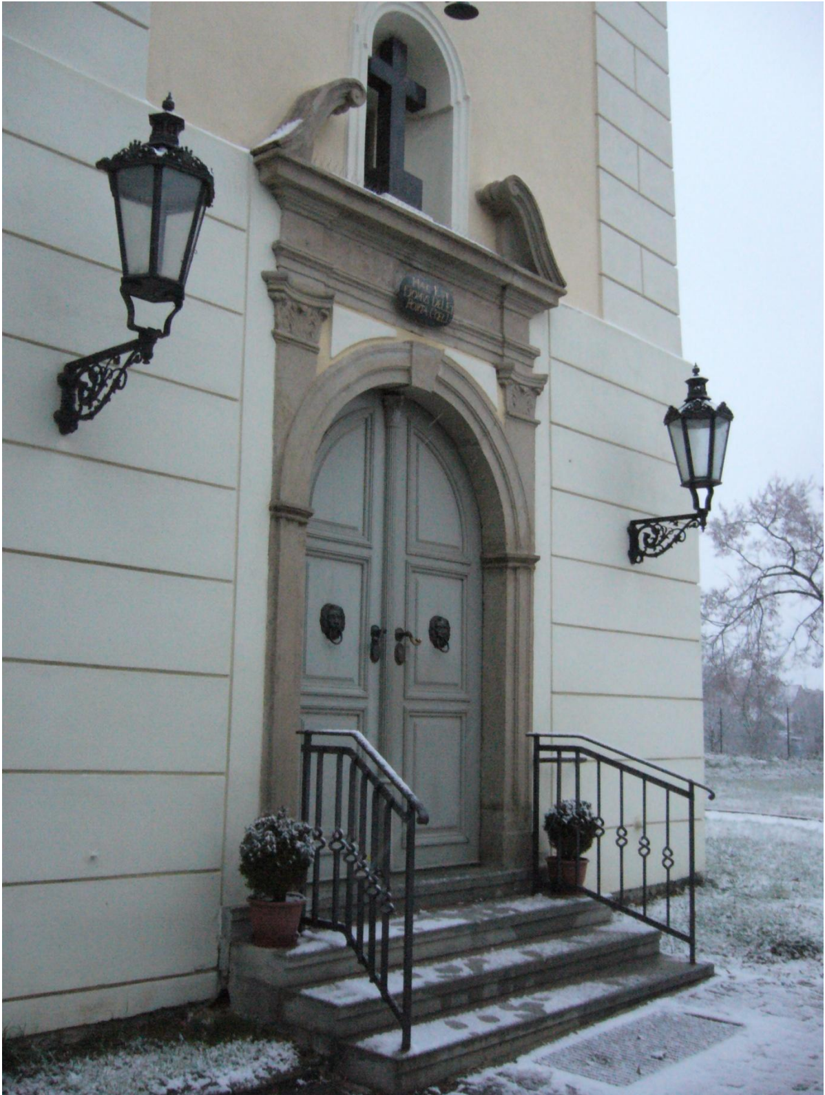
3. Kostel sv. Jakuba Většího v Kostelci na Hané, vstup do kostela.