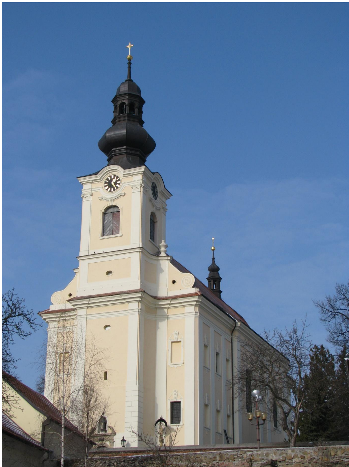
1. Kostel sv. Jakuba Většího v Kostelci na Hané, pohled z jiho-východní strany.