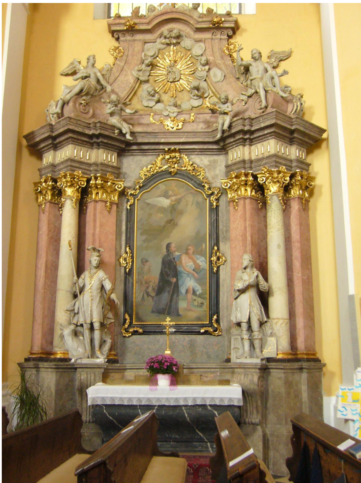
8. Kostel sv. Jakuba Většího v Kostelci na Hané, oltář sv. Jana Nepomuckého.