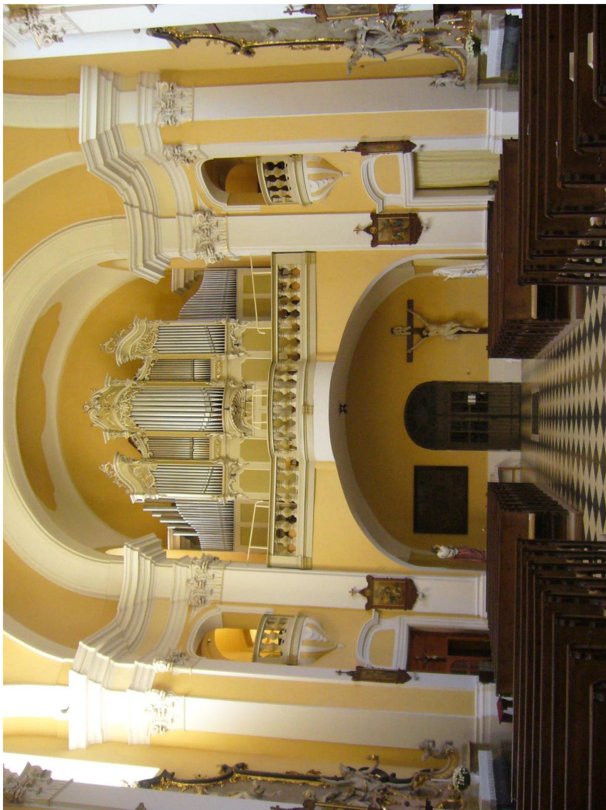
4. Kostel sv. Jakuba Většího v Kostelci na Hané, kruchta s varhanami.