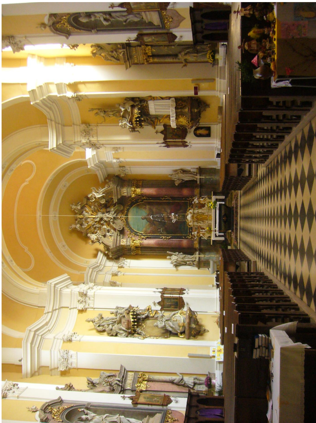
5. Kostel sv. Jakuba Většího v Kostelci na Hané, pohled do lodi s hl. oltářem.