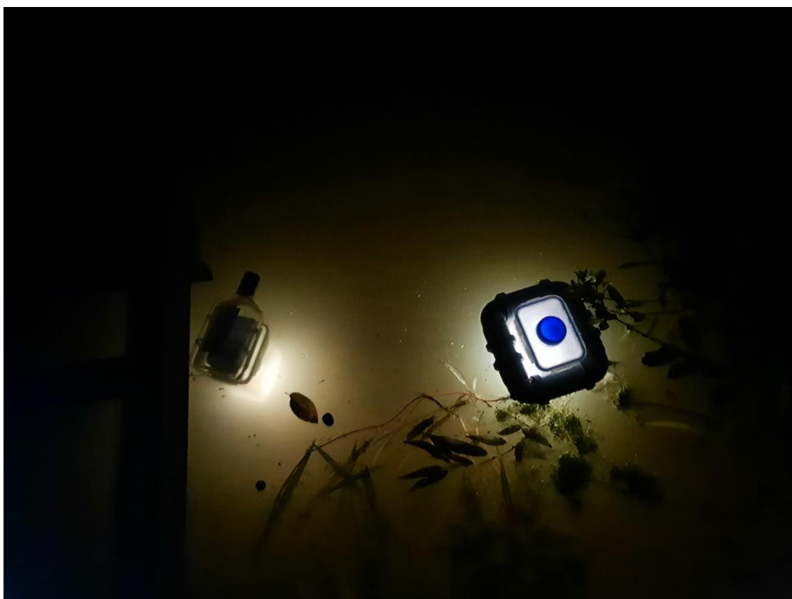
Obr. 7. Obě pasti (původní typ vlevo, nová modifikace vpravo) krátce po instalaci v pobřežní části Černodubského rybníka

K instalaci pastí došlo ve večerních hodinách při soumraku (obr. 7). Pasti byly ponechány ve vodě po celou noc až do doby jejího vyzvednutí následující den ráno krátce po svítání (obr. 8). Pro srovnání bylo provedeno nastražení pasti upravené pro živolovné použití, tak i pasti původní odzkoušené konstrukce. V obou pastech byl zachycen hojný počet jedinců cílové skupiny vodního hmyzu. Po vyjmutí obou pastí z vody došlo jen k vizuální kontrole obou zachycených vzorků a jejich přibližnému porovnání. Následně byl obsah z obou sběrných nádob vrácen zpět do vody.