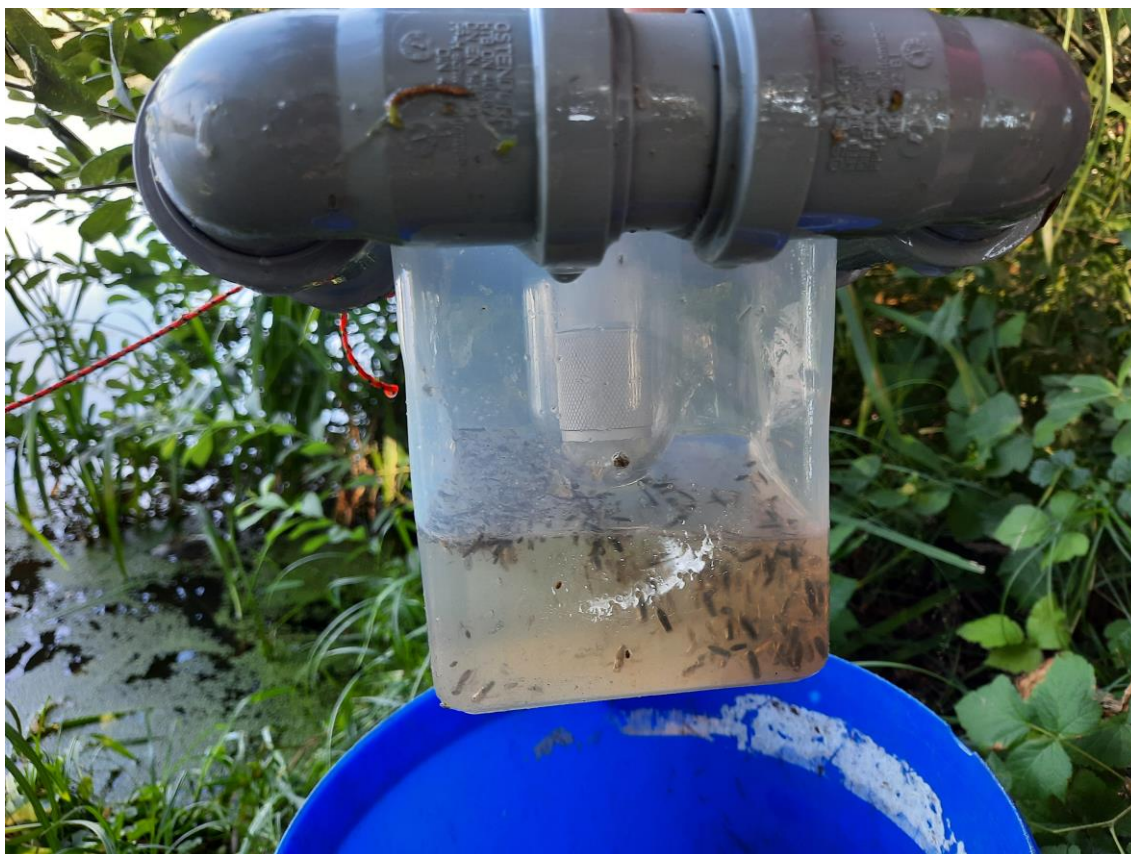
Obr. 8. Past modifikované konstrukce následující den ráno, krátce po vytažení z vody, s velkým množstvím zachycených jedinců.