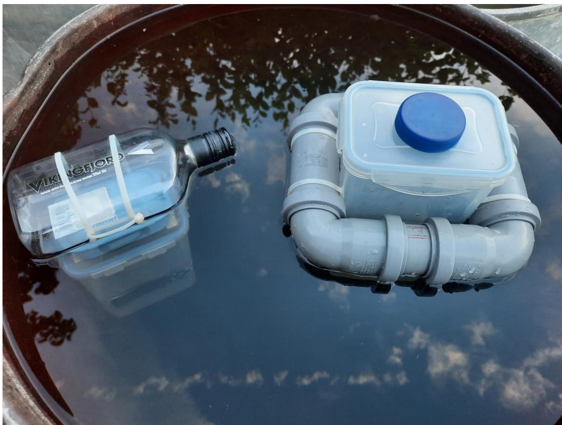
Obr. 6. Původní past (vlevo) a nová konstrukce (vpravo) s definovaným počtem jedinců klešťanek ( Sigara sp. ) v experimentu ověřujícím živolovné použití nové konstrukce.