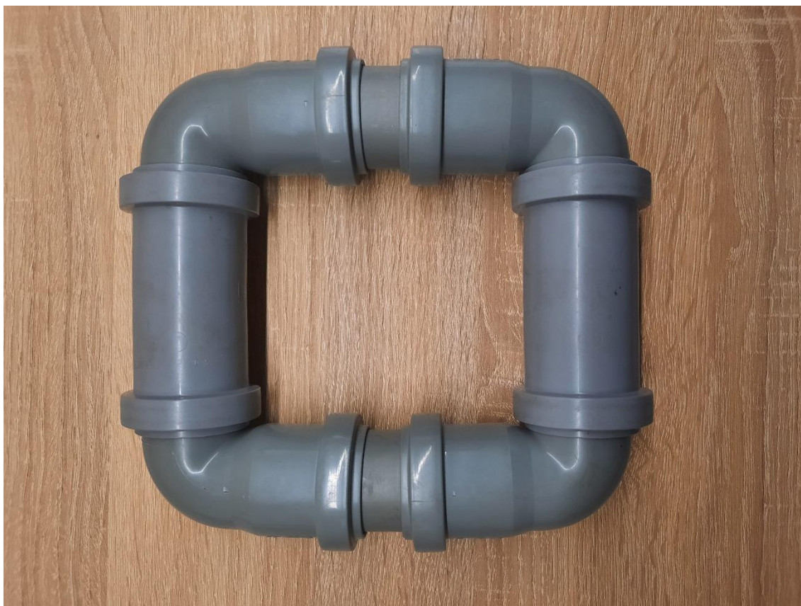
Obr. 3. Plovák ve složeném stavu

komponenty následně stačí jen mírným tlakem pospojovat (obr. 3). Není k tomu nutné žádné nářadí ani další pomůcky. V každém hrdle se nachází pružná gumová manžeta, která bezpečně utěsní všechny spoje a celá sestava je tím pádem vodotěsná a plave na hladině. V případě nefunkčního nebo chybějícího těsnění by bylo možné poskládaný celek nafoukat např. montážní pěnou. Tím by se do konstrukce nedostala voda, ale snížila by se možnost opětovného rozebrání. Připevnění sestaveného plováku na sběrnou nádobu se provádí jen nasazením od dna kontejneru směrem k víku. Díky konickému tvaru tvoří sběrná nádoba klín, který je po naplnění vodou tlačěn směrem dolů proti plováku, který má tendenci směřovat vzhůru. Tímto způsobem jsou k sobě oba díly pevně spojeny. Díky stabilitě plováku nedošlo k převrácení konstrukce ani ve větru nebo v důsledku vln.