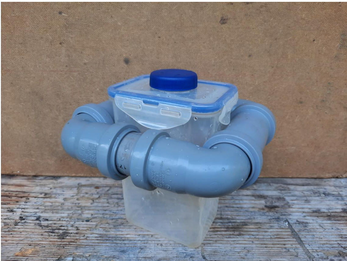
Obr. 5. Celkový pohled na kompletně sestavenou past bez závaží, původně umístěných ve víku.

Způsob instalace světelného zdroje i zdroj samotný zůstaly stejné jako u původní pasti. Během experimentů, které se uskutečnily na veřejně přístupném rybníce, byl k pasti připevněn provázek pro ukotvení pasti k pevnému předmětu na břehu. Na horním dílu konstrukce byla přilepena zpráva upozorňující na probíhající experiment a kontaktní údaje.