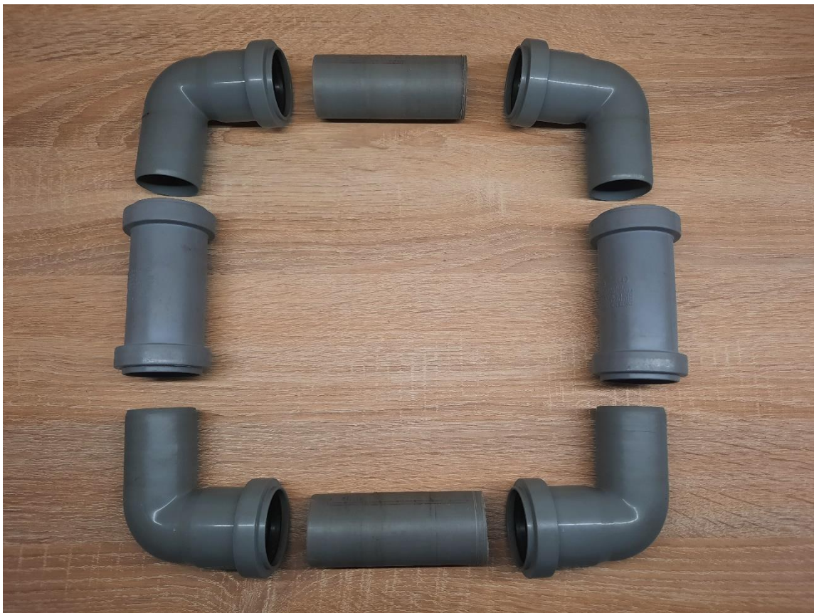
Obr. 2. Části plováku v rozloženém stavu

Materiál, který se osvědčil nejlépe a byl nakonec použit i ve finálním ověření funkčnosti pasti byl Polypropylen (PP). Přesněji z něj vyrobené plastové odpadní potrubí (obr. 2) s označením HT (systém pro domovní instalaci) (Horníková, 2017). Jedná se o pevný, stálý výrobek, který se po nahřátí velice snadno tvaruje a po vychladnutí zůstává v požadovaném tvaru. Přitom u něj nehrozí nechtěné deformace např. v důsledku přímého slunečního záření. Materiál je odolný proti běžnému mechanickému poškození a je cenově dostupný. Navíc se vyrábí v různých provedeních a je běžně dostupný v prodejnách s vodoinstalačním materiálem. Vzhledem k velikosti sběrné nádoby měl použitý typ potrubí průměr 40 mm (DN 40).