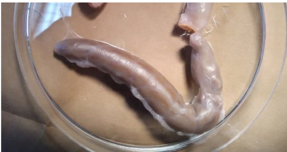
Obr. 2 Slepé střevo slepice