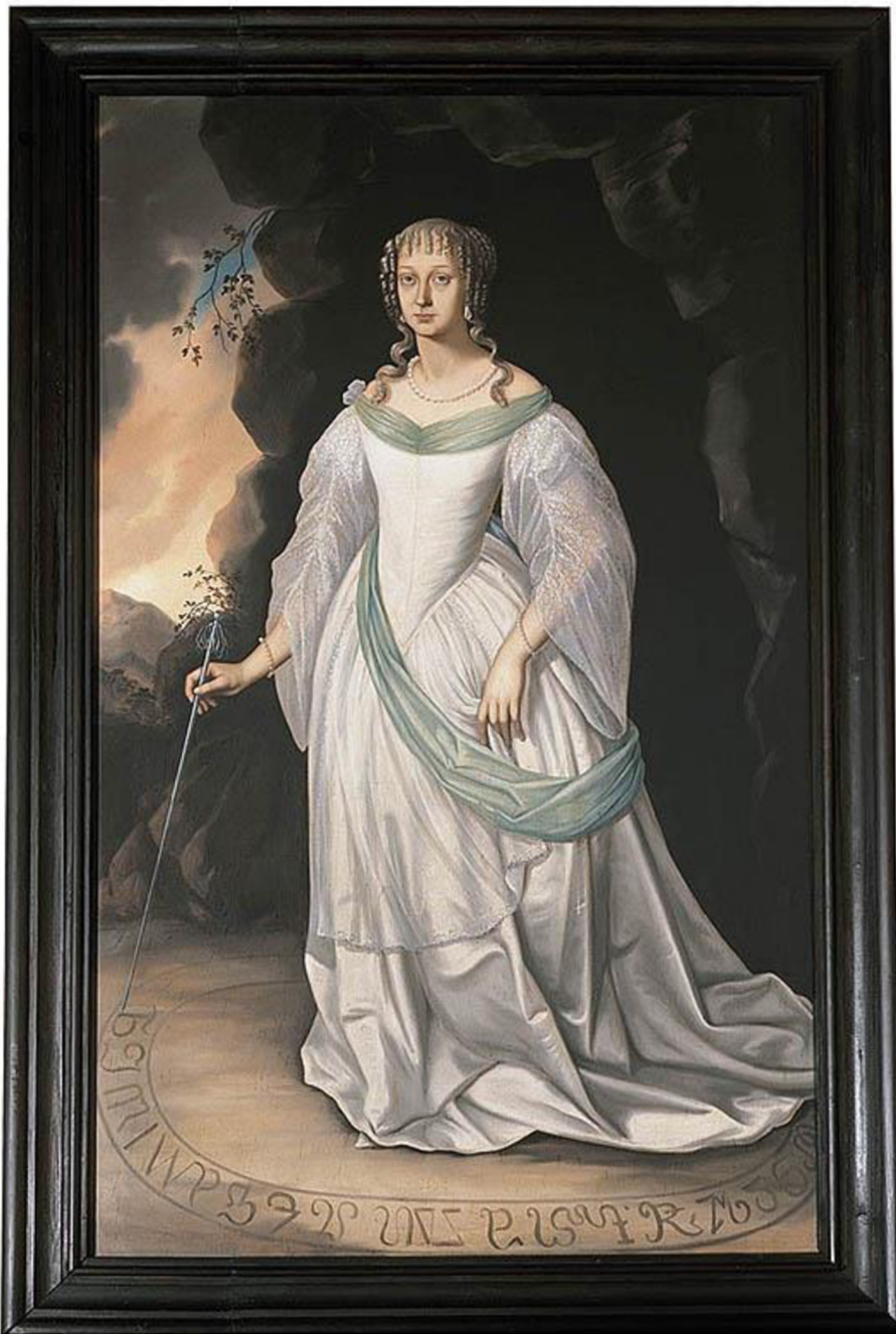
Obraz č. 8 – Portrét Perchty z Rožmberka z 19. století

Perchta z Rožmberka, portrét. In: Castle.ckrumlov.cz [online]. Český Krumlov [cit. 2023-04-07]. Dostupné z: https://castle.ckrumlov.cz/img.php?img=3743&LANG=cz