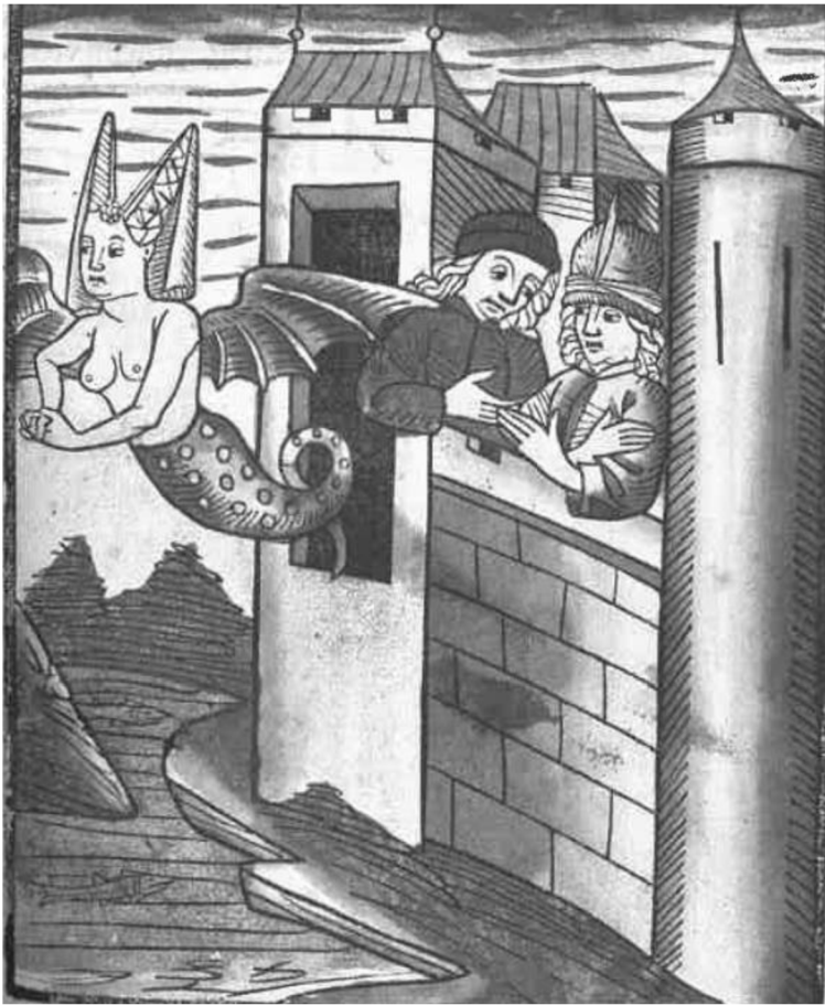
Obrázek č. 2 – Proměna Meluzíny

Zeldenrust, Lydia. The Mélusine Romance in Medieval Europe: Translation, Circulation, and Material Contexts . Boydell & Brewer, s. 47, 2020.