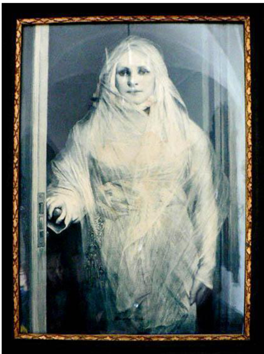
Obraz č. 11 – Bílá paní z hradu Bouzov