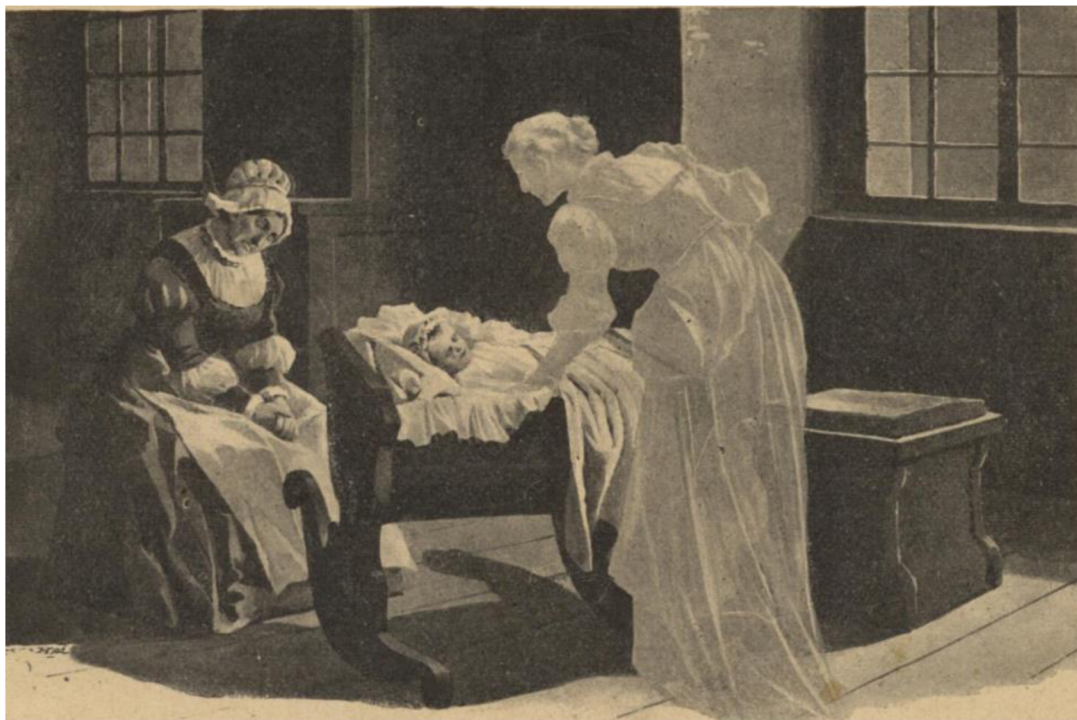
Obraz č. 13 – Ilustrace bílé paní ve Starých pověstech českých

JIRÁSEK, Alois a Věnceslav ČERNÝ. Staré pověsti české . V Praze: Jos. R. Vilímek, [1894], s. 279. Dostupné také z: https://kramerius5.nkp.cz/uuid/uuid:6beecc00-0e07-11e5-b309-005056825209