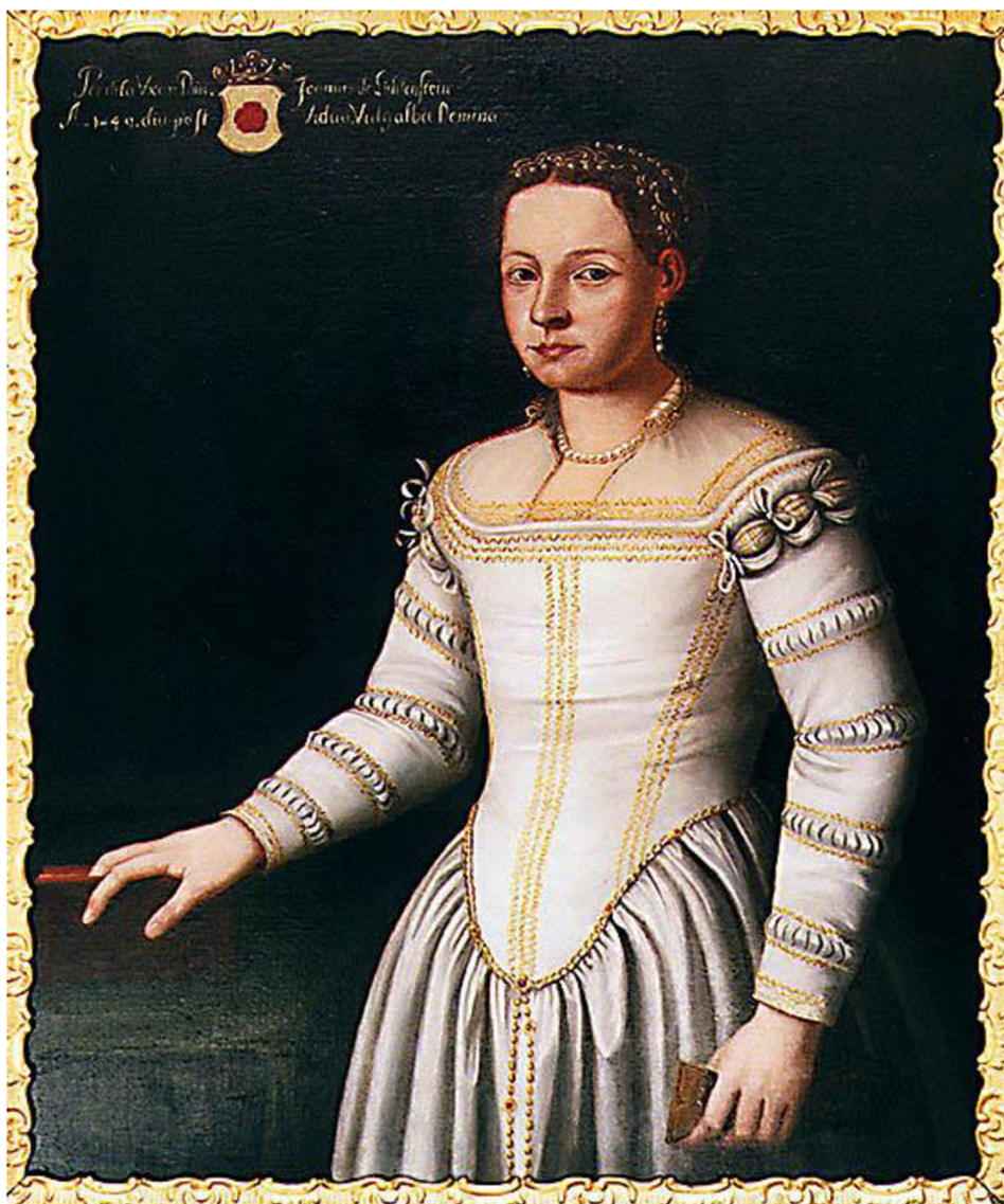
Obraz č. 7 – Portrét Perchty z Rožmberka z 16. století

Portrét Perchty z Rožmberka - tzv. Bílé paní. In: Castle.ckrumlov.cz [online]. Český Krumlov [cit. 2023-04-07].