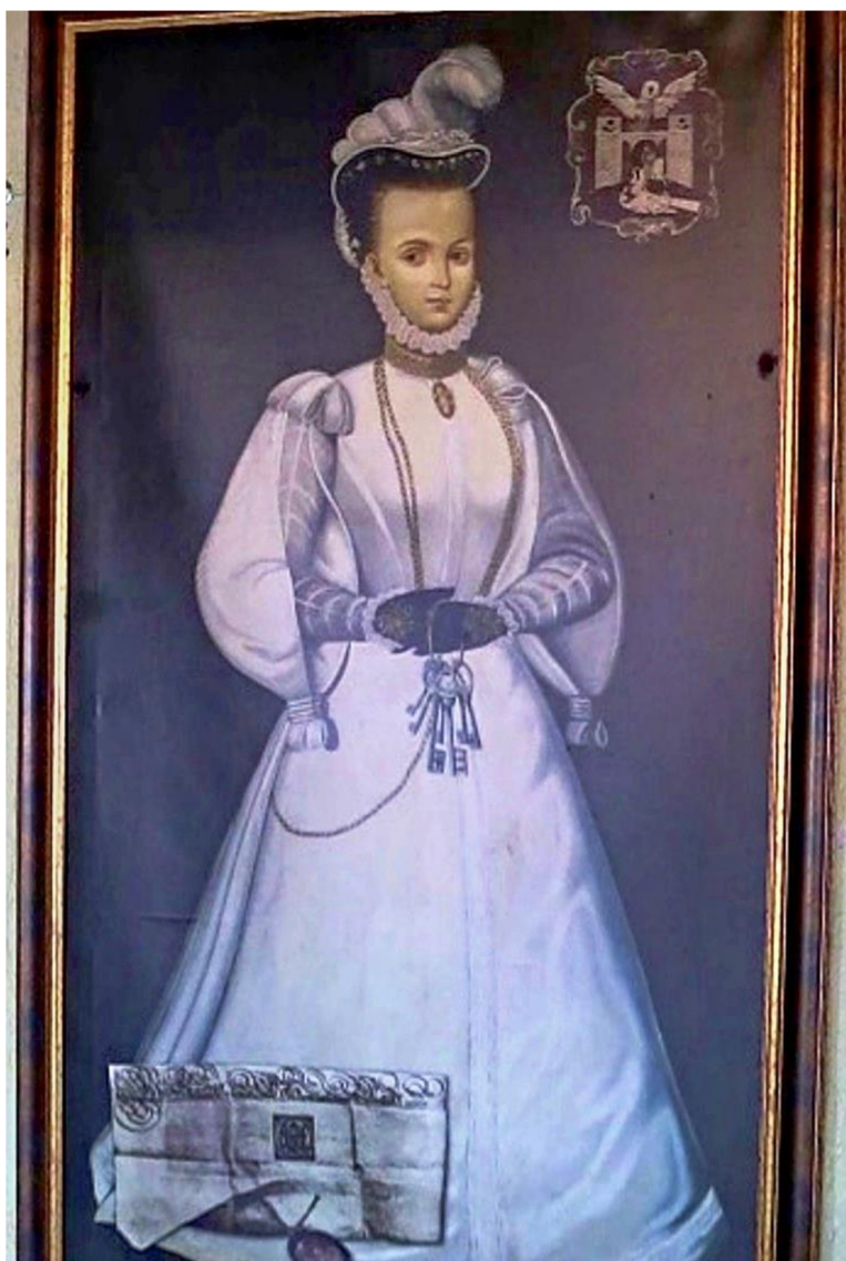
Obraz č. 10 - Bílá paní – zřícenina hradu Tolštejn

BUCHAROVÁ, Eva. Obraz Bílé paní v restauraci u zříceniny hradu Tolštejn. [fotografie] 2020. [online] [cit. 2023-04-07]. Dostupné z: https://sever.rozhlas.cz/povest-druha-z-tolstejna-pokud-jste-muz-ktery-nezhresil-muzete-osvobodit-bilou-8159763