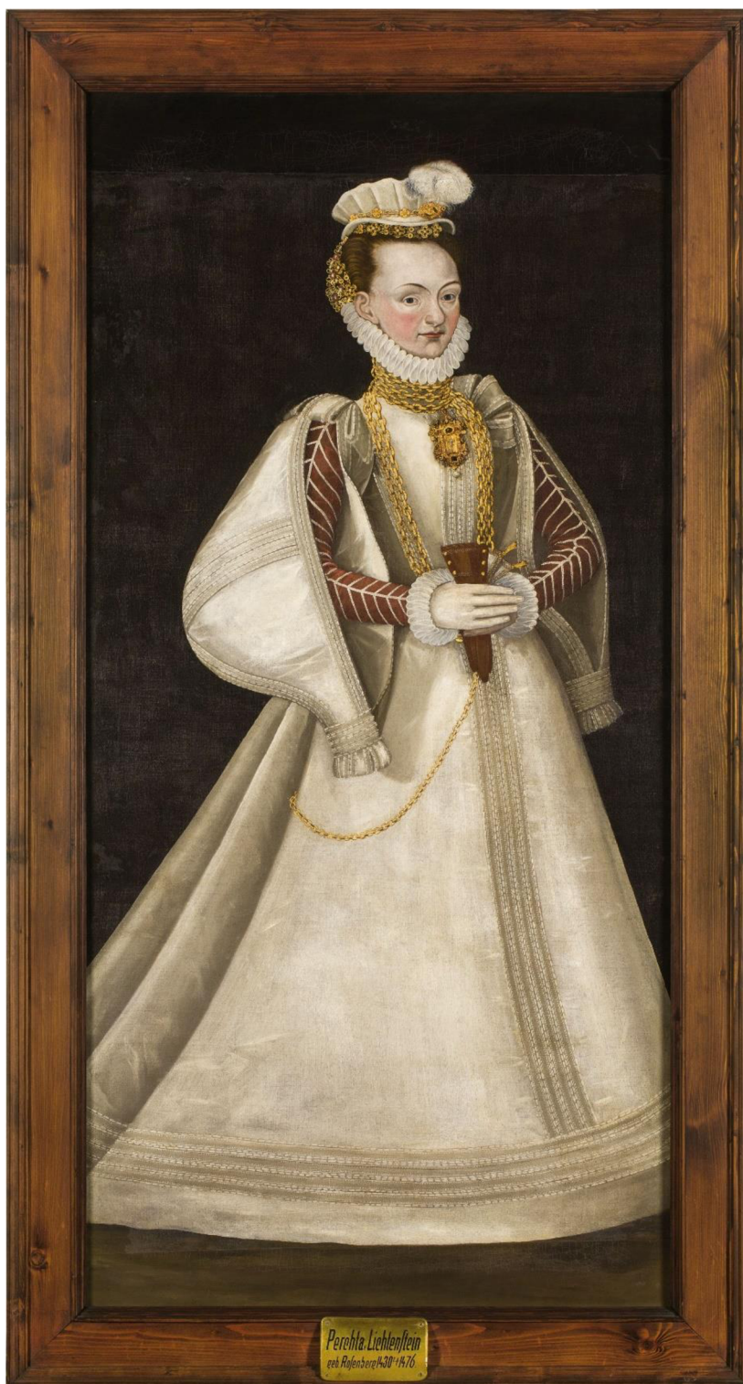
Obraz č. 9 – Portrét Perchty z Lichtenštejna

Perchta z Lichtenštejna. In: Npu.cz [online]. 2018 [cit. 2023-04-07]. Dostupné z: https://www.npu.cz/cs/novinky/31677-originaly-dopisu-perchty-z-rozmberka-jsou-az-do-konce-unora-k-videni-ve-sternberskem-palaci