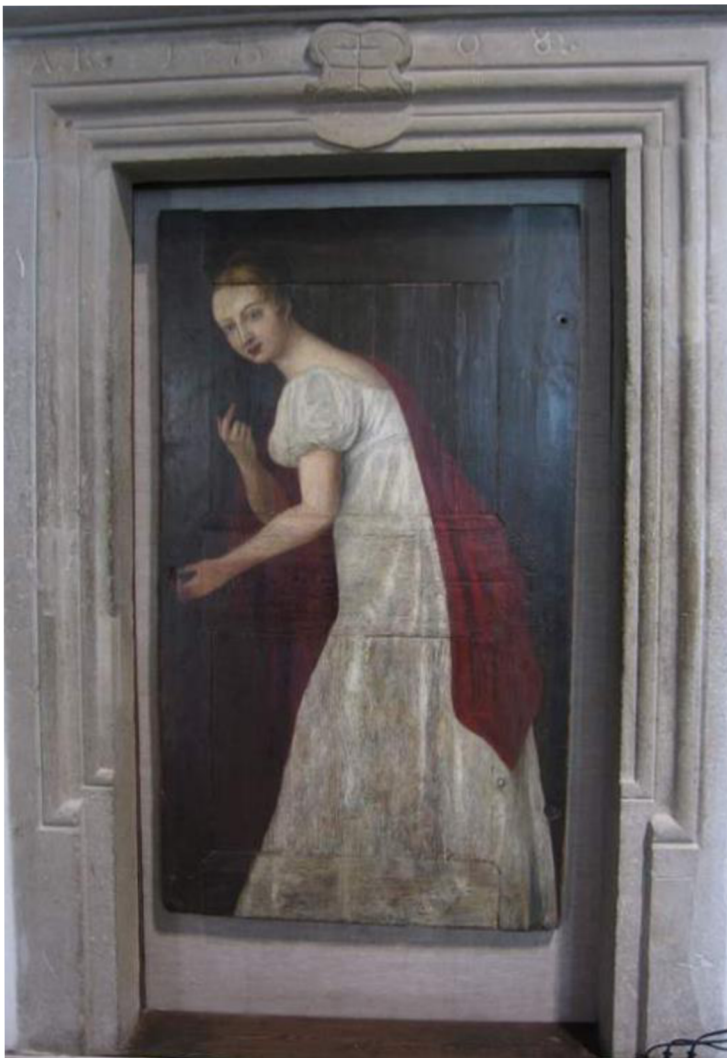
Obraz č. 14 – Obraz Juliany (bílá paní levočská)

MARCINOVÁ, Daniela. Levočská bílá paní. In: Korzář Spiš [online]. 2019 [cit. 2023-07-01]. Dostupné z: https://spis.korzar.sme.sk/c/22092188/spionka-a-zradkyna-ci-vernaz-do-posledneho-dychu-aka-bola-levocska-biela-pani.html