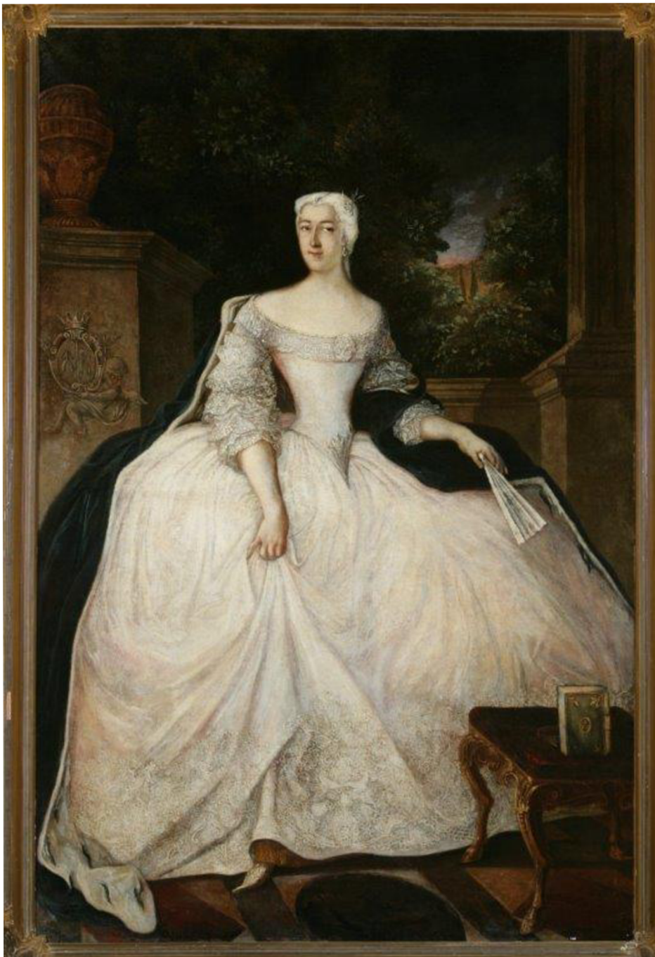
Obrázek č. 3 – Obraz Teofily Działyński (Polsko)

BIAŁA DAMA, CZYLI DUCH Z OBRAZU PORTRET TEOFILI Z DZIAŁYŃSKICH W ZAMKU W KÓRNIKU. In: Historia poszukaj portal edukacyjny [online]. [cit. 2023-03-08]. Dostępne z: