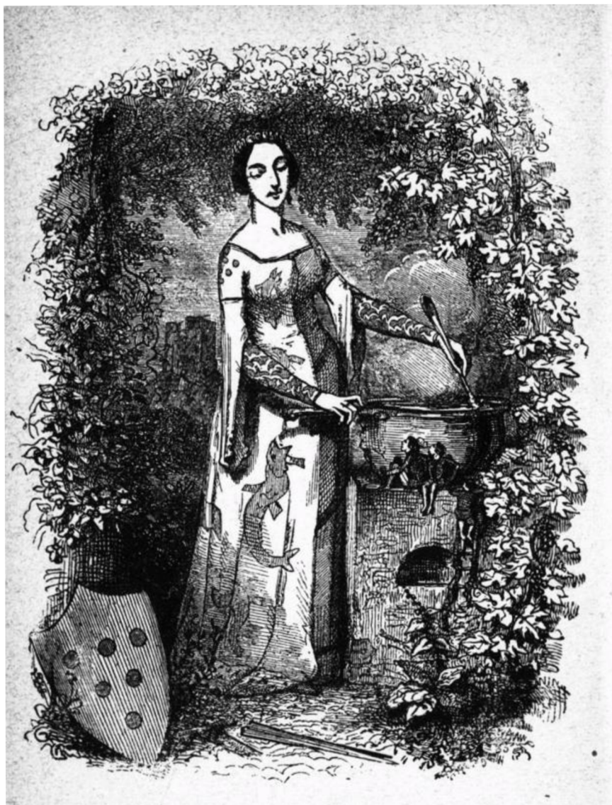
Obraz č. 12 – Bílá paní a vaření sladké kaše