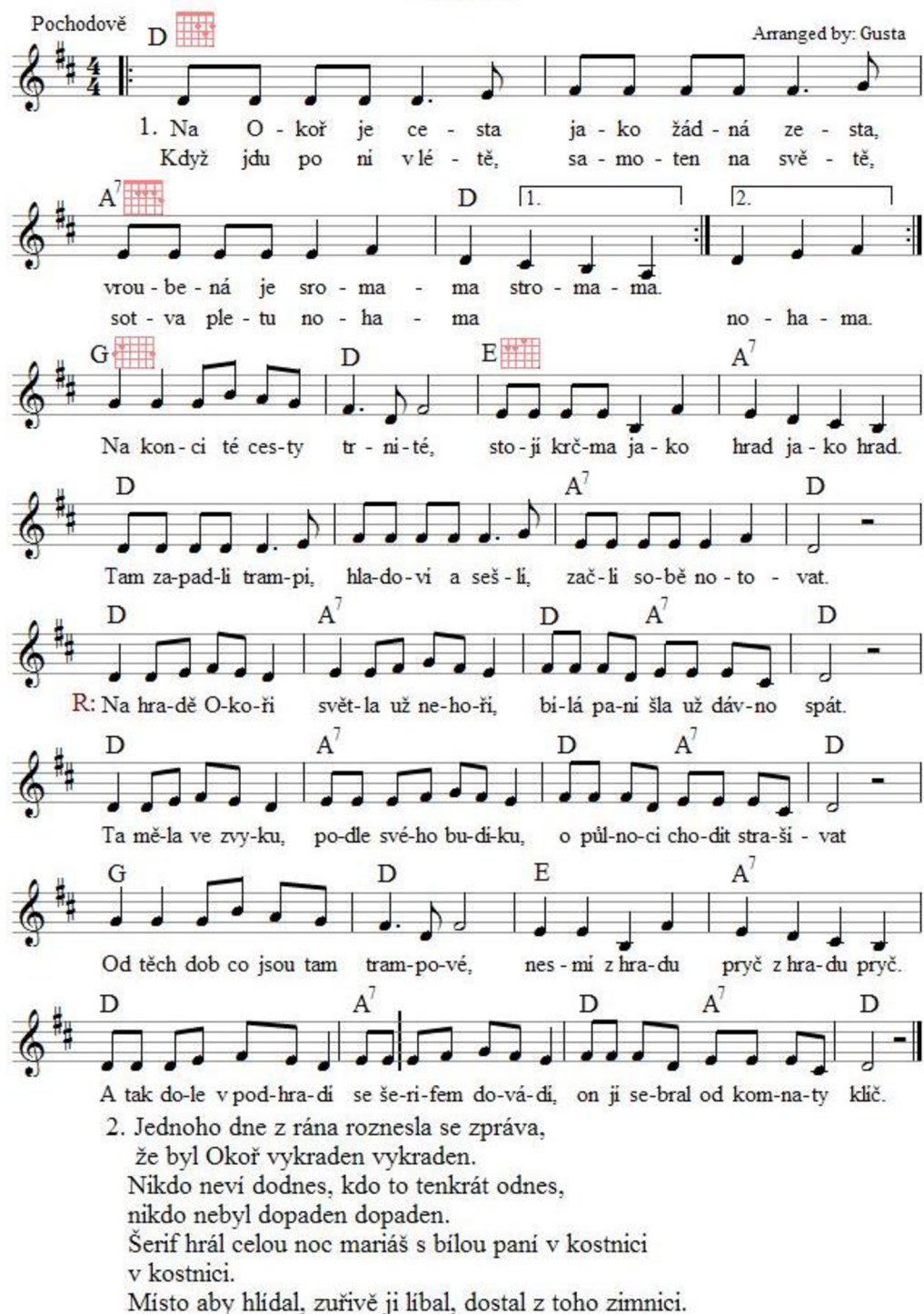
Obrázek č. 4 - Notový záznam písně Okoř

Okoř. In: Hudba.hradiste [online]. [cit. 2023-03-08]. Dostupné z: https://www.midisoubory.cz/U-NOTY.php?ID=3336b7300200