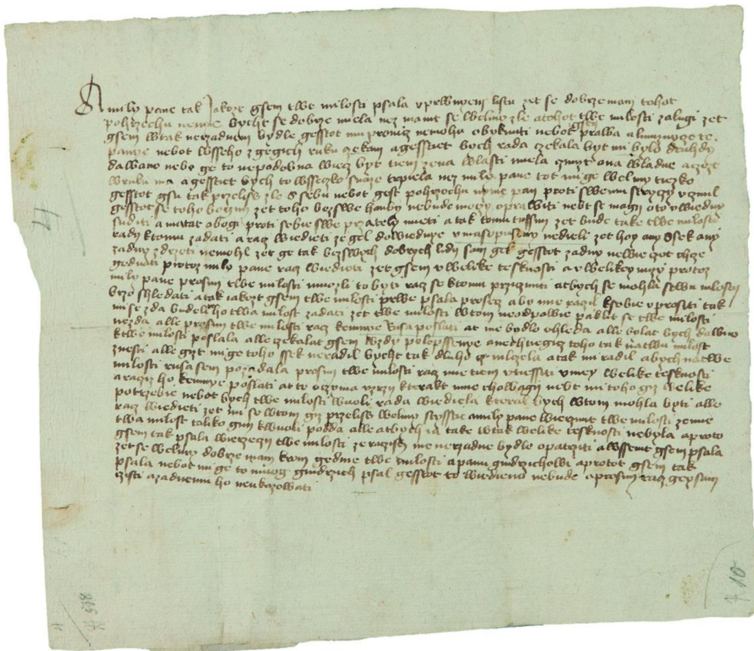
Obraz č. 6 – List Perchty z Rožmberka

Originály dopisů Perchty z Rožmberka. In: Národní památkový ústav [online]. 2018 [cit. 2023-06-29]. Dostupné z: https://www.npu.cz/cs/novinky/31677-originaly-dopisu-perchty-z-rozemberka-jsou-az-do-konce-unora-k-videni-ve-sternberskem-palaci